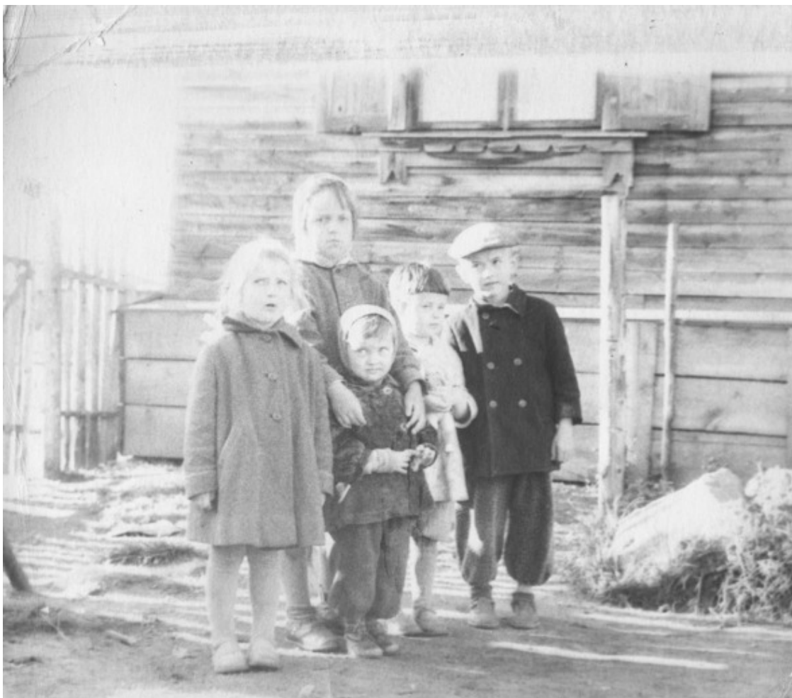
С девочками в клуб, 1961-й г.

чихах с начесом плотно обхватывают лодыжки. На маленьких ножках – растоптанные ботинки на шнурках, которые я не могу самостоятельно завязать. На стриженной голове – кепка плоским блином с затертым козырьком. Примерно так выглядели и все мои приятели.