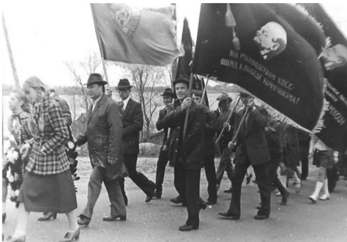
9 мая 1983 г. ежегодное шествие поросозерцев на братскую могилу

Об этом запрещено было тогда говорить. Война оказалась для громадного количества людей тяжелейшей физической и нравственной мукой, которую многие не выдержали. Наверняка архивы хранят эти цифры. Может, стоит их обнародовать? Может, они устрашат людей затевать новые кровавые войны?