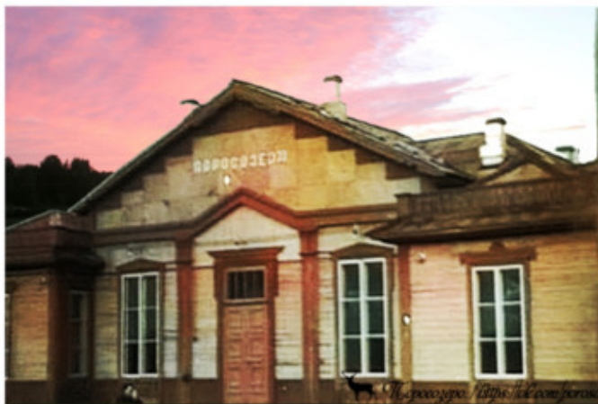
1953 г. солдаты строят вокзал