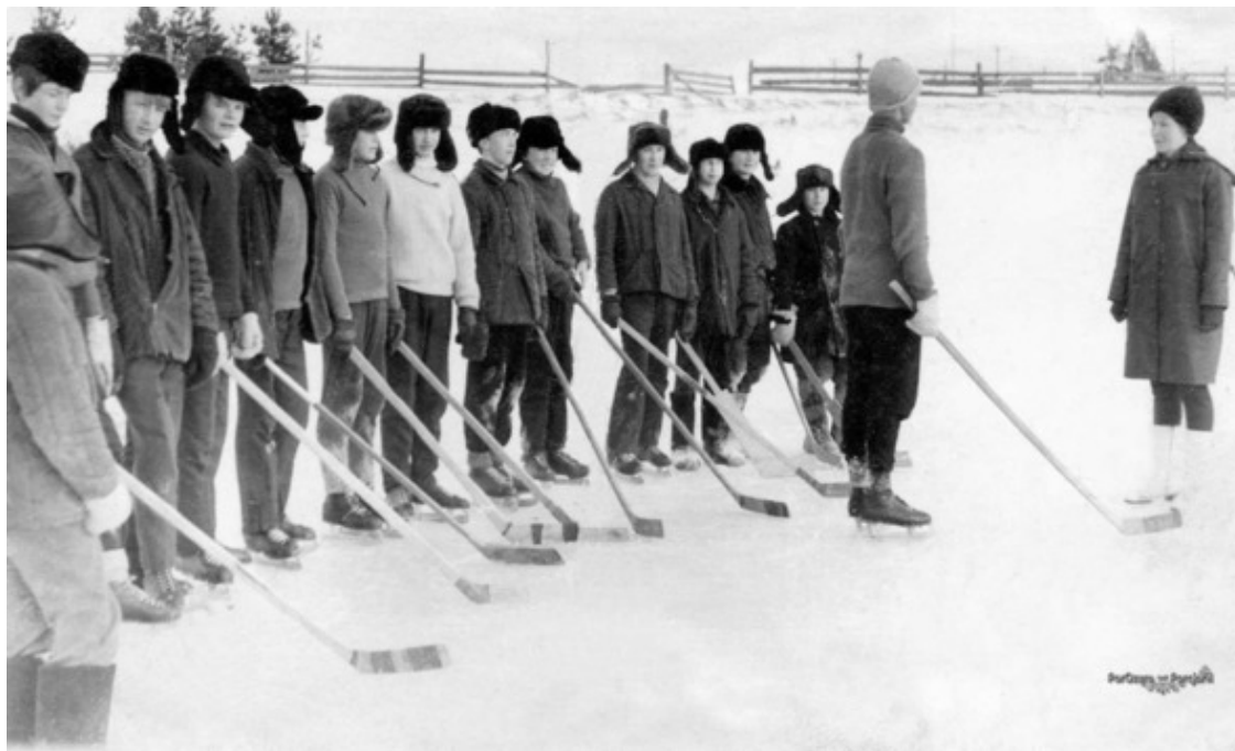
1970 г. Хоккейная дружина из Аконьярви готова к матчу