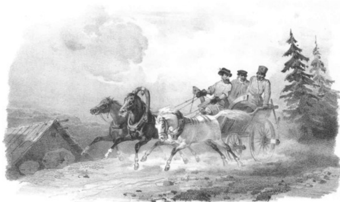
Aug e de Montferand del.

После этого все планы и детали, различные модели и все предложения для выполнения работ, были последовательно приняты без каких-либо изменений, участниками Комиссии. Этот трактат – всего лишь точная запись моих журналов и верное выполнение чертежей, которые служили для строительства монумента.