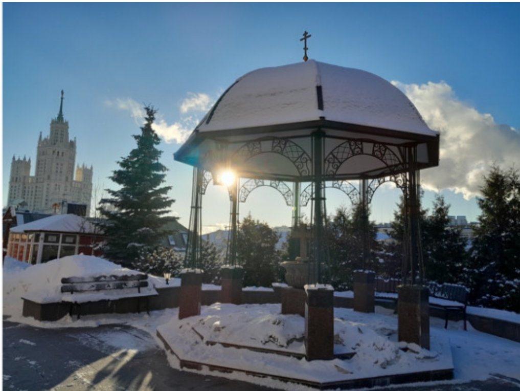
Беседка с источником. 08.01.2024

На территории храма установлена беседка и сооружен источник – где проводится освящение воды на праздник Крещения.