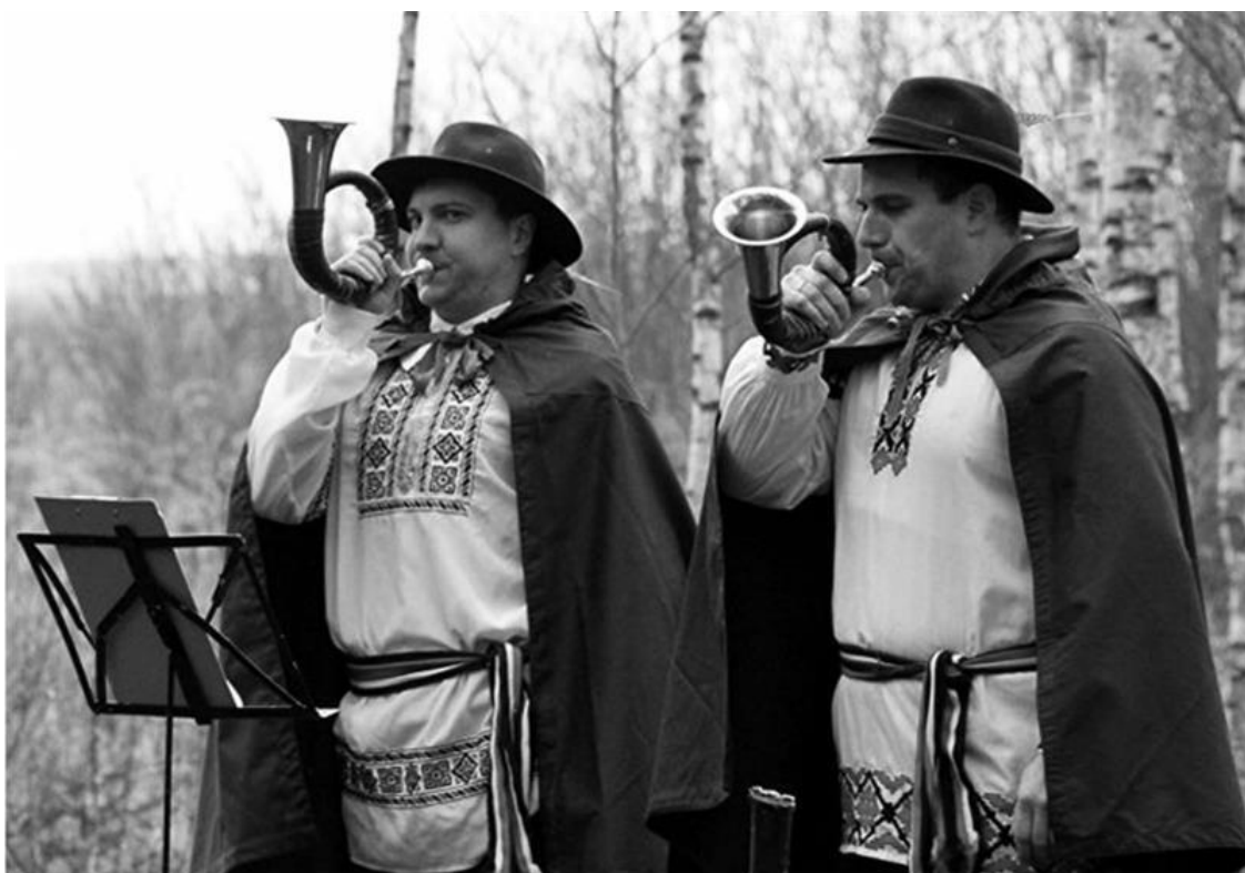
Охотничий дуэт «Дед Бекас», г. Дрогичин