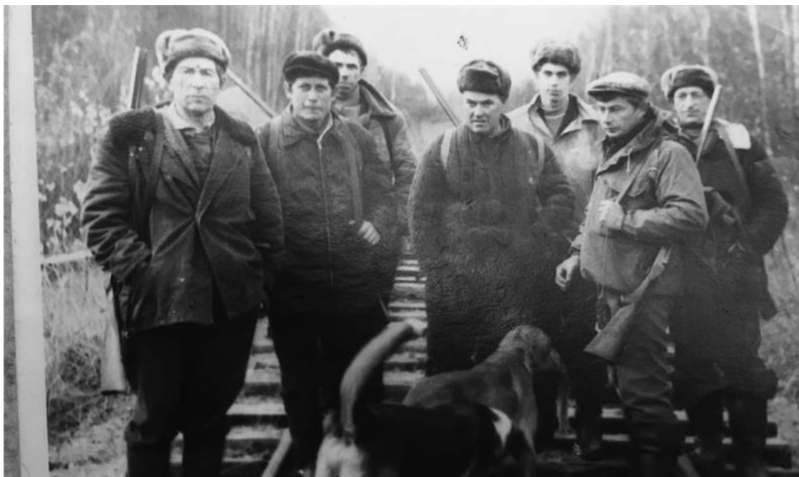
Охотники д. Белев