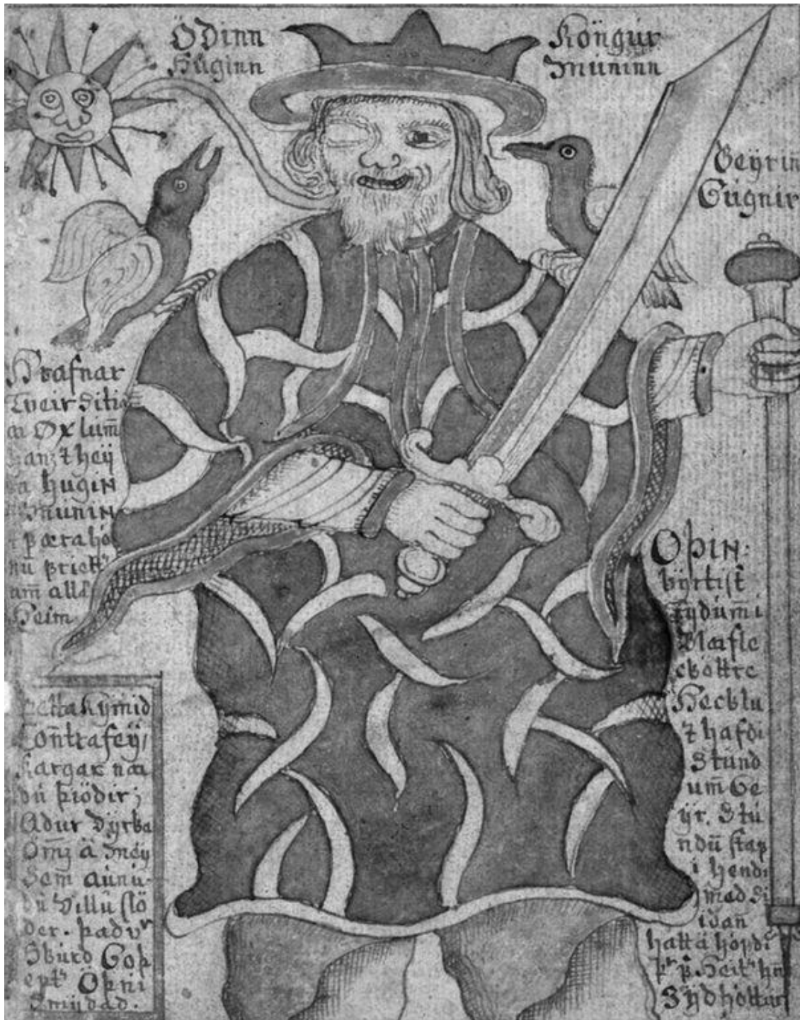
Один. Иллюстрация из исландской рукописи XVIII века

древности хороший мастер был ничуть не менее уважаем, чем жрец или правитель. Например, оружейники весьма почитались в суровом германском обществе – ведь они создавали предметы, от которых в буквальном смысле зависела жизнь их обладателя. И нанесение защитных рун на наконечники копий, рукояти мечей и щиты было весьма распространено.