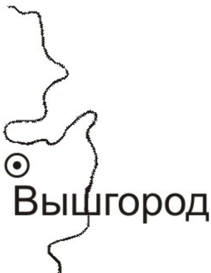
Схема располо Белозерского “

затруднений не вызвала. Такие объекты приводятся без пояснений вышеназванного харак-