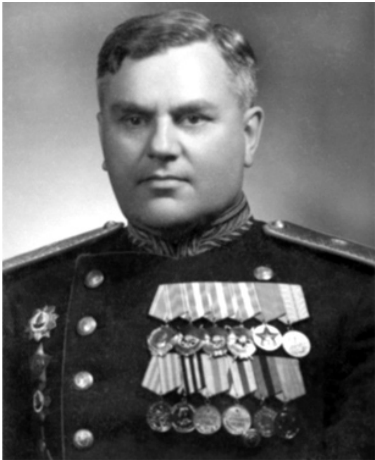
Рогов Александр Семенович – начальником разведки Юго-Западного фронта