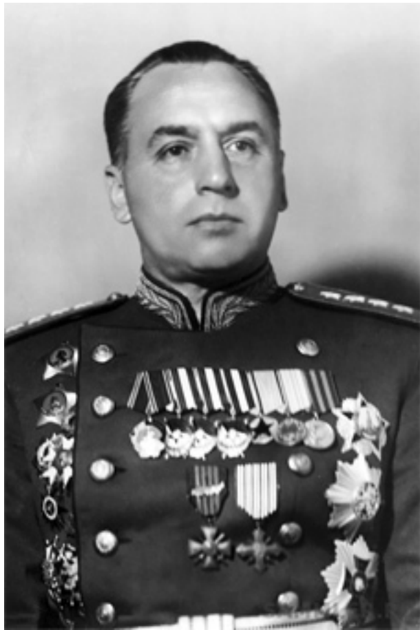
Антонов Алексей Иннокентьевич – начальник Генерального штаба РККА