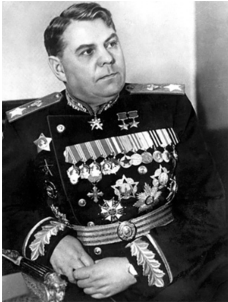
Василевский Александр Михайлович – представитель