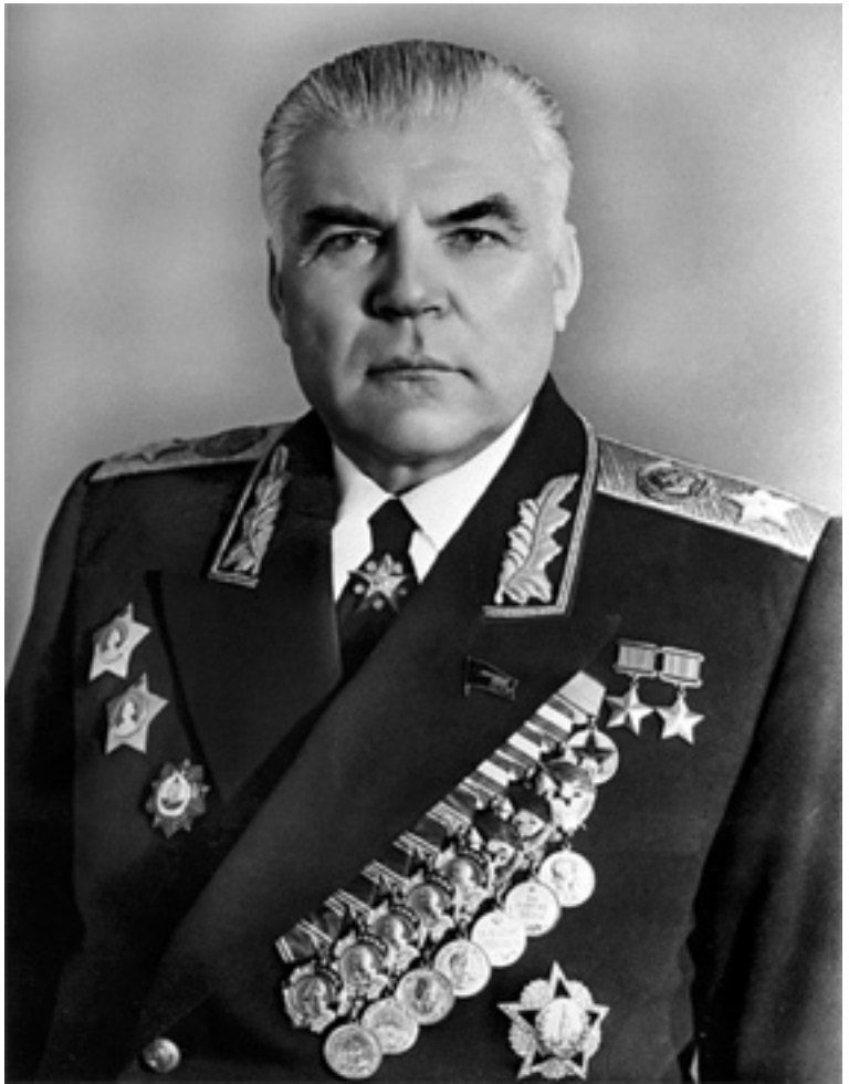
Родион Яковлевич Малиновский – командующий Юго-Западным фронтом