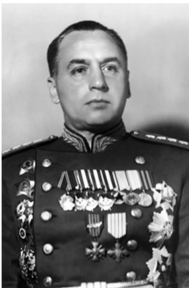
Антонов Алексей Иннокентьевич – начальник Генерального штаба РККА