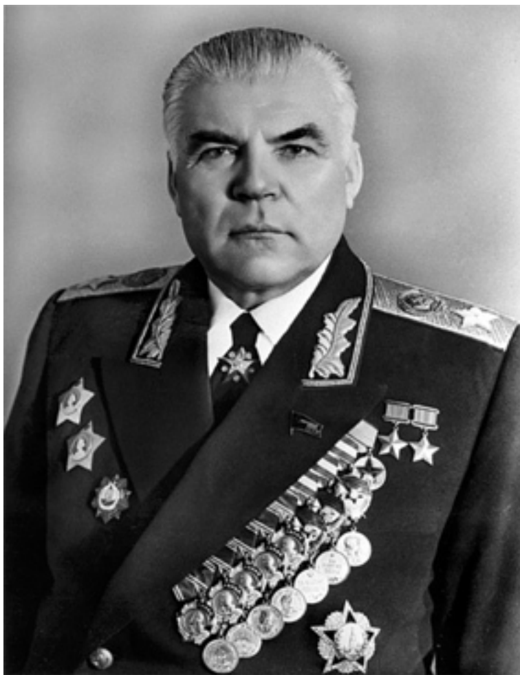
Родион Яковлевич Малиновский – командующий Юго-Западным фронтом

Командующий фронтом Родион Малиновский, понимая предстоящую необходимость форсировать реку Северский Донец, усилил 8гв. А 8-м понтонным полком и 28-м отдельным понтонным батальоном. В свою очередь, 1 гв. А получила 52-й и 53-й батальоны 11-й штурмовой инженерно-саперной бригады, командующий фронтом категорически запретил использовать штурмовиков-саперов как обычную пехоту.