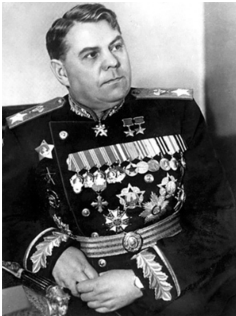
Василевский Александр Михайлович – представитель Ставки ВГК на Южном и Юго-Западном фронтах летом 1943 года

Из 6-й армии в 8-ю гвардейскую армию передавалась 9-я гвардейская пушечная артиллерийская бригада, туда же направили 45-й гвардейский минометный полк. Из 6-й армии в 8 гв. А перебрасывалась 11-я артиллерийская дивизия прорыва (без 31-й легкой артиллерийской бригады), сюда же из 3 гв. А ушли: 23-я минометная бригада, 30-я пушечно-гаубичная артиллерийская бригада, 222-й гвардейский пушечный артиллерийский полк, 1232-й пушечный артиллерийский полк и 58-й гвардейский минометный полк. Все эти части должны были на новом месте к 12 июля 1943 года.