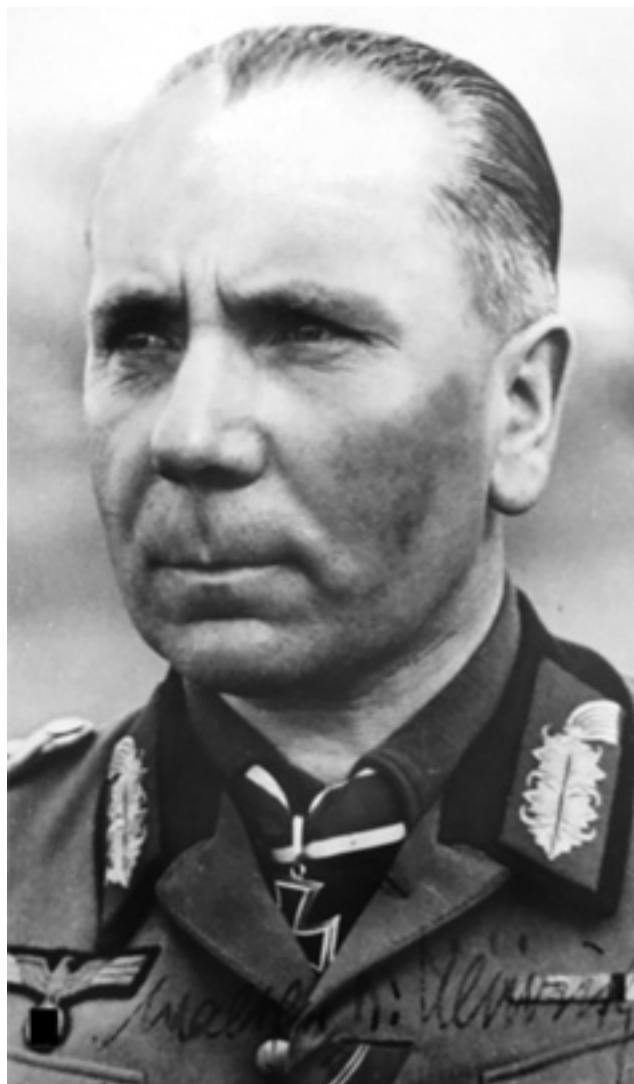
Вальтер Неринг – командир 24-го танкового корпуса

Одним из успешных факторов операции должна была стать качественная работа разведывательных органов фронтов и армий – они должны были все знать об оперативных резервах противника и их перемещении. В данном случае речь идет о немецком 24-м танковом корпусе, фактор присутствия или отсутствия которого в полосе советской наступающей группировки Юго-Западного фронта играл огромное значение для успеха будущей операции.