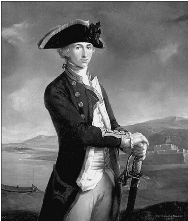
Горцио Нельсон в юности. Художник Дж. Ф. Риго

Попасть на боевые суда, готовящиеся к отплытию в Вест-