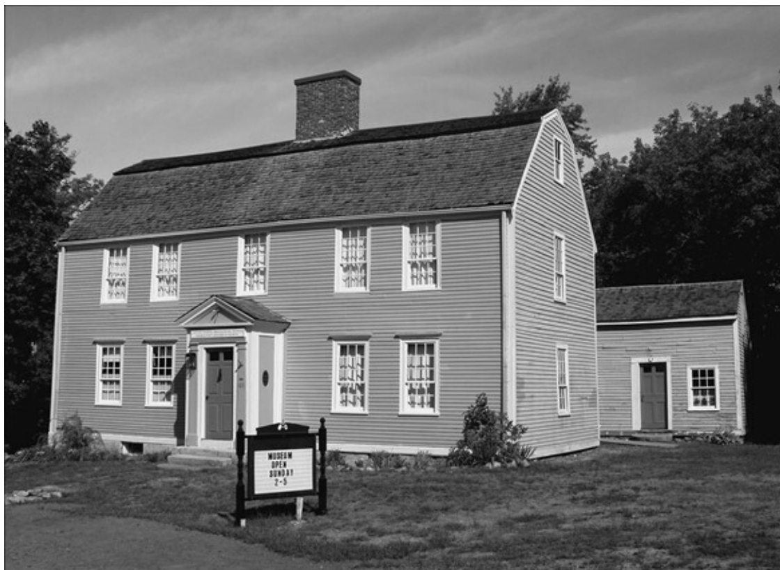
Дом в Бичер-Хаус, где родился Нельсон

Весной 1770 года Горацио Нельсон прочитал в газете, что Морис Саклинг только что назначен капитаном 64-пушечного линейного корабля «Резонабль», недавно захваченного у французов, и теперь активно готовит его к предстоящим боям с испанцами. Он тут же побежал к старшему брату Уильяму и попросил его написать отцу, что он хочет служить у дядюшки Мориса.