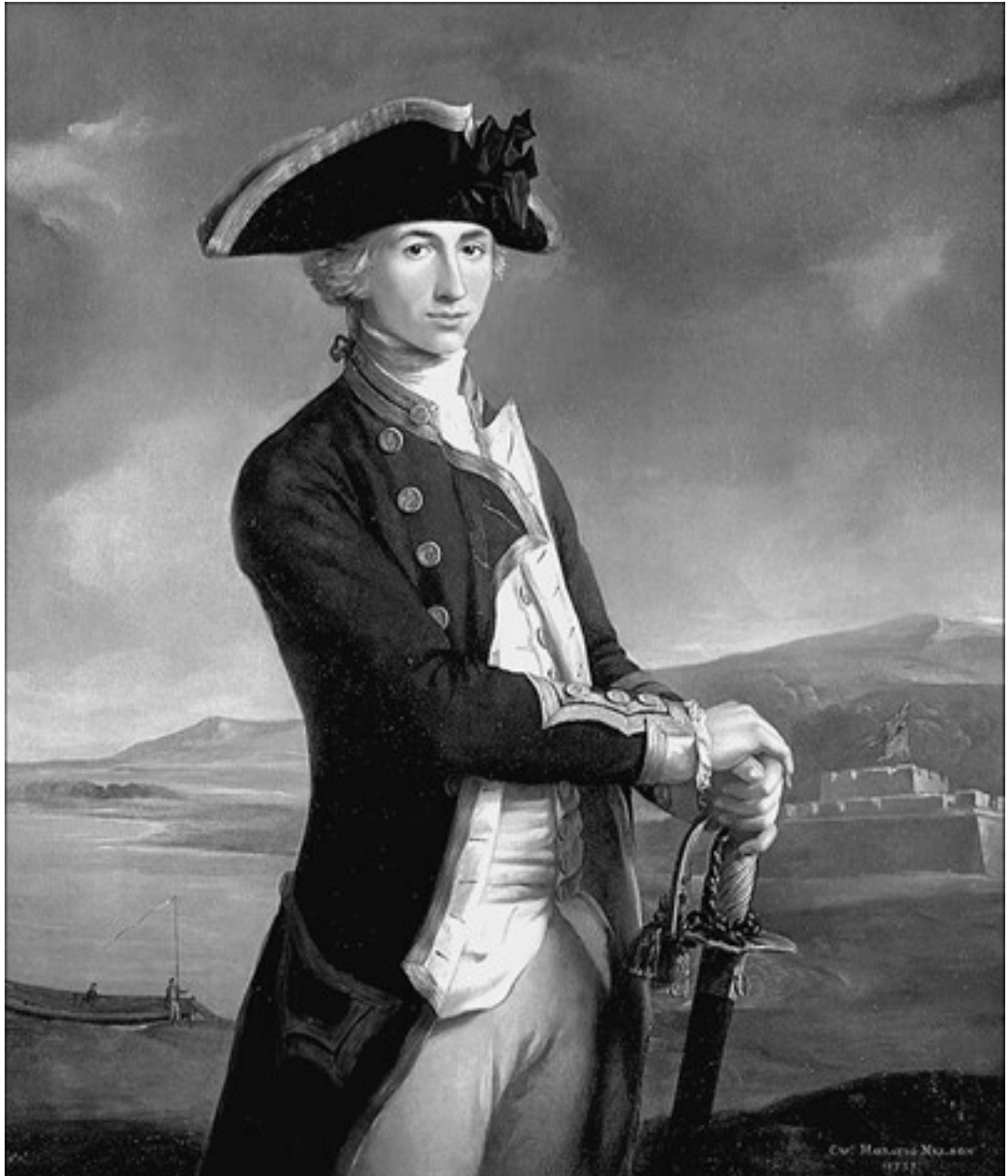
Горцио Нельсон в юности. Художник Дж. Ф. Риго

Попасть на боевые суда, готовящиеся к отплытию в Вест-Индию, было в те дни заветной мечтой каждого английского моряка. Предстоящая кампания обязательно должна была сопровождаться многочисленными захватами американских торговых судов и, как следствие этого, большими призовыми деньгами.