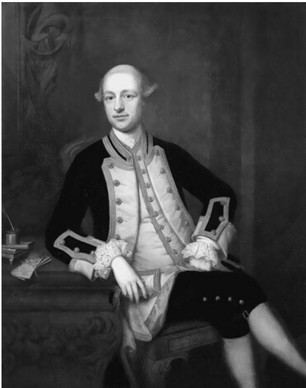
Морис Саклинг. Художник Т. Бардвелл

В ноябре 1773 года бриг «Сихорс» покинул Спитхедский рейд вместе с фрегатом «Солсбери», на котором развевался контр-адмиральский флаг Хьюза.