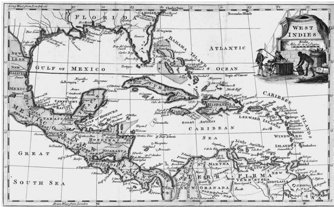
Английская карта Вест-Индии XVIII в.

Служба по охране побережья была достаточно беспокойной. То и дело приходилось гоняться за судами контрабандистов, которых было вокруг видимо-невидимо. При этом их капитаны шли на все, чтобы спрятать судовые документы. Однажды Нельсону пришлось в течение трех суток искать бумаги, пока в конце концов они не были обнаружены в чем-то старом башмаке.