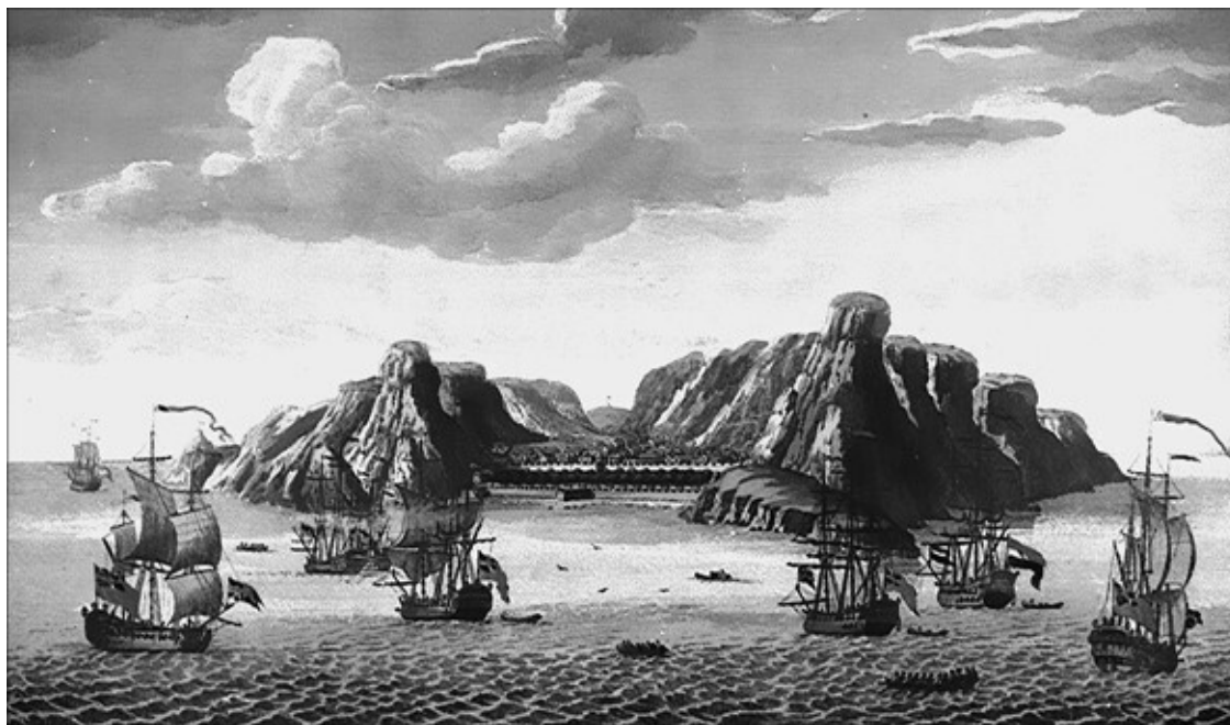
Английские корабли в колониальных водах. Старинная гравюра

Спустя некоторое время Нельсона приглашают в адмиралтейский департамент укомплектования, где сухонький старичок из бывших капитанов, пошелестев бумагами, предложил Нельсону старенький 28-пушечный фрегат «Борей», который готовился сейчас на верфи к отправке для несения дозорной службы к Подветренным островам Вест-Индии.