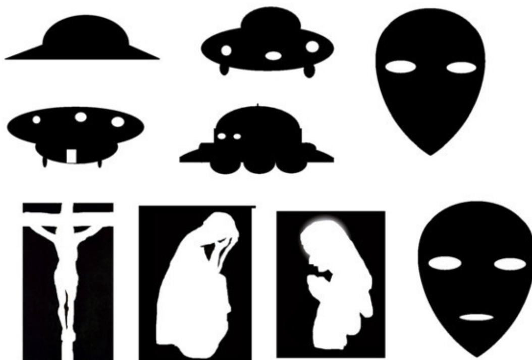
Так выглядят карточки «Метода Черно-белых фигур»

Инструкция: Я буду ВАМ предоставлять карточки ВЫ должны ответить на вопрос, «Какие ассоциации у ВАС возникают при виде той или иной фигуры?» Сочините рассказ о каждой предъявляемой ВАМ фигуры.