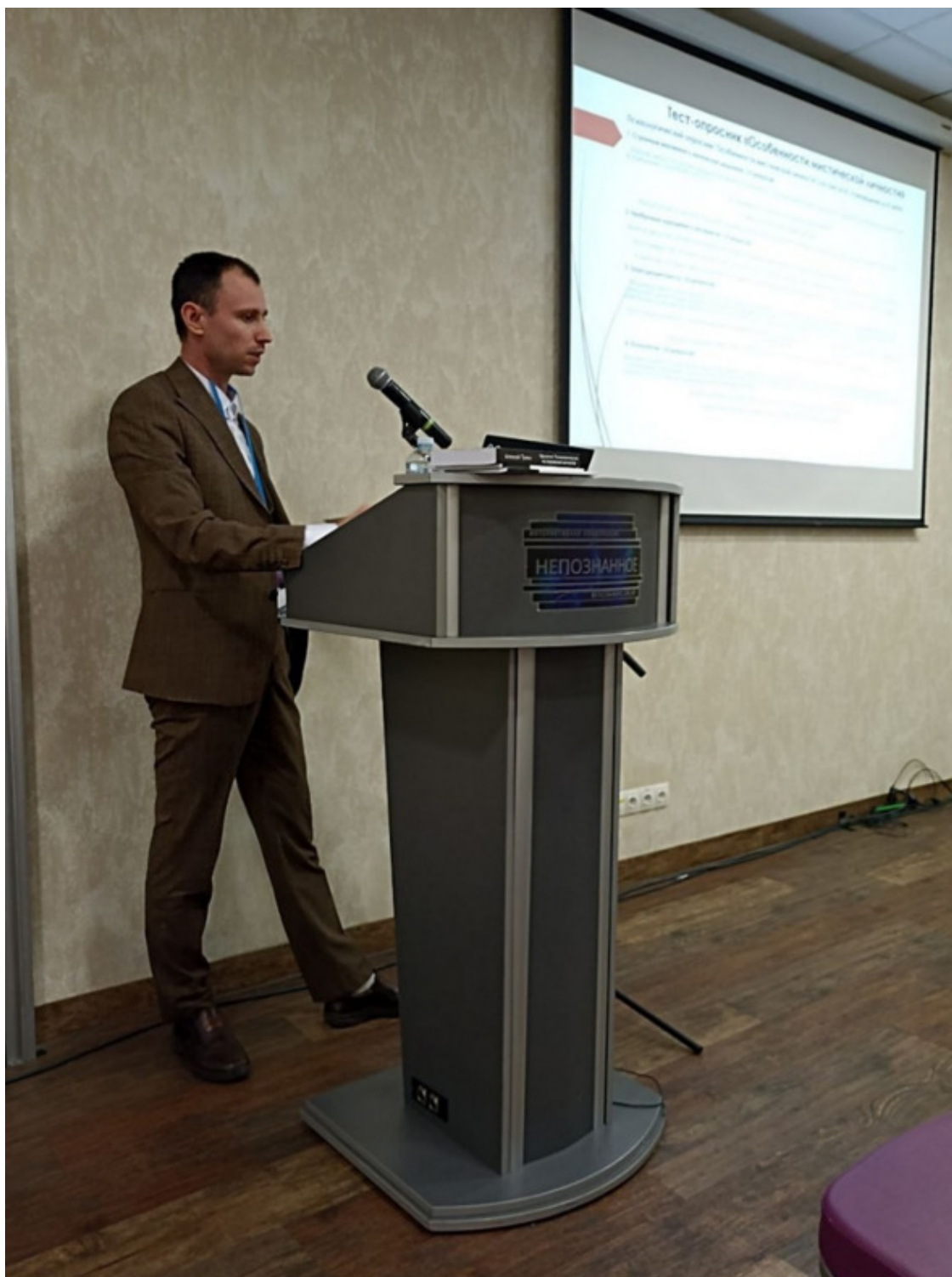
Мое выступление на конференции «Непознанное» в 2023 году на тему «Уфологическая психология»