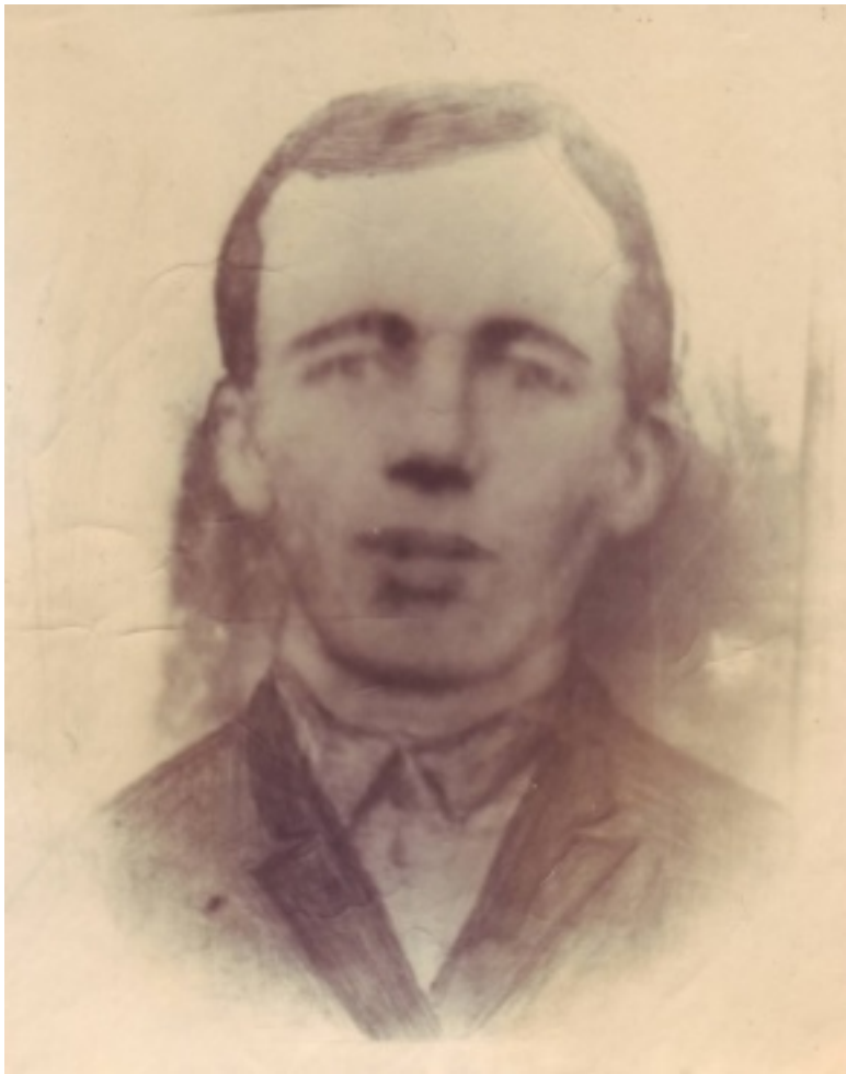
Участник войны родился в селе Косой Брод Полевского