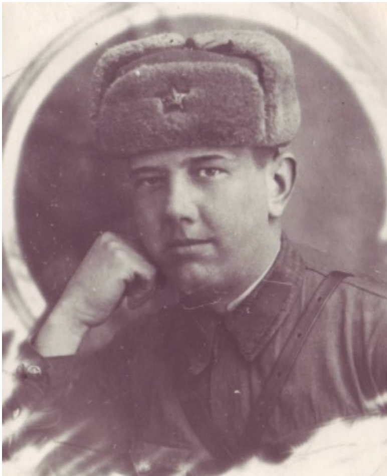
Участник Великой Отечественной войны проживал в селе