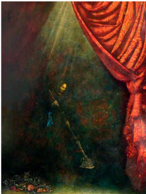
Художник Андрей Закирзянов