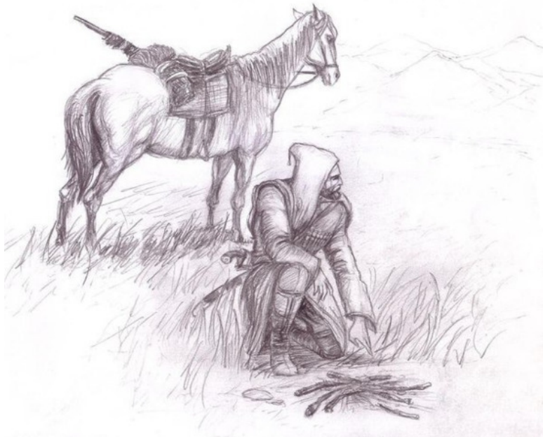
Сург диллинарг Айтек Дуг