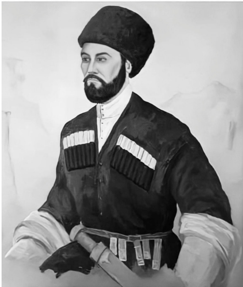
Нохчийн обарг Довта-МартанГера Кута