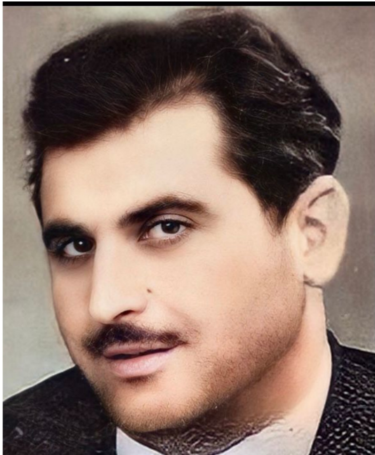
Ратиани Мурман – кху жайни бух биллинчу архивни кехатийн а, талламийн а автор