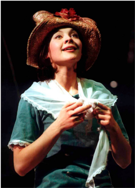
Юлия Рудина в роли Поллианны