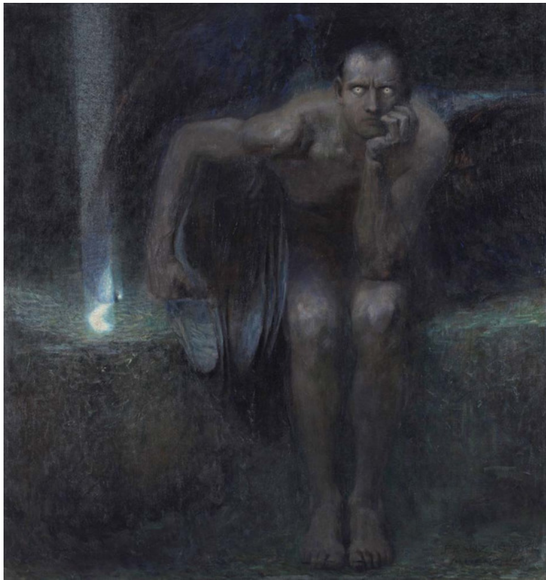
«Люцифер», Франц фон Штук. 1890г. Холст, масло. Размер: 161 x 152,5 см. Национальная галерея зарубежного искусства, София, Болгария