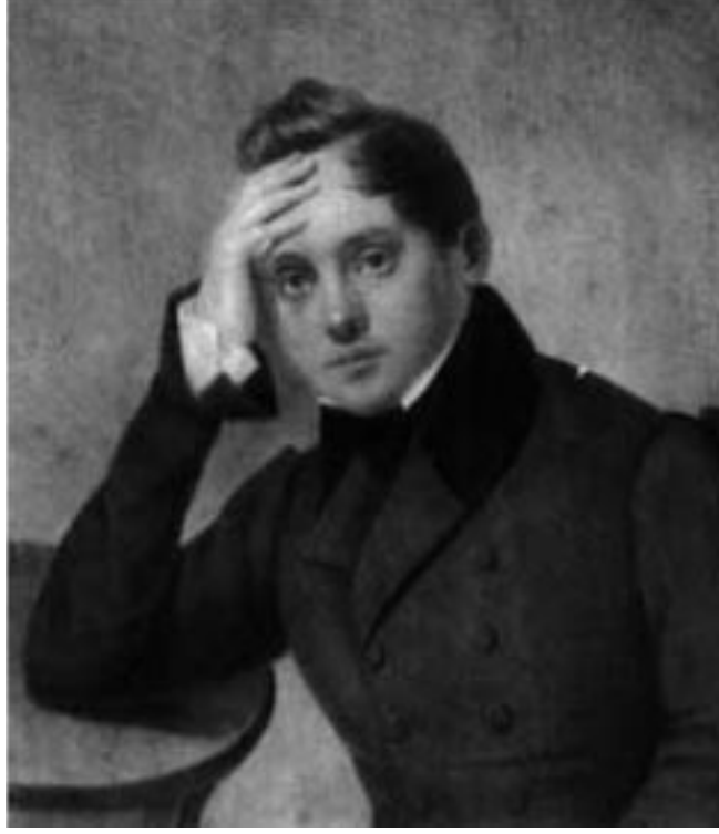
YEVGENİ BARATİNSKİ (1800 – 1844)

19. Yüzyıl Rus şiirinin en önemli şairlerinden biri olan Yevgeni Abramoviç Baratinski, 19 Şubat 1800'de Tambovştine' de doğdu ve çocukluğunu "Mara" adlı bir köy çiftliğinde geçirdi. Kirsanov kasabası ilçe sınırları içinde bulunan Tambovskoe malikânesi şairin babası tuğgeneral Abram Andreyeviç Baratinski'ye o zamanın çarı I. Pavel tarafından 1796 yılında vatanına yaptığı büyük hizmetlerin-den dolayı ödül olarak verildi.