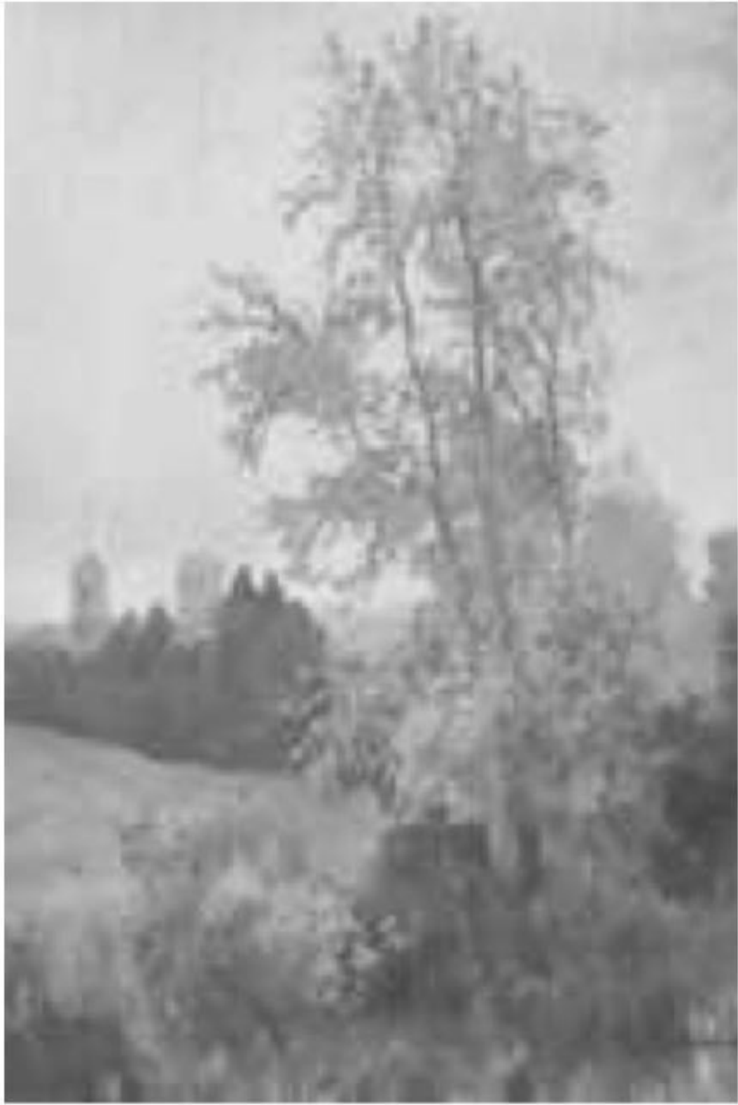
И. И. Левитан, Осенний пейзаж с церковью , 1890.