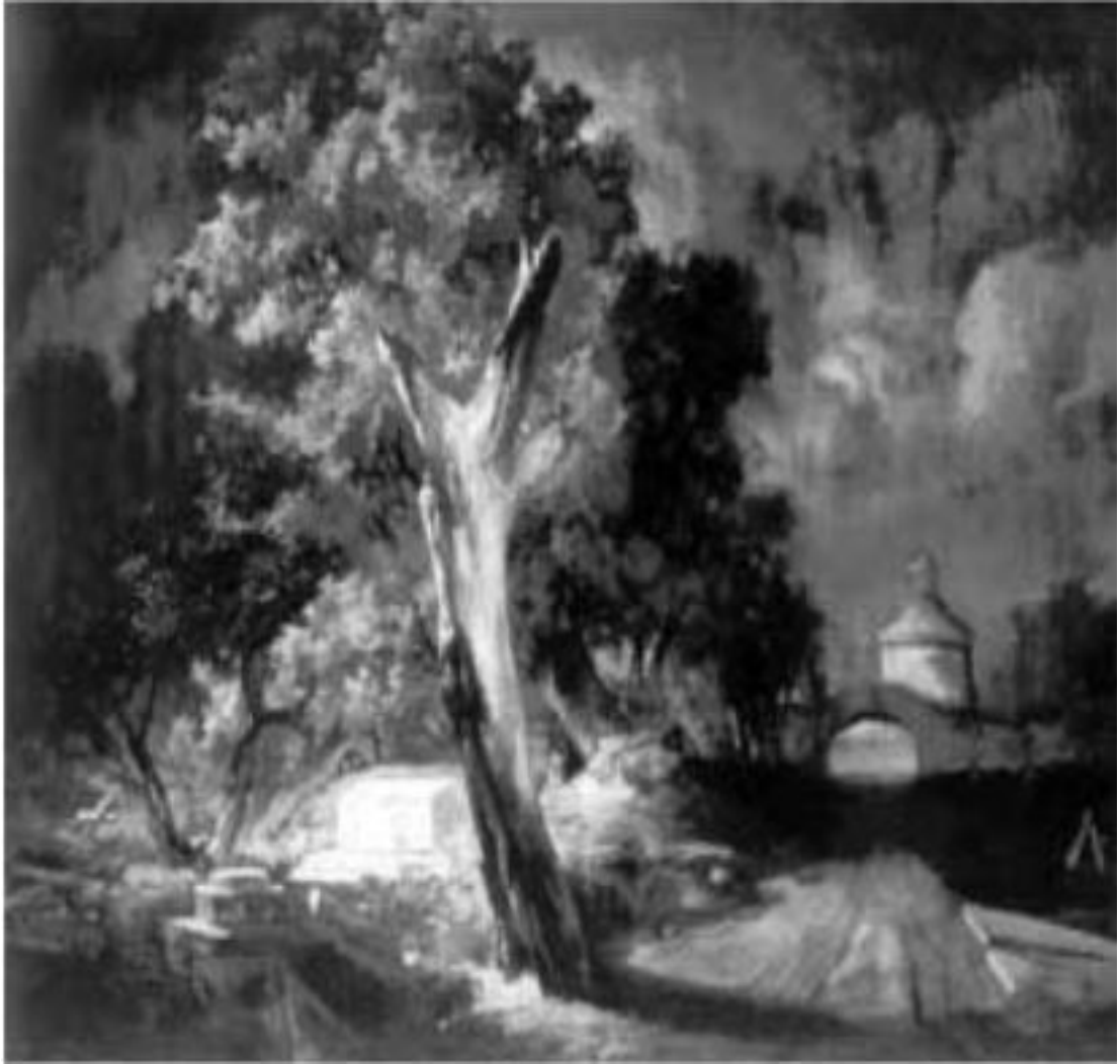
Г. А. Баумер, Кладбище , 1881.