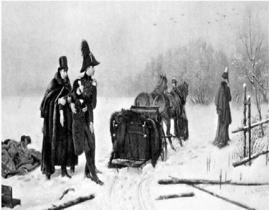
A. A. Наумов, Дуэль Пушкина с Дантесом , 1885. A. A. Naumov, Puşkin'in d'Anthes'le Düellosu , 1885.