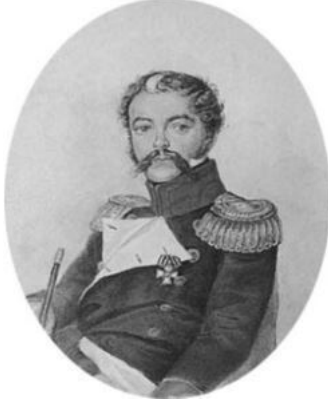
DENİS DAVIDOV (1784 – 1839)

Bir savaş yazarı ve şair olarak bilinen Denis Vasiliyeviç Davidov, 16 Haziran 1784 tarihinde Moskova'da soylu bir ailede dünyaya geldi. Yaşamı boyu çocukluğunda (dokuz yaşındayken) efsanevi Rus komutanı A. Suvorov'la karşılaşmasını ve büyük karhamanın onun hakkında söylediği "Bu çocuk gelecekte gerçek bir asker olacak" sözlerini hiç unutmadı. Nitekim bilinçli ömrünün çok büyük bir bölümünü, 1832 yılında tümgeneral olarak ayrıldığı, askerlik hizmetine adadı.