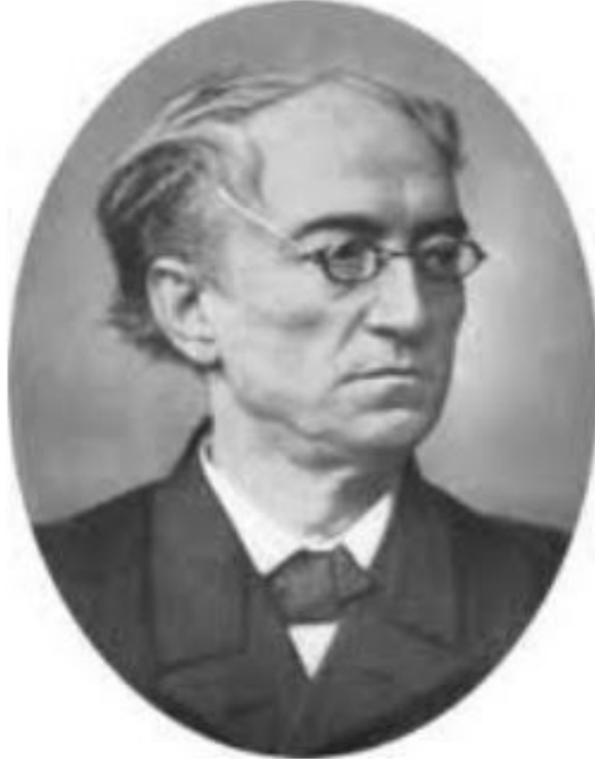
FYODR TYUTÇEV (1803-1873)