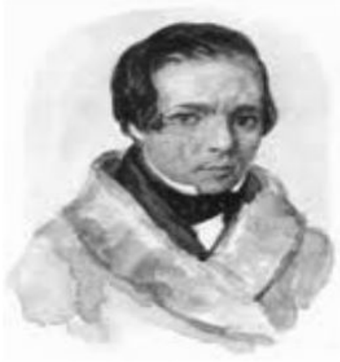
ALEKSEY KOLTSOV (1809 – 1842)

Ünlü halk şairi Aleksey Vasileviç Koltsov, 3 Kasım 1809 tarihinde, Voronej’de hayvan tüccarlığı yapan bir esnaf ailesinde doğdu. Küçükken belli başlı bir öğrenim görme fırsatı bulamadı. Dokuz yaşında Voronej ilçe okuluna verildiyse de, babasının ticaret işlerinde yardımcı olması gerekçesiyle, kısa bir süre sonra oradan alındı. Bundan sonra şairin tüm yaşamı tamamen paragöz babasının ‘ma rifetli’ ellerince yönlendirildi. Bilime gösterdiği ilgi babası tarafından gaddarca engellendiği için sürekli gizli gizli okumak zorunda kaldı. 16 yaşındayken, herkesin gözünden uzak, kitap sayfalarında gördüğü şairlere öykünerek şiirler yazmaya başladı. Zamanla Voronej’de papaz okulu öğrencilerinden A. Serebryanski’yle yakın dostluk kurdu. Çok geniş bir kültüre ve çeşitli yeteneklere sahip olan ve etrafında edebiyat heveslisi birçok kişiyi toplamayı başaran bu genç, onunla yakından ilgilendi. Bu dostluk Koltsov için, şiirdeki estetik değerleri daha çabuk kavraması açısından, çok yararlı oldu.