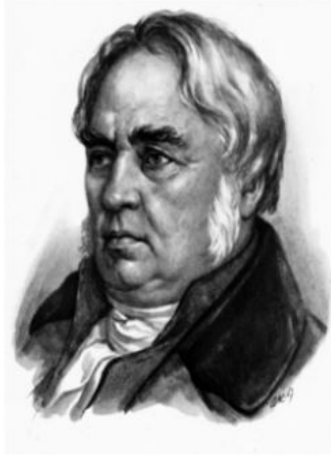
İVAN KRİLOV (1769 – 1844)

Öncelikle kara mizah yazarı olarak bilinen dünyaca ünlü Rus şairi İvan Andreeviç Krilov 2 Şubat 1769'da Moskova'da yoksul bir subay ailesinde dünyaya geldi. Uşaklık ettiği zengin ailelerin çocuklarından gördüğü merhamet sayesinde okuduysa da, sistemli bir öğrenim göremedi. Kendi çabalarıyla Fransızca, Almanca ve İtalyancayı öğrenmeyi başardı. Bunun dışında matematik ve Rus edebiyatıyla yakından ilgilendi, resim çizdi ve keman çaldı. Babasının ölümünden sonra (1778) önce Kalyazin Bölge Mahkemesinde memur olarak çalıştı, daha sonra Tver kentinde yargıçlık yaptı.