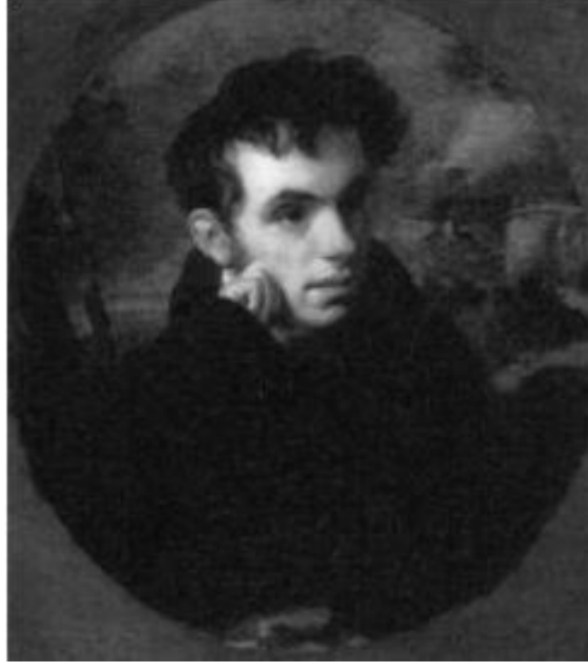
VASİLİ JUKOVSKI (1783 – 1852)