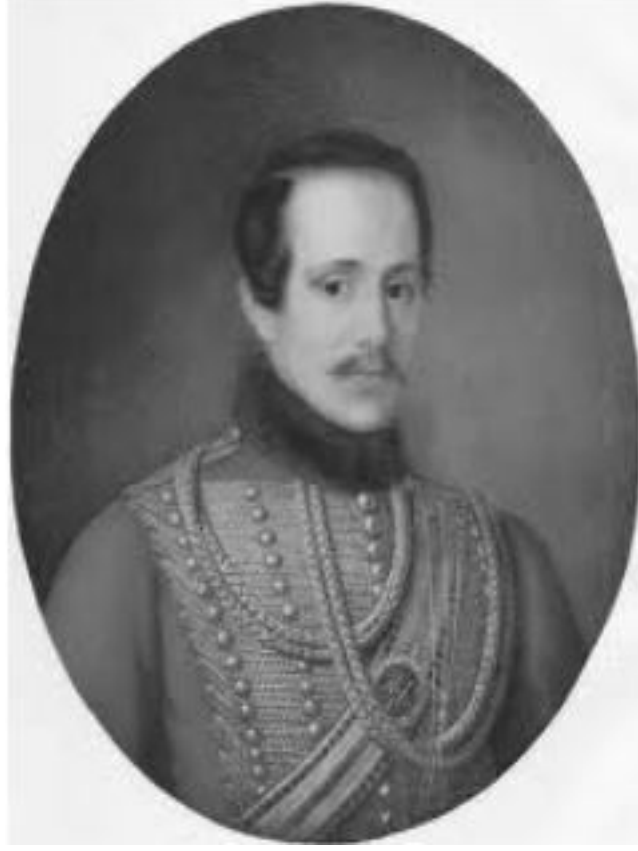
MIHAİL LERMONTOV (1814 – 1841)

Büyük şair, yazar ve dramaturg Mihail Yuriyeviç Lermontov, 3 Ekim 1814 tarihinde Moskova'da doğdu. Daha altı aylıkken annesinin tarafından babaannesi E. A. Arsenyeva'nın Tarhan (Kırım)'daki malikânesine götürüldü. Üç yaşında annesini kaybetti. Babasıyla babaannesi arasındaki kavgalara sık sık tanıklık etti ve sonuçta E. A. Arsenyeva'ya bırakıldı.