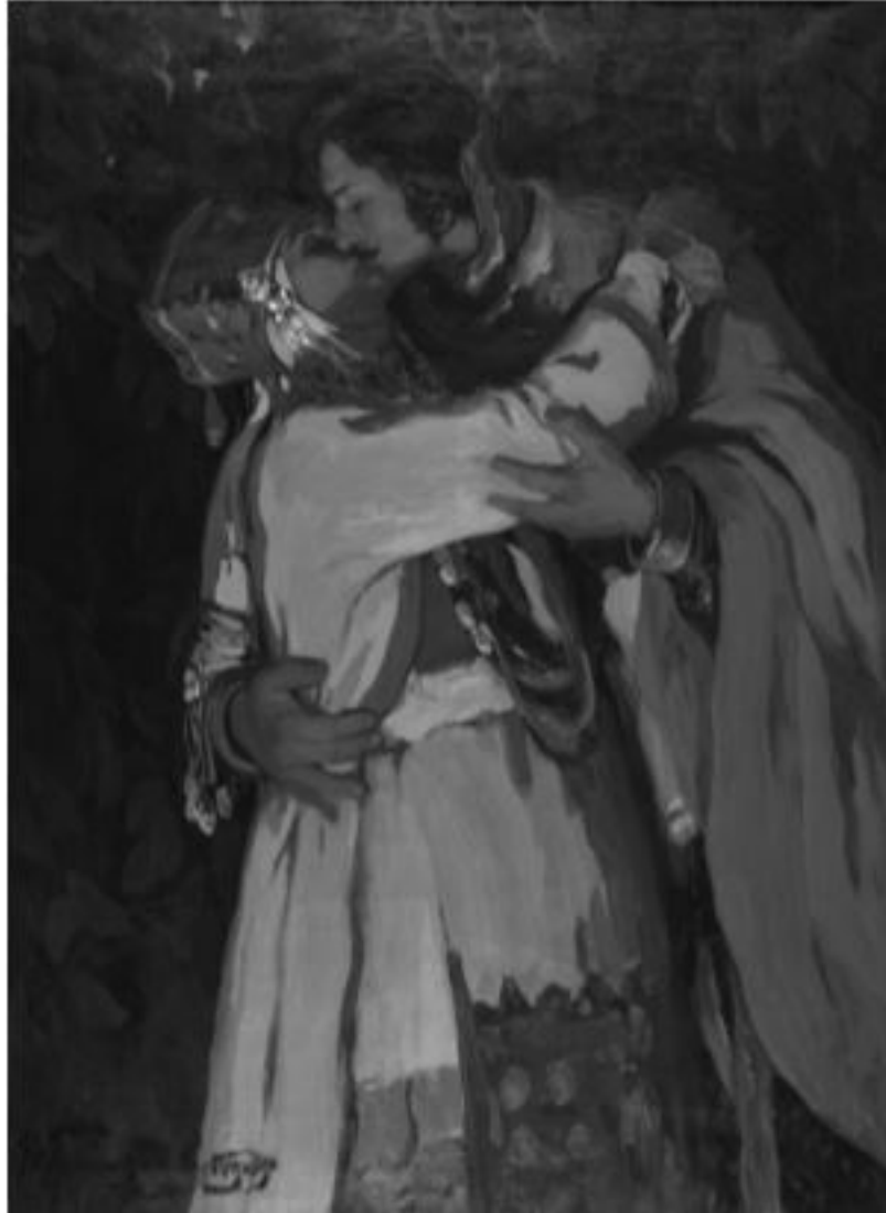
И. С. Горюшкин , Поцелуй , 1910 İ. S. Goryuşkin, Öpüş , 1910.