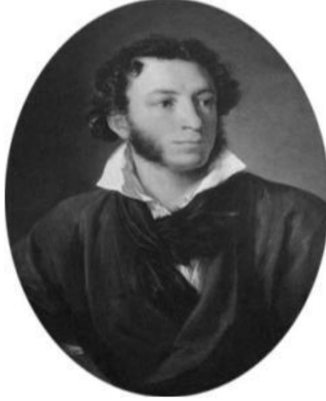
ALEKSANDR PUŞKİN (1799 – 1837)

Rus edebi dilinin yaratıcısı, dâhi şair, yazar ve dramaturg Aleksandr Sergeyeviç Puşkin, 26 Mayıs 1799'da Moskova'da soylu bir ailede dünyaya geldi. 1811-1817 yılları arasında Tsarsko Selo Lise'sinde okudu. Daha o zaman yazdığı 120 civarında şiirle güçlü yeteneğini topluma kabul ettirdi.