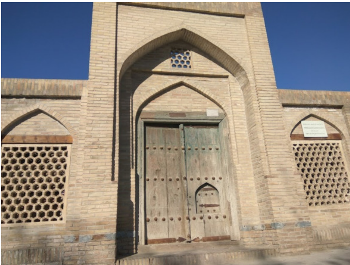
Один из многочисленных караван-сараяев Бухары. Фото 2017 г.

Собственно, эту тему мы давно собирались осветить. Сейчас же, благодаря нашему другу-бухарцу Зоиршо Клычеву , попробуем это сделать.