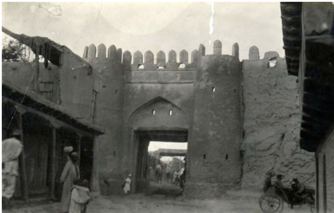
Каракульские ворота. Фото 1923—27 гг. Муса Саиджанов

Каракульские ворота (узб. Qorako'l darvozasi) – крепостные ворота в Бухаре, воздвигнутые во второй половине XVI века (в промежутке 1558—1575 годов), при правителе Абдуллахане II, в тогдашней столице Бухарского ханства.