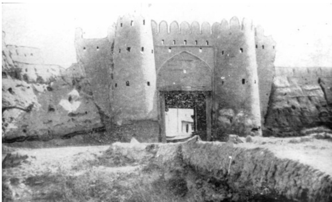
Ворота Ўғлон. Фото предположительно 1910—30 гг. XX в.

Ворота Ўғлон (узб. O'g'lon darvozasi) – утраченные крепостные ворота в Бухаре, возведённые во второй половине XVI века при правителе Абдулла-хане II, в тогдашней столице Бухарского ханства. Были установлены на северо-западной части бухарской крепостной стены.