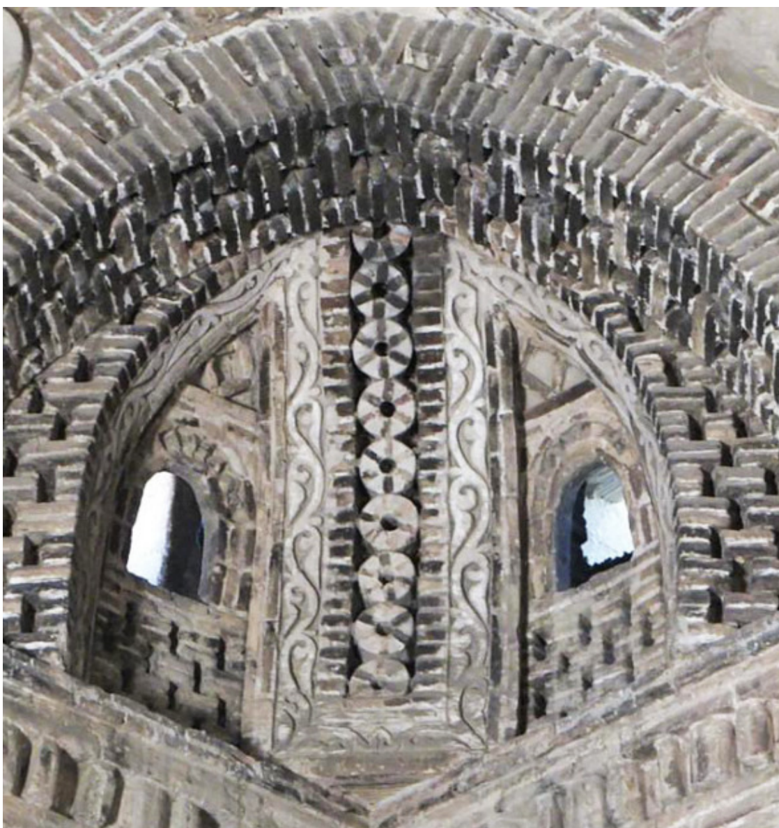
Кирпичная кладка внутри мавзолея

Ну, а если говорить серьёзно, то памятник этот и в самом деле заслуживает того, чтобы встать в один ряд с шедеврами мировой архитектуры. Вынуждены признаться, что сооружений подобных этому памятнику не так легко отыскать на нашей планете. Изумляет и поражает в нём, прежде всего, именно простота. Но эта видимая простота, бросающаяся в глаза только в первый момент. Подойдя же поближе и тщательно разглядывая и изучая характер кладки и орнамент, начинаешь осознавать – какие же удивительные люди жили в то далёкое время, не знавшие электричества, компьютеров, различной спецтехники и прочих достижений научно-технического прогресса. И... невольно начинаешь завидовать им и жалеть, что не родился в то далёкое и замечательное время.