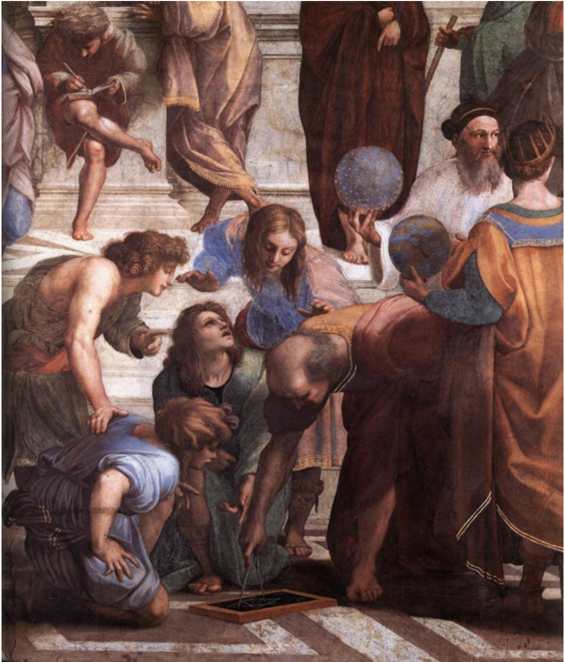
Заратустра, со звёздным глобусом в руке. Фрагмент картины «Афинская школа» худ. Рафаэль Санти