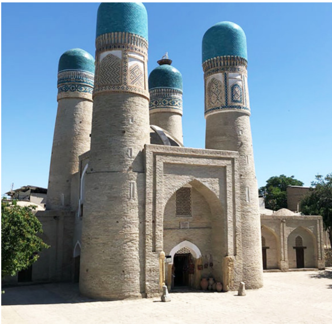
Медресе Халифа Ниязкула, более известное как «Чор-Минор»

«Не ищите напрасно той Бухары, о которой так живописно и красочно поведал нам некогда Л. Соловьёв в своей замечательной книге «Повесть о ходже Насреддине».