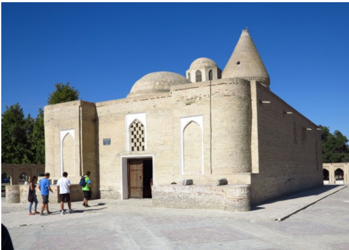
Мавзолей Чашма Аюб. Фото 2014 г.

По дороге к выходу из парка сохранился ещё один интересный памятник – мавзолей Чашма-Аюб (то есть «Источник Иова») – сложный, многократно перестраивавшийся в течение XIV – XIX вв. памятник, принявший в итоге форму продолговатой призмы, увенчанной разнообразными по форме куполами над помещениями разного размера и формы. Острый, запоминающийся силуэт ему придаёт поднятый на цилиндрическом барабане двойной куполок с конической скупфьёй, отмечающий собой главное помещение с источником.