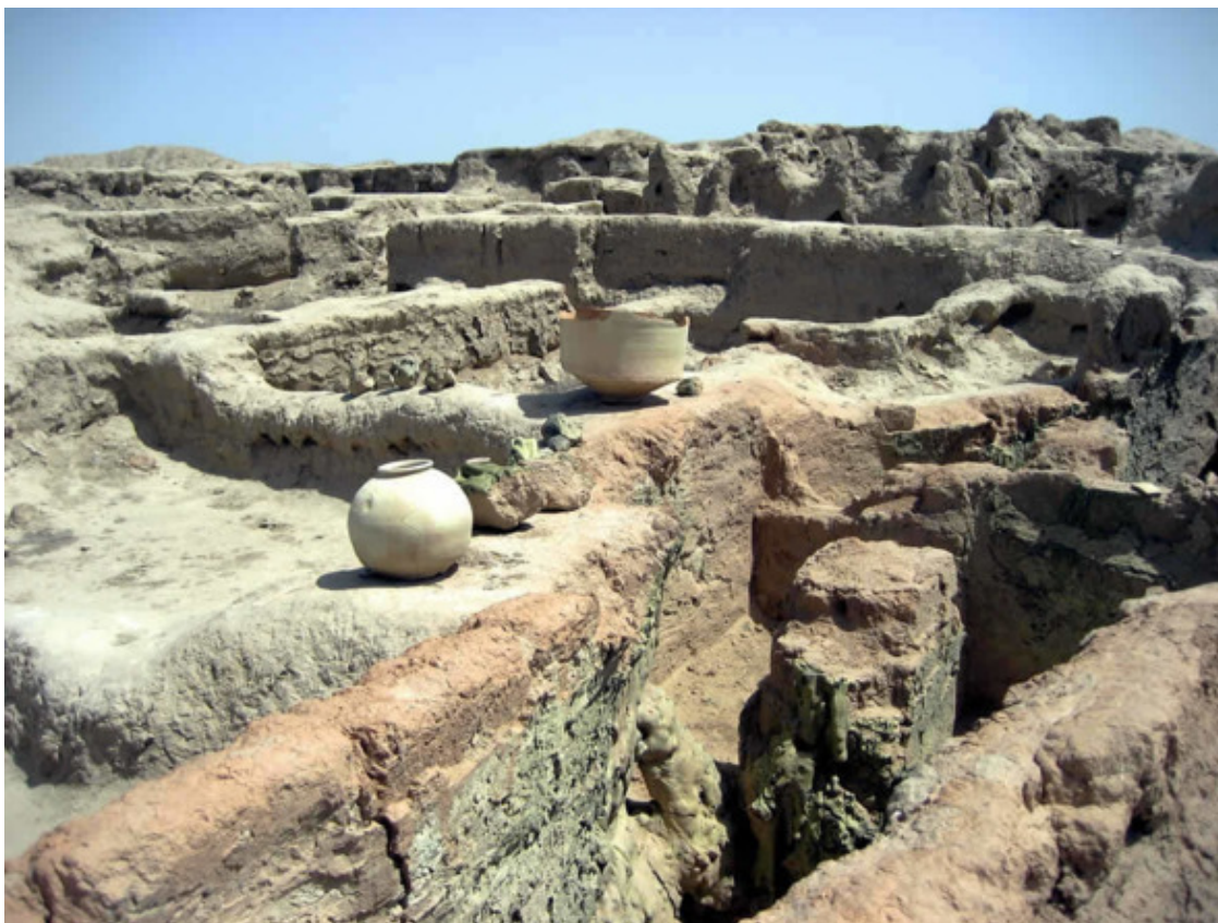
«Гонур-депе» (туркм. «Серый холм»)

Ещё до недавнего времени, об этой цивилизации было почти ничего неизвестно. Однако, в начале 70-х годов прошлого века, благодаря стараниям советских археологов, научное сообщество, а вслед за этим и всё человечество откроет для себя неведомую прежде уникальную цивилизацию, не уступающую по своей ценности ни Месопотамской, ни Харрапской центрам культуры. Чуть позже она станет известной всему миру, как Маргиана или страна Маргуш.