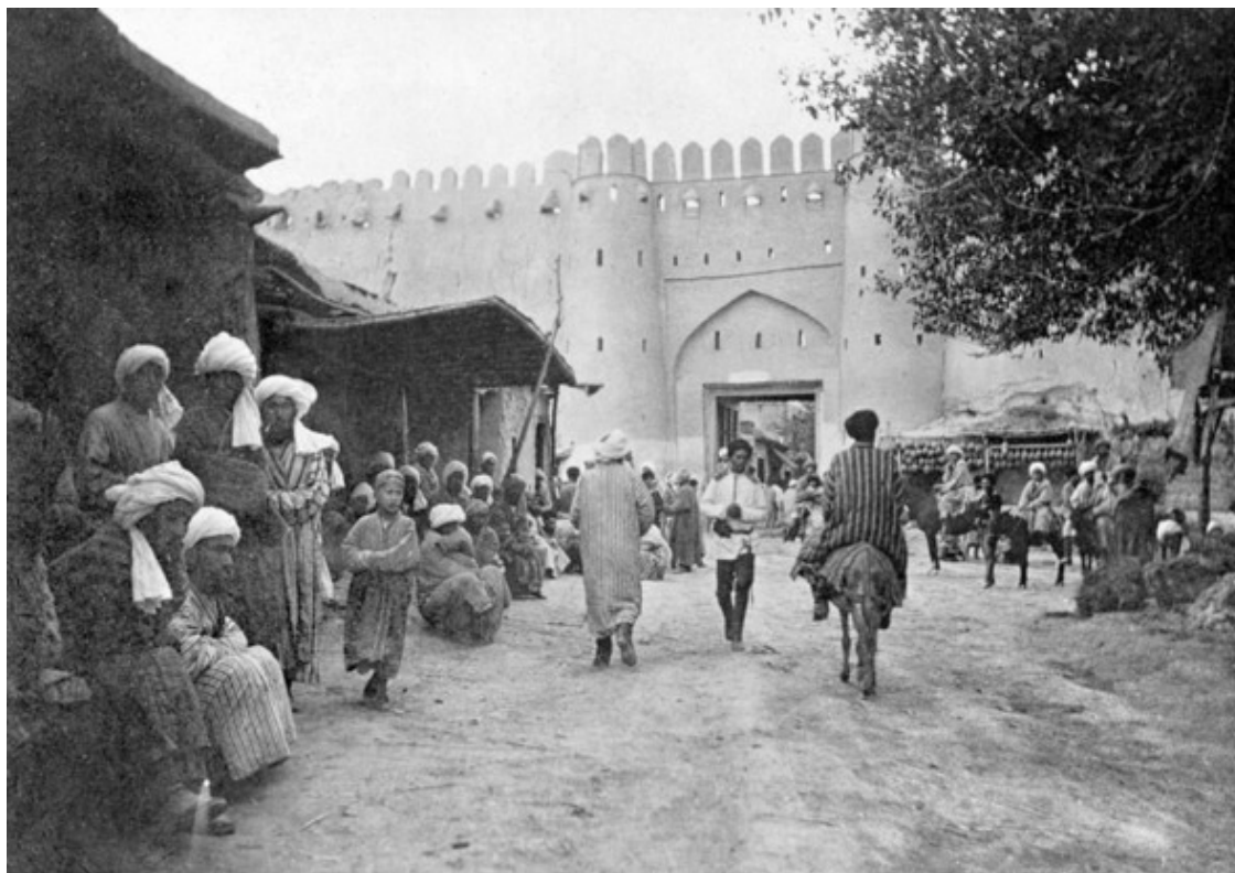
Самаркандские ворота. Фото 1890 г. Поль Надар

Самаркандские ворота (узб. Samarqand darvozasi) – крепостные ворота, воссозданные на прежнем месте в Бухаре. Впервые были воздвигнуты во второй половине XVI века, при правителе Абдулла-хане II, в тогдашней столице Бухарского ханства. Были установлены на северо-восточной части бухарской крепостной стены.