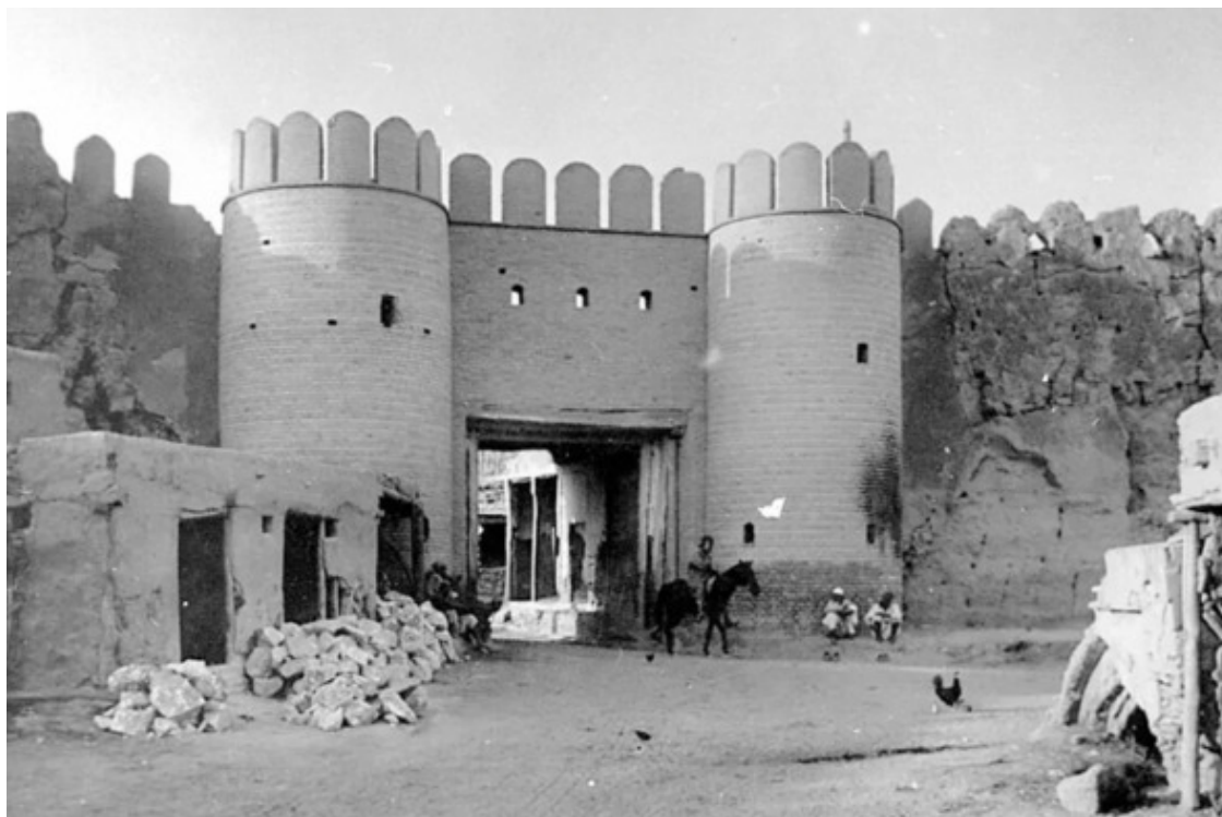
Ворота Мазари-Шариф. Фото 20-30-х гг. XX в.

Ворота Мазари-Шариф (узб. Mozori Sharif darvozasi) – утраченные крепостные ворота Бухары, возведённые (перестроены на место старых) в 1572 году при узбекском правителе Абдулла-хане II, в тогдашней столице Бухарского ханства. Были установлены на восточной части бухарской крепостной стены. Являлись одними из 11-ти когда либо существовавших ворот Бухары.