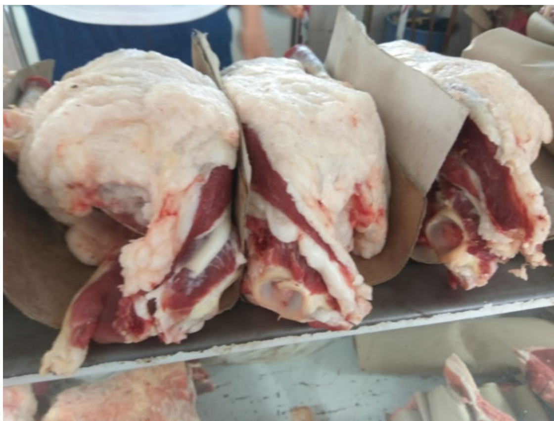
Баранина на одном из рынков Бухары

Затем даллол подходил к продавцу, пытаясь выяснить – доволен ли тот совершенной сделкой. И если выходило, что обе стороны довольны, роль посредника на этом заканчивалась и он переключался на очередную пару «продавец-покупатель». Это зрелище нужно было видеть своими глазами. Мне повезло – я видел настоящий спектакль. А ведь как, должно быть, шла торговля другими животными в прошлом? Мне кажется, что я отдал бы многое, чтобы увидеть как торговали лошадьми и верблюдами наши предки. Сейчас, по-моему, всё это уже «умерло».