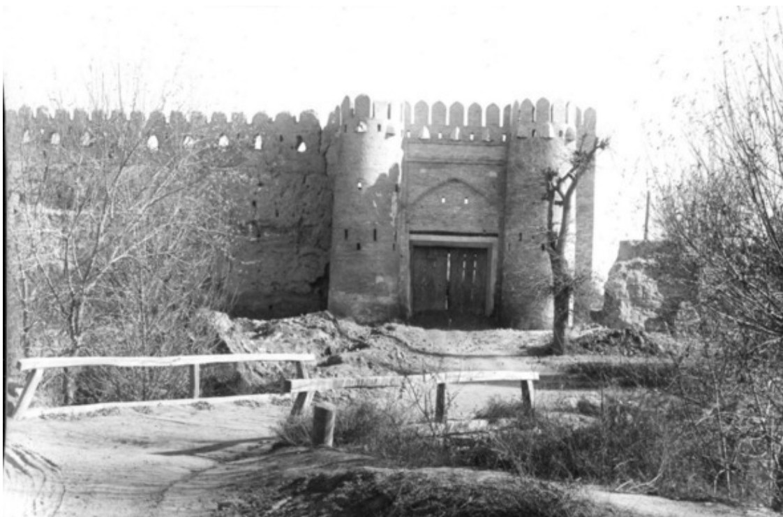
Ворота Талипоч. 1938 г