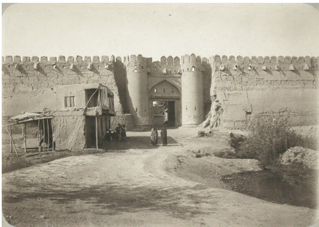
Ворота Шайх Чалол. Фото из коллекции МАЭ РАН, 1898—1902 гг.

Ворота Шайх Чалол (узб. Shayx Jalol darvozasi ) – крепостные ворота, воссозданные на прежнем месте в Бухаре. Впервые были воздвигнуты, наряду с не уцелевшими хаузом, минаретом и мечетью, в честь учителя (пир) донатора строительства; в первой половине XVI века, на средства и по приказу правителя Абдулазиз-хана из династии Шейбанидов. Абдулазиз-хан был одним из учеников (муридом) шейха Джалола.