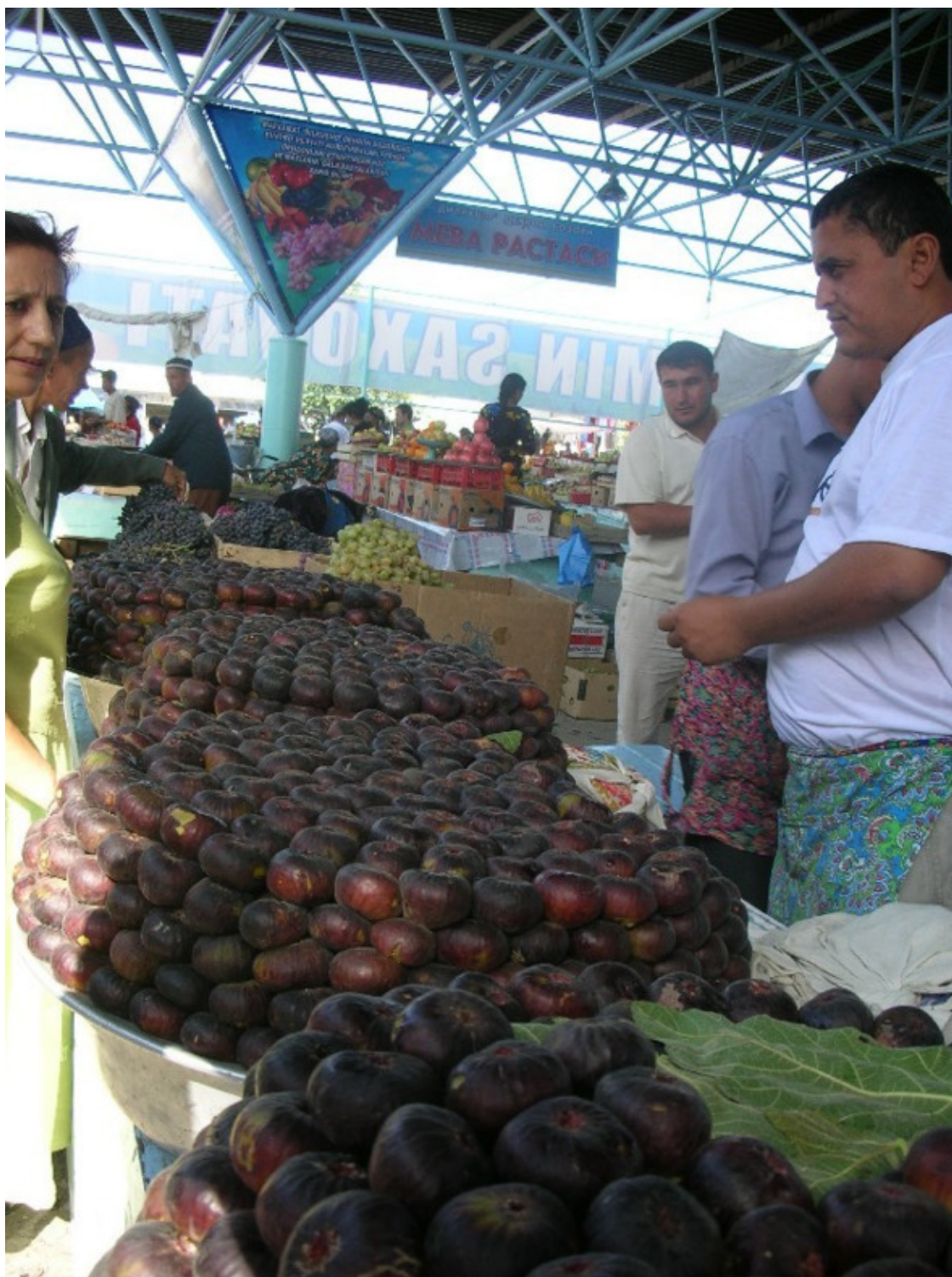
Инжирный ряд на бухарском рынке

К сожалению, сегодняшний облик рынков не имеет ничего общего с тем, что представляли собою ранние восточные базары. Уже почти невозможно встретить на них простого дехкана, торгующего продуктами со своего огорода. Все на корню скуплено бессовестным перекупщиком, который устанавливает непомерно высокие цены и ведёт себя вызывающе нагло и дерзко.