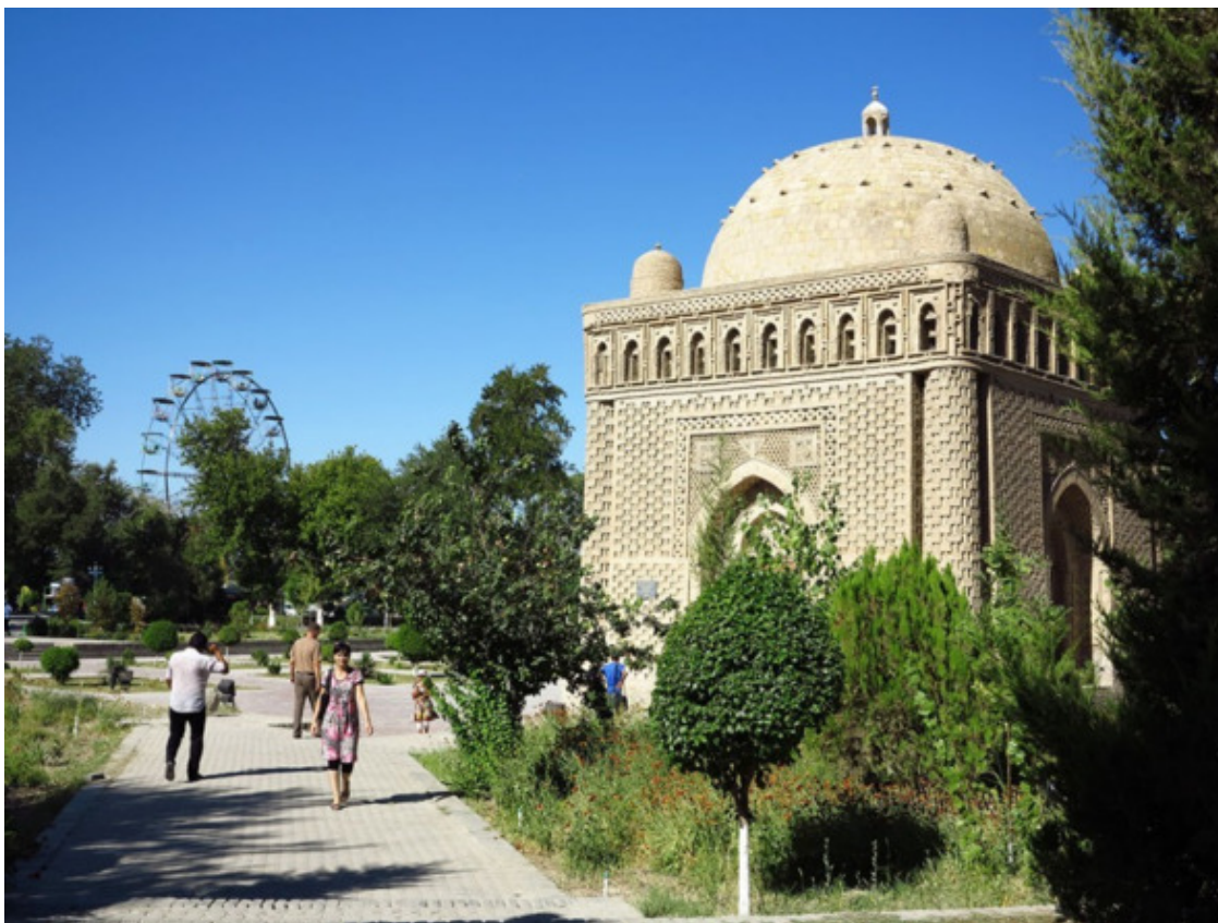
Мавзолей Саманидов, X в.