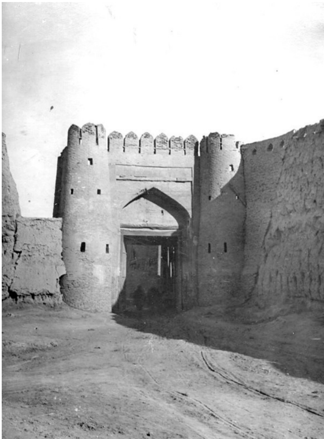
Ворота Намозгох. Фото 20-30-х гг. XX в.

Ныне утраченные ворота Намозгох (узб. Namozgoh darvozasi ) были построены во времена династии Караханидов в 1119 году мастером Усто Бако. Со временем отреставрированы в 1540-1550 годах Абдулазизханом. Ворота были отделаны красивой майоликой, облицовочными плитами и терракотом, аркой и сводом в стиле «китеба», цветники состояли из шести