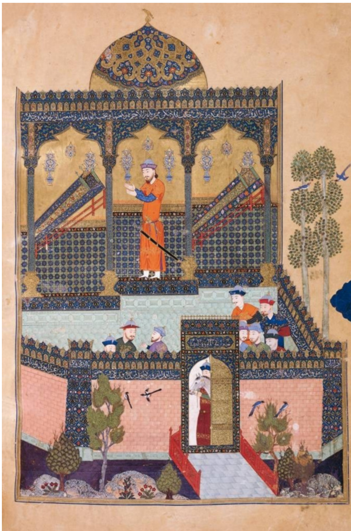
«Байсангурово Шах-наме» от 1430 года написано для внука Тимура (1336—1405) мирзы Байсанкура (1399—1433)