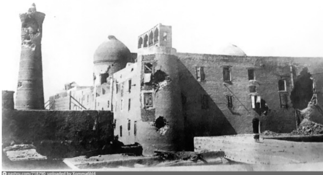
Бухара, после взятия её войсками М.В.Фрунзе.

Мы сознательно вынуждены пропустить огромный пласт истории, включающий в себя отдельные значимые периоды (начиная от завоеваний Александра Македонского и его свадьбы на дочери местного вельможи Равшанак /Роксаны/, до принудительного насаждения Ислама /8 век н.э./ и нашествия кровавых орд Чингис-хана /13 век/, а также, последующих вслед за этим нескольких правящих династий) с тем, чтобы подойти поближе к современной картине, сложившейся в ходе новейшей истории за последние 100 лет.