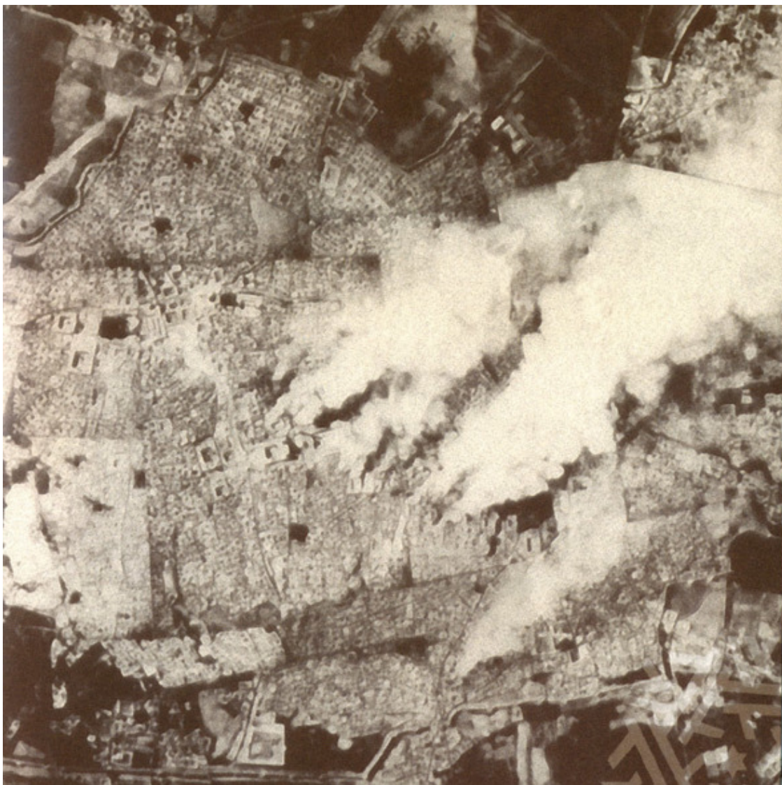
Фото бомбёжки Бухары с аэроплана. Сентябрь 1920 г.