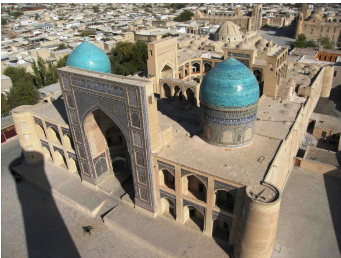
Медресе «Мири Араб»