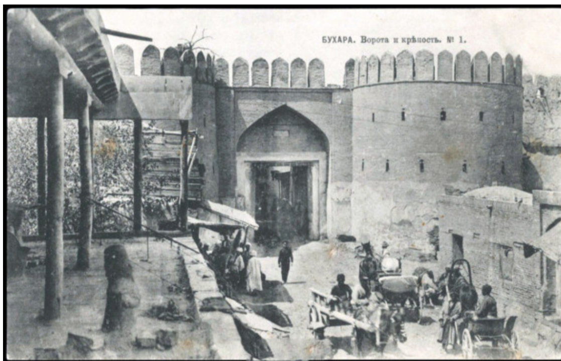
Каршинские ворота (Қавола)

Каршинские ворота (узб. Qarshi darvozasi ) – утраченные крепостные ворота Бухары, воздвигнутые в XVI веке, в эпоху правления представителей из династии Шейбанидов, в тогдашней столице Бухарского ханства. Были установлены на восточной части бухарской крепостной стены.