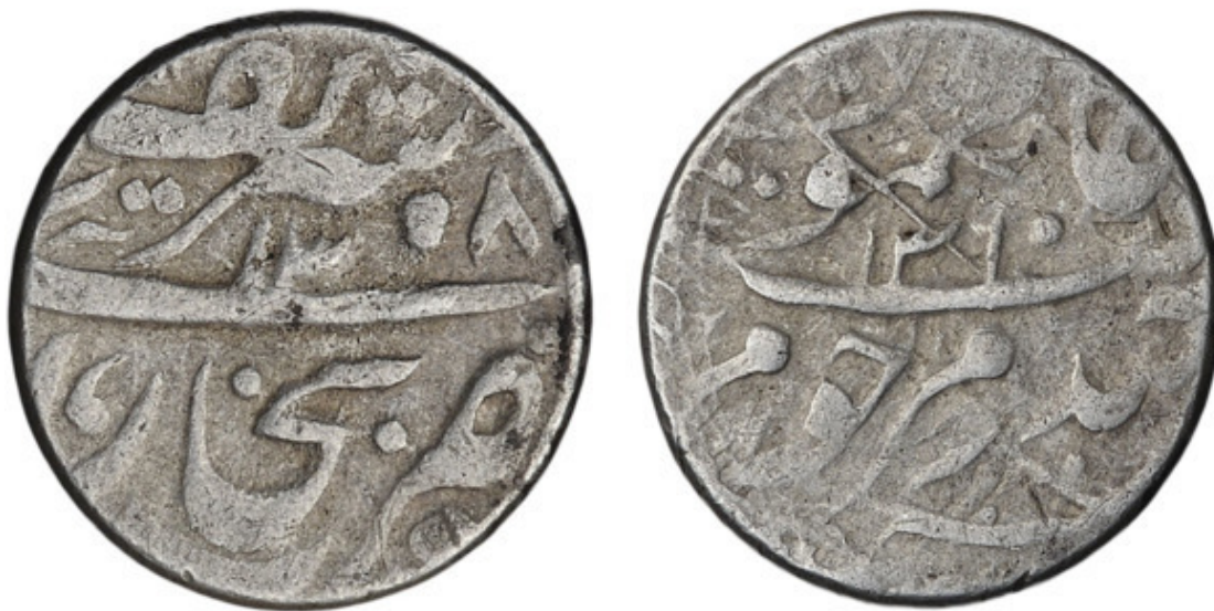
Бухарская танга времён эмира Ахад-хана. 1892—93 гг.

В 1890 году издаётся указ Александра III «О постепенном изъятии из обращения туземной серебряной монеты, обращающейся в Туркестанском крае». Для обмена устанавливались сроки: до 1 мая 1892 года монета принималась по курсу 20 копеек за одну тангу; до 1 мая 1893 года – по 15 копеек; до 1 мая 1894 года – по 12 копеек; до 1 мая 1895 года – по 10 копеек. 1 сентября 1893 года Министерства финансов издало распоряжение о запрещении вывоза бухарской танги в Туркестан. После запрещения вывоза курс танги стал в большей мере зависеть от русских бумажных денег. Скопившееся в бухарской казне и у частных лиц серебро резко упало в цене. В результате разразился денежный кризис, который и дал повод русскому правительству настаивать уже на полном прекращении чеканки танги, чтобы урегулировать её курс.