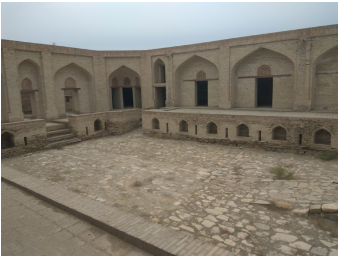
Внутренний двор караван-сарая. Фото 2017 г.

– Это не ниши, а стойла, которые называются «охур». – смеётся Зоиршо. – В данном случае, это охуры для ослов, судя по их высоте. Чуть далее, я тебе покажу и охуры для лошадей. Кстати, вот и ещё одна функция караван-сарая: «гараж» для гужевого транспорта! Скажу более: тут даже предусматривалось специальное помещение для хранения сена, овса и прочего корма. Кроме того, был предусмотрен навес от дождя («ним-айвон»). Обрати своё внимание вот ещё на что: видишь – тут мы спускаемся вниз по пандусу, а там поднимаемся по ступенькам наверх, к кельям, где проживали сами торговцы. А почему? Потому что должна существовать так называемая «санитарная граница», отделяющая грязь, нечистоты и испражнения животных от места проживания людей.