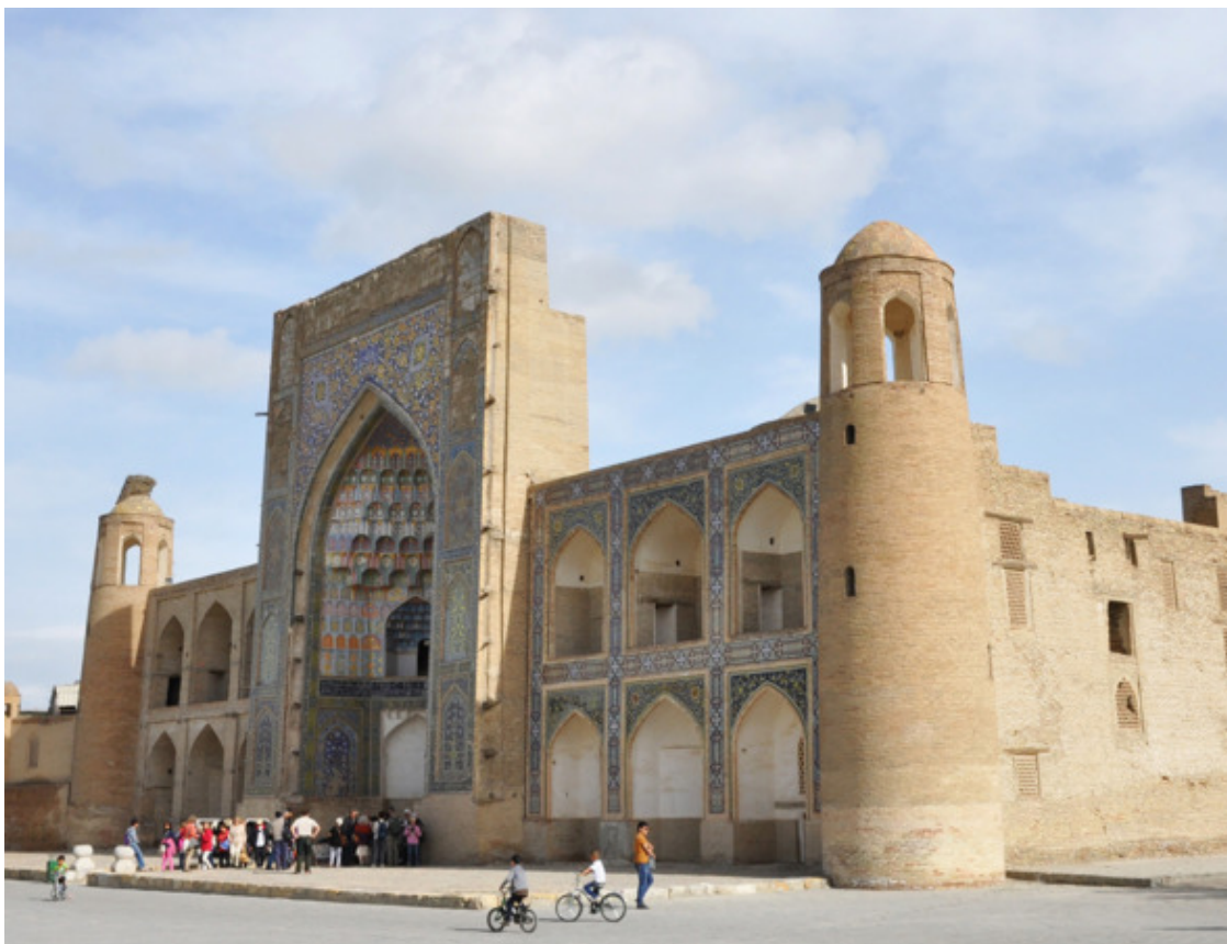
Медресе Абдулазиз-хана, (XVII в.)

Этот памятник средневековой архитектуры занимает особое место не только по своему значению и богатству художественной отделки, но ещё и потому, что дорог одному из авторов данной книги, которому довелось здесь проработать почти 5 лет в качестве бармена восточного бара, в те далёкие теперь уже времена, когда ещё здравствовал Советский Союз. Но вначале, небольшая историческая справка.