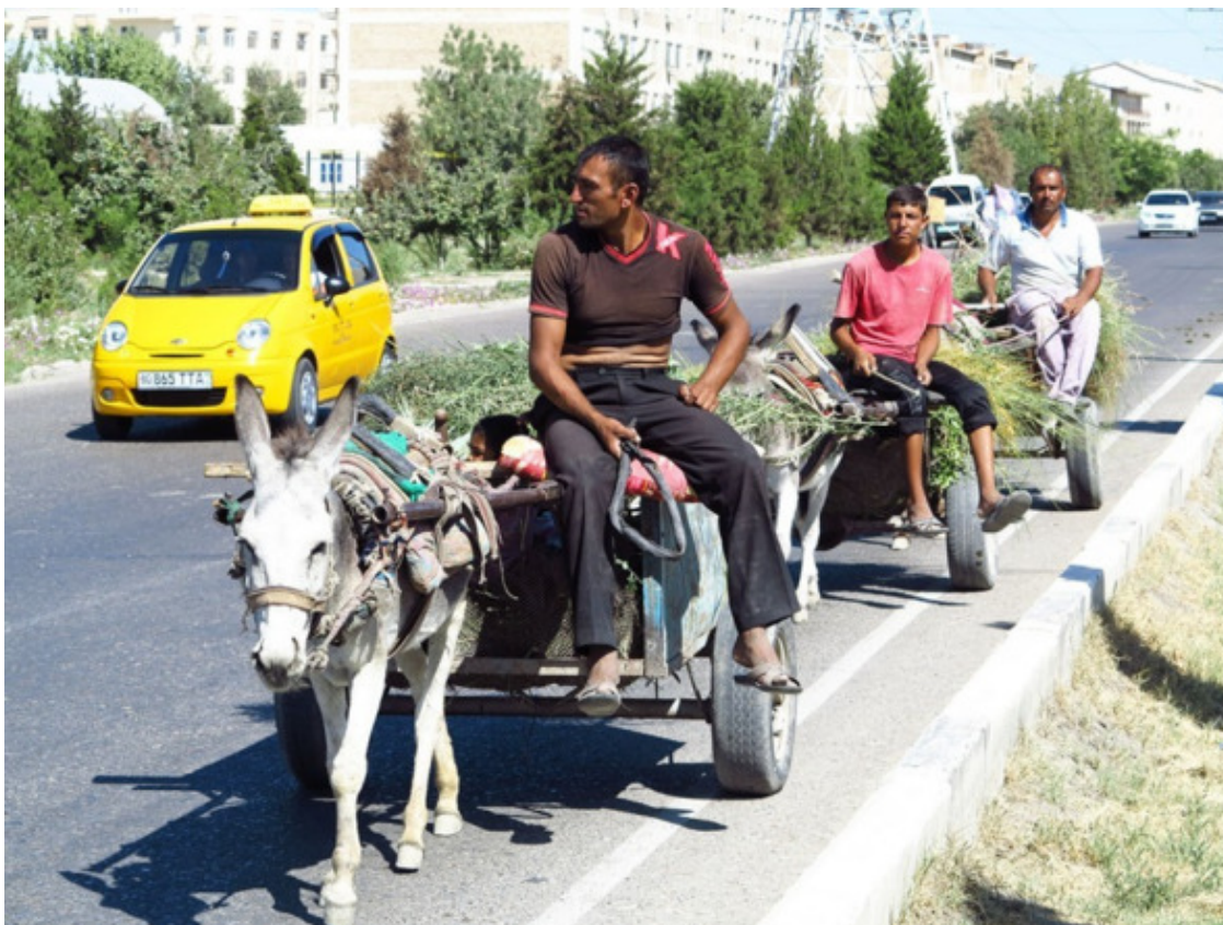
Бухара: старое и новое...