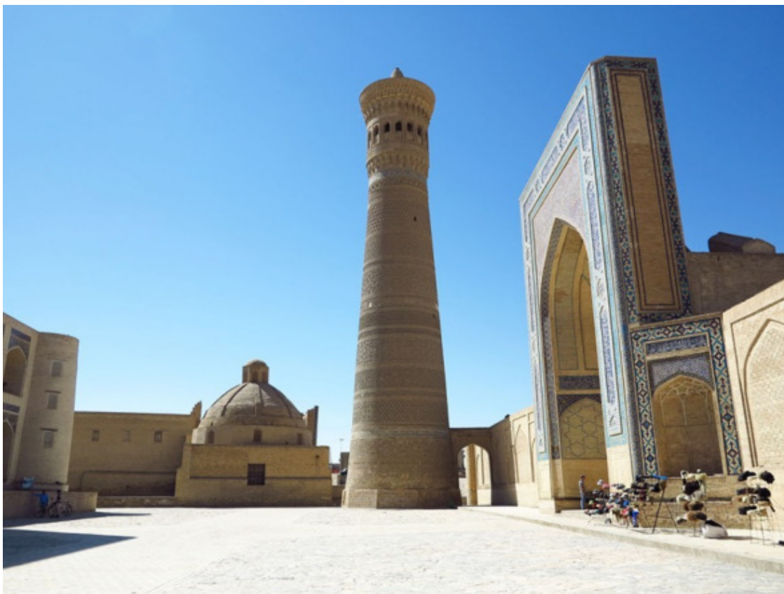
Ансамбль «Пои-Калон». Фото 2014 г.

У каждого туриста, приезжающего в Бухару и посетившего многочисленные ансамбли города, складываются свои – особые – впечатления от увиденного. У кого-то, сразу всплывает образ ходжи Насреддина, которого, возможно, и сейчас можно встретить на пёстром восточном базаре. У кого-то – бухарский гарем, заполненный пышногрудыми гуриями. А кое у кого, впервые увидевшего минарет Калян /Калон/ («большой»), вспыхивают в возбуждённом мозгу картины деспотической казни в поздне-феодальной Бухаре. Особенно после того, как некоторые усердные гиды расскажут вам о том, как сбрасывали с этого минарета преступников и неверных жён. Образ «смерть-башни» сохранился ещё с советских времён, когда в угоду существовавшей идеологии было выгодно представлять дореволюционную Бухару, как средоточие мракобесов и тупых эмиров. Вполне возможно, что когда-то, кого-то и спихнули оттуда разок-другой, хотя наши бабушки и дедушки подобных историй так и не смогли вспомнить.