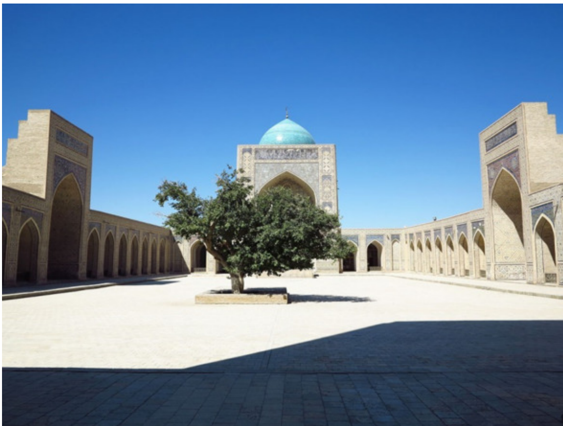
Внутренний двор мечети Калян («Масчид-и калон»). Фото 2014 г.

Последнее здание соборной Мечети Калян («Масчид-и калон») завершено в 1514 г. Оно равно по масштабу зданию мечети Биби-Ханым в Самарканде. Под её сводами собиралось до 12 тысяч человек. При едином типе здания – это совершенно различные произведения зодческого искусства. Прямоугольный двор обрамлён галереями, состоящими из 288 куполов. Основанием им служат 208 колонн. Продольная ось двора завершается «максурой» – портално-купольным объёмом здания с крестообразным залом, над которым возносится голубой массивный купол на мозаичном барабане. Здание хранит много любопытных архитектурных находок. Например, круглое отверстие в одном из куполов. Внизу, через него можно видеть основание минарета Калян. А отступая шаг за шагом, можно сосчитать все пояса узорной кладки минарета и упереться взором в его ротонду.