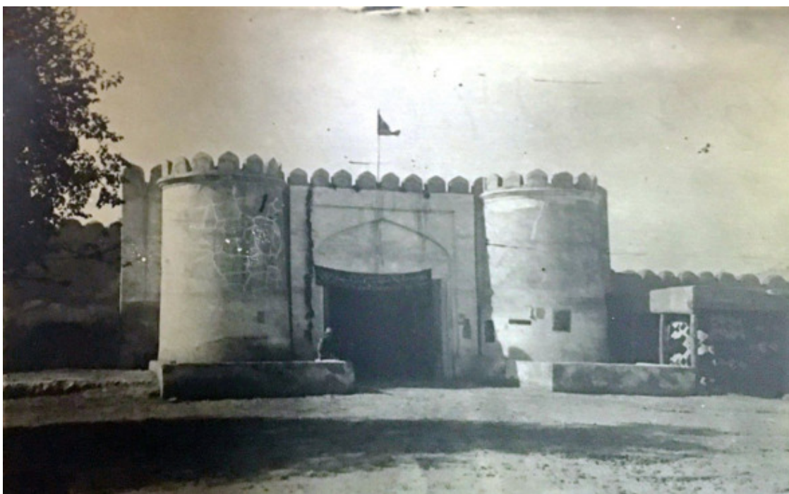
Ворота Ҳазрати Имом Фото 1921 г. РГАКФД

Ворота Ҳазрати Имом (Хазрат-Имам; Имамские ворота) (узб. Hazrati Imom darvozasi ) – крепостные ворота, воссозданные на прежнем месте в Бухаре. Впервые были воздвигнуты в XVI веке, в эпоху правления представителей династии Шейбанидов, в тогдашней столице Бухарского ханства.