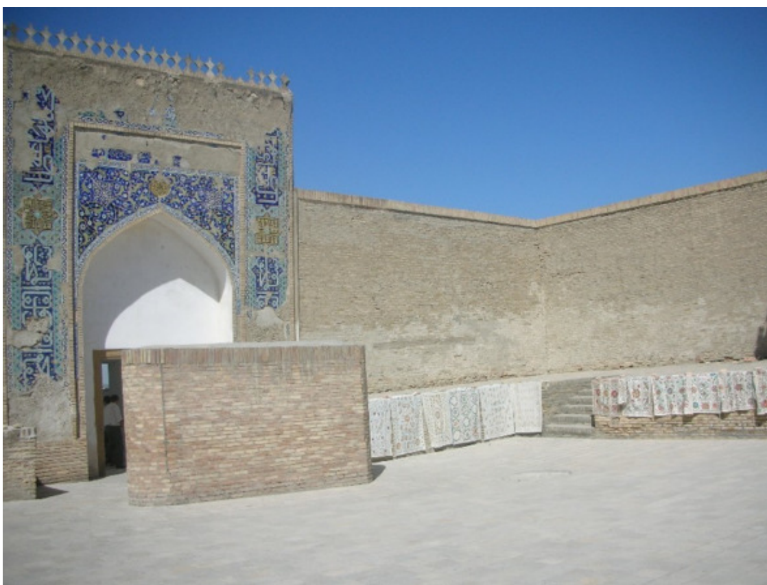
Стена «гуломгард» в коронационном зале Арка.

До последнего эмира Алим-хана, трона, в его современном представлении (стулообразного), не существовало: было просто мраморное плоское возвышение в турецком стиле. И только побывав в Ялте – резиденции русского царя – и возвратившись оттуда, эмир повелел сделать трон в классическом стиле.