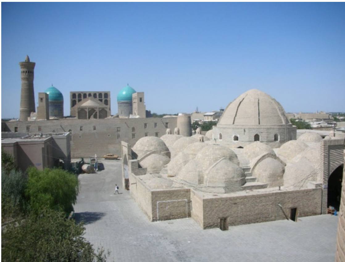
Бухара. Фото Г. Саидова, 2006 г.

«Волга впадает в Каспийское море» – существует известное выражение, подразумевающее неопровержимый факт или аксиому. Следуя в русле подобной метафоры, можно было бы несколько перефразировать и сказать: «Амударья впадает в Аральское озеро», но... Арала уже нет. Он, можно сказать, умер – осталась лишь небольшая «лужица» на карте мира. Как и не существует уже – увы – той Бухары, которая была некогда воспета знаменитым основоположником таджикско-персидской литературы Абу Абдуллох Рӯдаки (858—941 гг X в. н. э.)