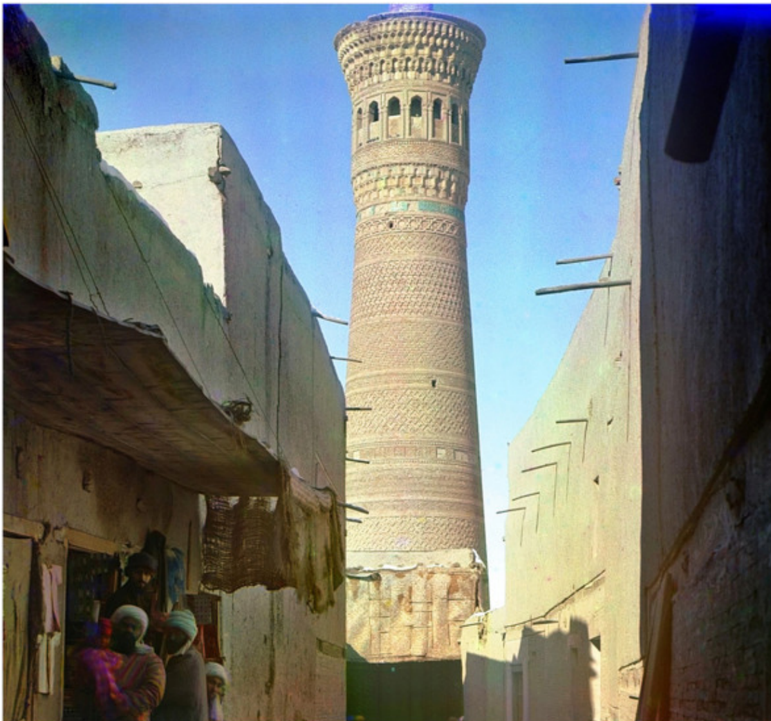
С. М. Прокудин-Горский. Большой Минар в Старой Бухаре.

Создано в интеллектуальной издательской системе Ridero