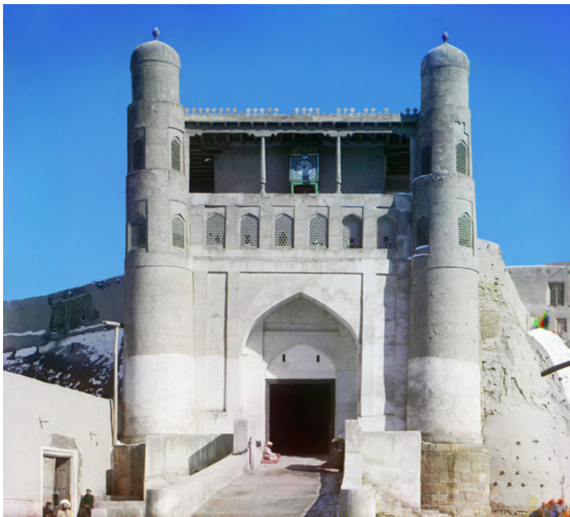
Бухарский Арк. нач. XX в.

Пожалуй, только два города в Средней Азии сохранились как города-музеи, предоставляя изумлённому взору туриста почти в нетронутом виде, не только отдельные памятники архитектуры, но и целые комплексы, ансамбли и кварталы с их каркасными глинобитными домами, узкими улочками, на которых по-прежнему с трудом едва могут разъехаться два осла, запряжённых арбой, словом, со всей инфраструктурой. Не случайно они являются городами-заповедниками. Это Хива и Бухара. Ну, а если считать по количеству памятников старины, то Бухара, вне всякого сомнения, стоит на первом месте.