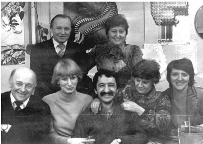
Коллектив отдела художников.

Перебравшись окончательно из Благородной Бухары в «Колыбель революции», я сразу же попал к... эмиру бухарскому. Вернее, не к самому «угнетателю и притеснителю простого трудового народа» (ибо к тому времени он уже почил в бозе, в приютившем его Афганистане), а в его дом, что был расположен по адресу: Кировский (теперь уже – опять – Каменноостровский) проспект, дом 44б. Больше из-