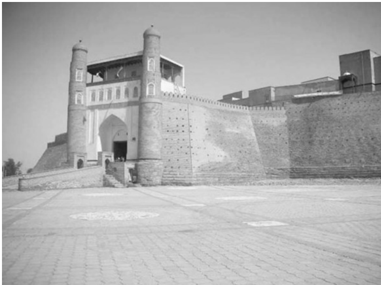
Цитадель Арк. Бухара.

В один из очередных приездов в Бухару, я решил порадовать своих близких настоящей российской выпечкой. Так и заявил с утра, решительно и твёрдо: