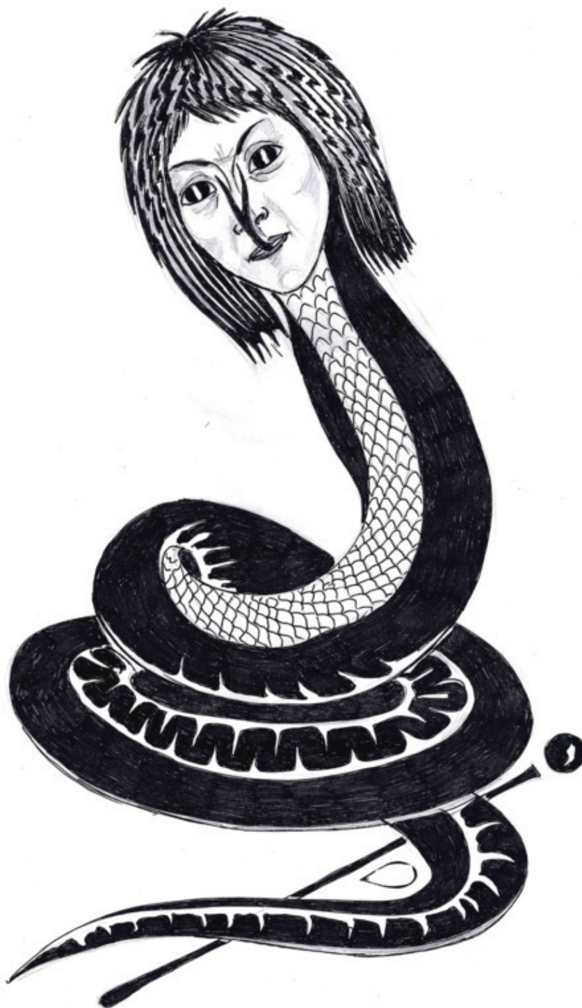
Авторская иллюстрация «Черная Мамба»