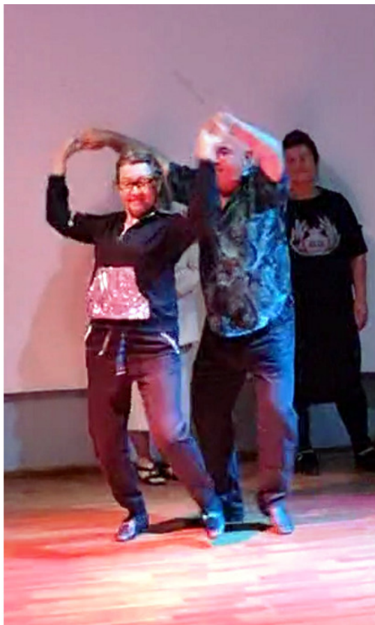
Сцена санатория. Мы танцуем сальсу.