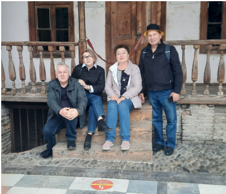
На ступенях дома Сталина. 2022 год Гори.

А вот ступени вагона никаких особых ассоциаций не вызвали. Вагон, конечно исторический, но это не дом, это временное пристанище при переезде. У меня даже мысль промелькнула, а если этот вагон зацепить за поездом и проехать в нем как пассажир. Можно прочувствовать то время? Может когда-то и сделают такой музей на колесах. Ведь есть же поезда – музеи о Великой Отечественной. Почему не быть