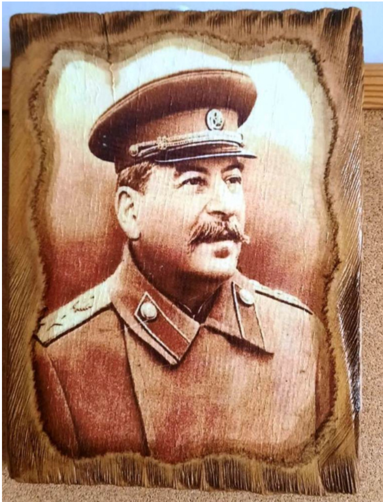
Сталин. Масло на дереве. Апрель 2021г. Гори.