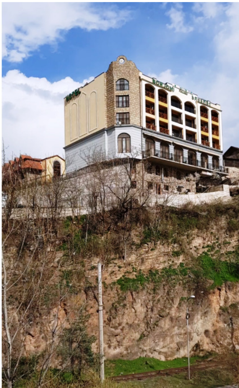
Вот он Боржоми Палас. Вид с моста.

Рыночек малюсенький. Пара хозяйственных магазинов и человек 10 пожилых продавцов с яблоками, помидорами, огурцами, зеленью, чачей и вином из-под полы. Но что-то не захотелось (удивительно, или уже от воздуха и впечатлений похорошело?). Шли вниз, вдоль Куры. По набережной похожей на парк. Симпатично. Воздух свежий. Людей мало. Правда тех, кто сидел в парке на лавочках как-то отдыхающими не назовешь. В основном мужчины, старше 30 и даже 50. Мы привыкли к виду лошенных грузин. Вспомните братьев Меладзе или Павлиашвили, Басилашвили или Кикабидзе. Я понимаю, что это все медийные штампы. Но здесь? Ни одного, не то, что метросексуала, а даже опрятного и подтянутого мужчины. Немного удивило. В однообразных серых куртках, черных вязаных шапочках, с запущенной щетиной. Время рабочее, а они похоже уже давно на работу не ходят. Трудно с работой в грузинской глубинке. В принципе, как и у нас. Как же много общего порой встречается в нашей казалось «независимой» постсоветской жизни.