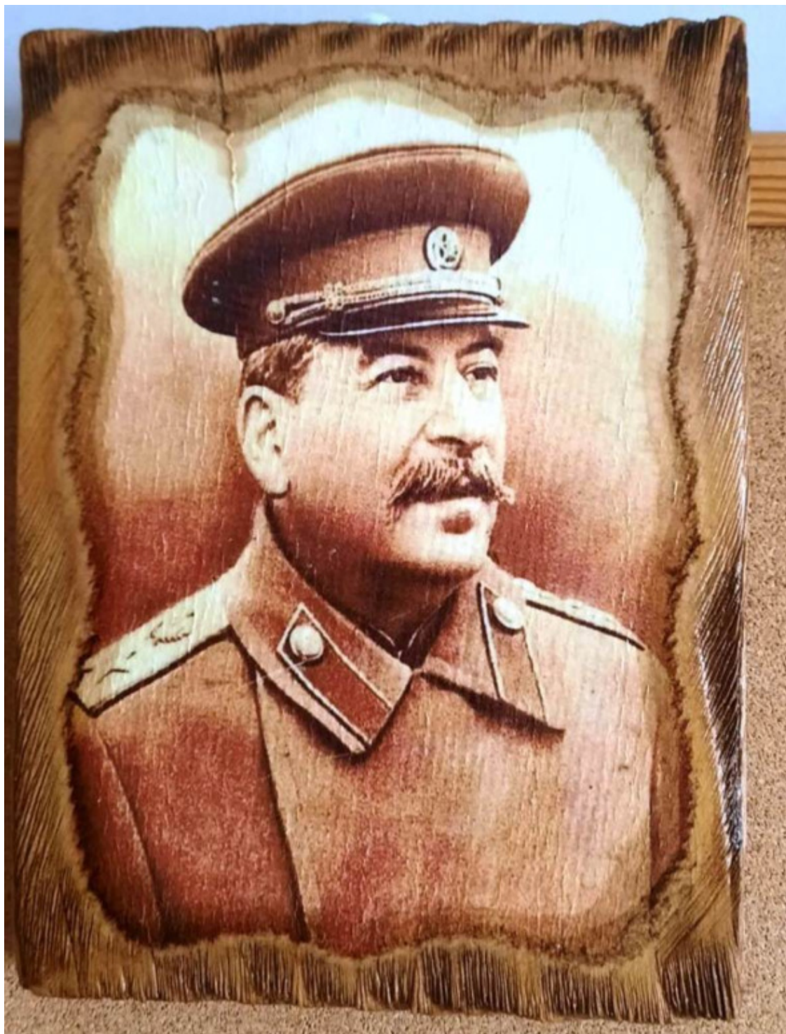
Сталин. Масло на дереве. Апрель 2021г. Гори.

Мое мнение. Сталин – Великий. Великий организатор и управленец. Человек, взявший на себя ответственность за огромную страну, прошедшую революцию, совершившую коллективизацию и индустриализацию, поднявшую народную культуру. Победившую фашизм. Вождь не создавший себе капиталы, но создававший страну.