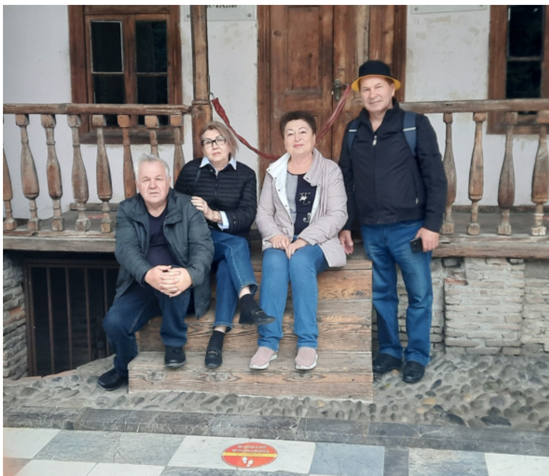
На ступенях дома Сталина. 2022 год Гори.

Дом сохранен в специальном крытом навесе. Ощущение такое, что огромной беседкой, в стиле сталинского ампира накрыли небольшой дом, вросший в землю с полуподвалом, маленькой верандой, деревянными старыми дверьми и ставнями. Это не старина, а именно старость. Дом состарился, пережив своего хозяина и продолжает жить своей жизнью. Как и на всех нас на него влияет время, появляются морщины – трещины, которые не прикроешь реставрационным макияжем, опадают буквы на вывеске, скрипят ступени лестницы на веранду, если на них встать. А если присесть на ступени, проваливаешься в прошлое этого дома, в котором жили люди еще в 19 веке, даже не думавшие, что их сын станет Великим Иосифом Сталиным. Дом давно расставшись с хозяевами и жильцами, хранит их тайны, проникнуть в которые можно только присев на ступени и почувствовать их тепло, как когда-то чувствовали его хозяева, сидя на крыльце и приветствуя соседей, проходивших по мощеной улочке. Вот она связь времен. Как во Франции, в Лувре. Дежавю.