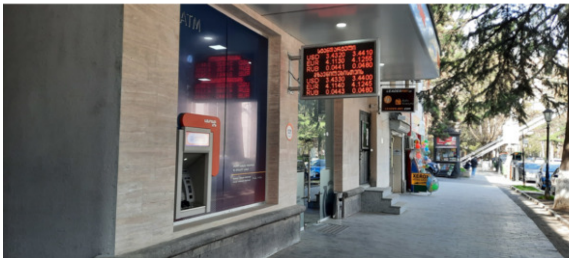
Шота Руставели – центральная улица Боржоми.

Через дорогу обменные пункты. Как ни странно, курс здесь лучше, чем в Тбилиси. Зашли в продуктовый. Цены в пределах наших. Жить можно.