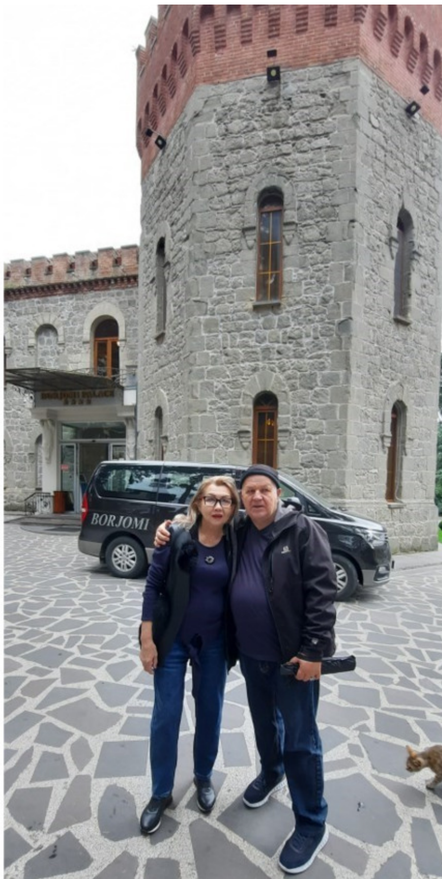
Да здравствует Грузия! Даешь Кавказ!