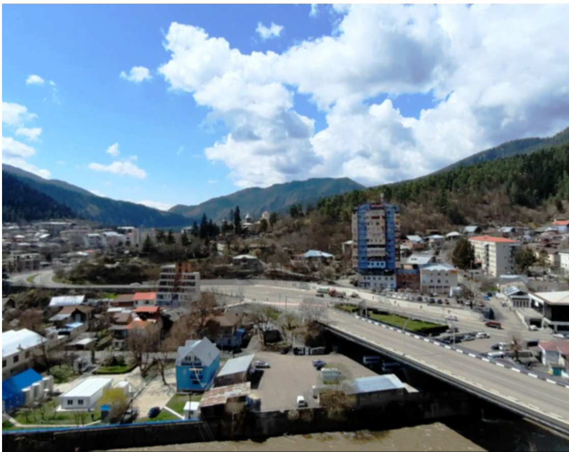
Вид на Боржоми с балкона. 2021 год.

Все оставшиеся дни, когда я был в номере любимым моим занятием было сидеть на балконе и впитывать вдохновляющую панораму гор, Куры и города.