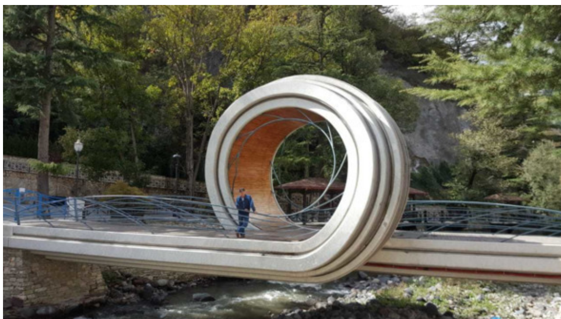
Мост – петля. При чем тут Мебиус не ясно.

И вот иду я рано утром 15 апреля по улице 9 апреля и выхожу к мосту в форме мертвой петли. Я даже сначала подумал, что по нему и ходить то нельзя, но подошел и понял, что это не просто малая форма, а именно мост для перехода через реку, но не такой как все, вот такой петлявый. Каждый раз потом проходя мимо «Петли» я думал, а можно ли по нему крутануться на велике или мотоцикле если быстро разогнаться?