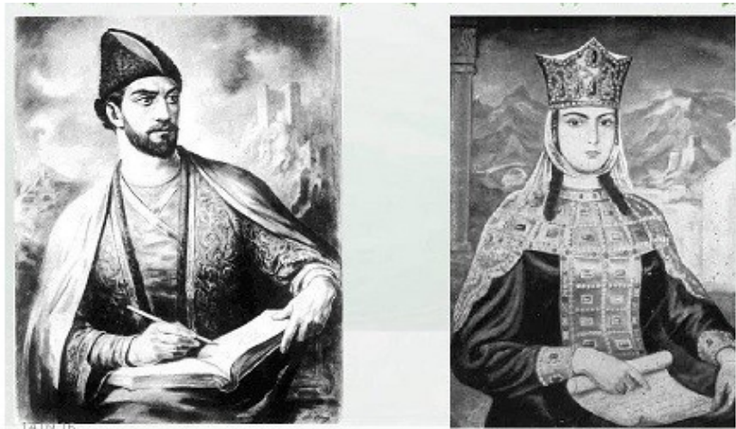
Шота Руставели и Царица Тамара.