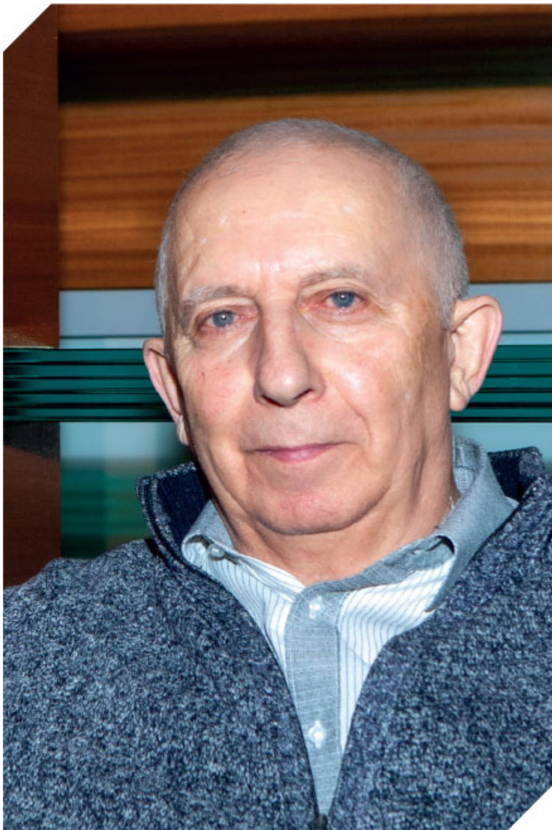
На обложке я в начале карьеры, здесь – через 25 лет