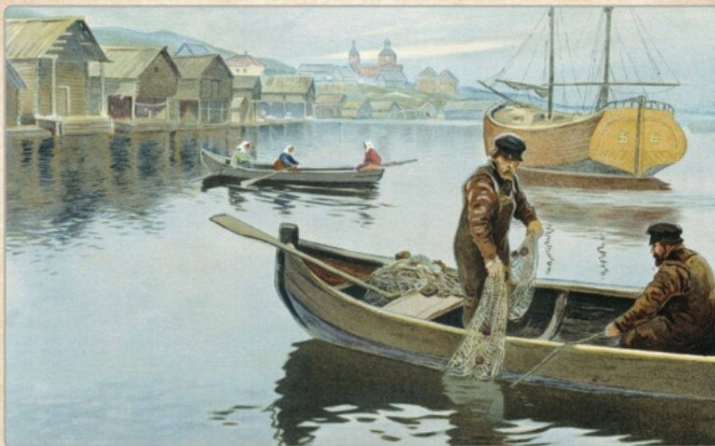
История. Автография из альбома «Россия в картинках», изданного в конце XIX века Торевским домом «В.В. Дунин и Г.»». XIX век