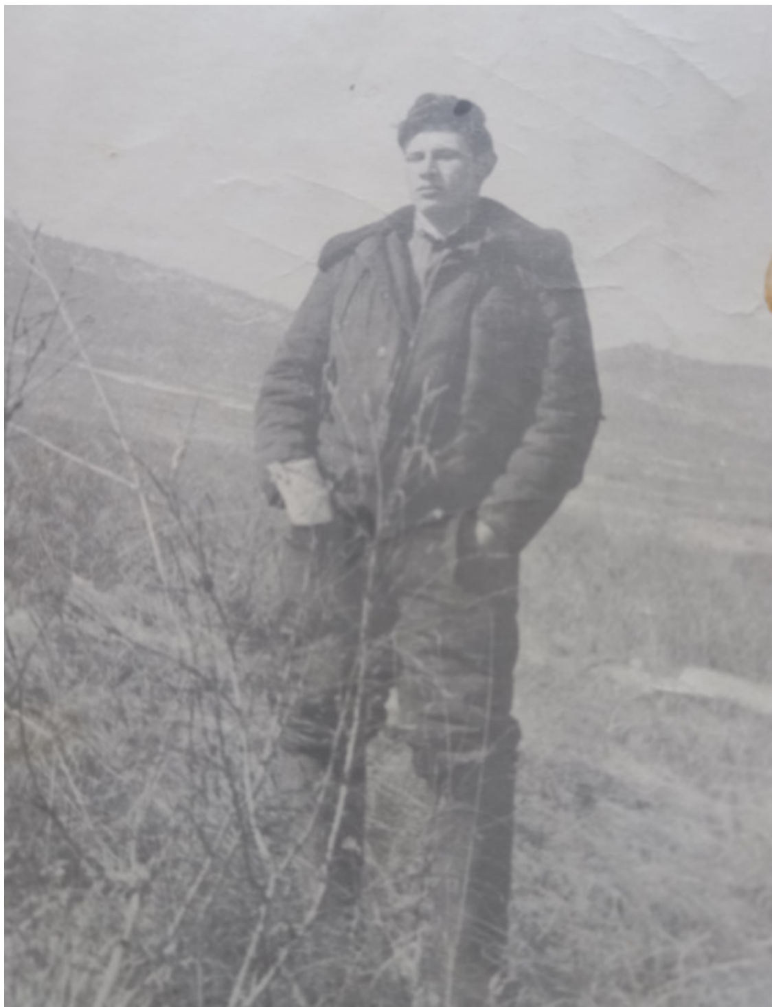
Мои первые учения. Март 1966 г. Приморье.