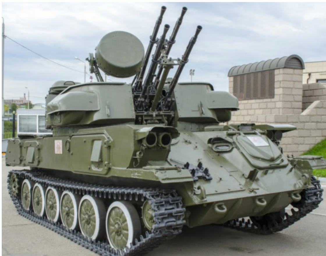
Зенитно-самоходная установка «Шилка»