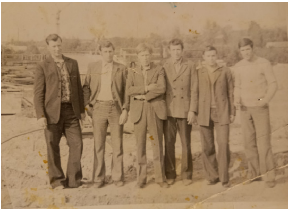
Мы были первыми. 1976 год. Сентябрь. Трест №2, СМУ-53. Бригадиры.

Подал я челобитную на начальника управления: имею высшее техническое образование и прошу изыскать возможность использовать меня на инженерной должности. Он принял эту новость без восторга: типа, инженеров и так пруд пруди – и ты туда же. Дошло до управляющего трестом. Грех не вспомнить о нем.