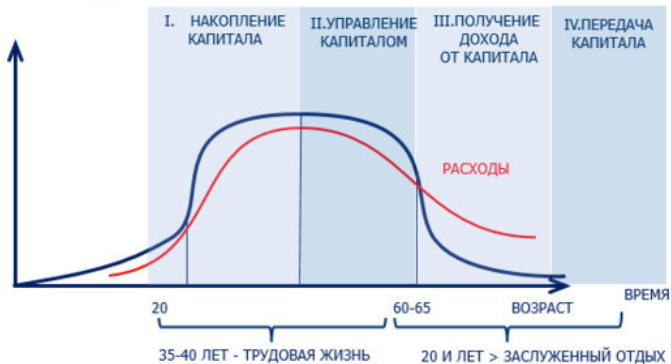
Рисунок 4. Доходы и этапы построения личного благосостояния

Только в такой последовательности и не иначе. В любом производственном процессе предприятия этапы технологического процесса должны соблюдаться друг за другом в порядке очередности. Вы не можете, не замешав теста по рецептуре, не разогрев печь до нужной температуры, получить готовый хлеб. Нужный качественный продукт не получится, если пренебречь технологией производства.