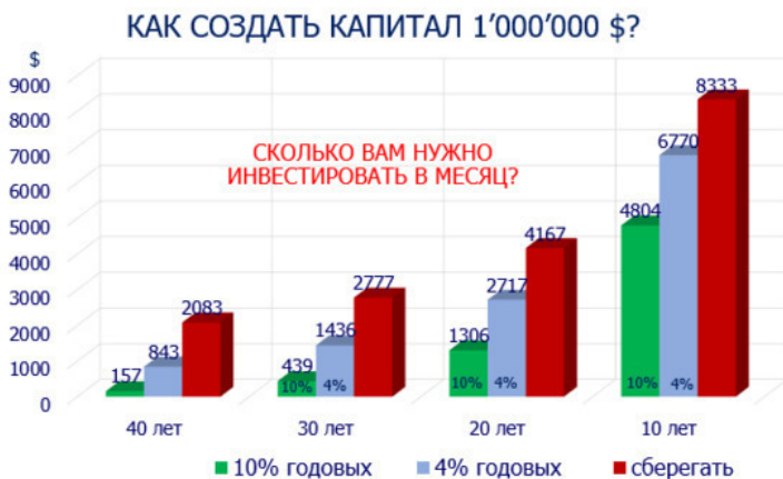
Рисунок 6. Сколько нужно инвестировать, чтобы создать капитал 1 млн долл.

«Если у вас нет плана как стать богатым, значит, Вы планируете быть бедным!» Р. Кийосаки. Так вы планируете быть бедным или богатым?