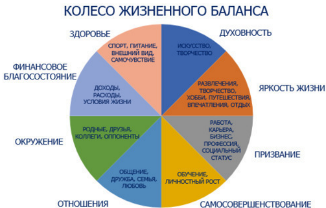
Рисунок 1. Колесо жизненного баланса

«Почему мы говорим о бизнесе в книге о личных финансах?» – спросите вы. В практике коучинга и саморазвития есть упражнение, в котором исследуются важные для человека области жизни, – колесо жизненного баланса.