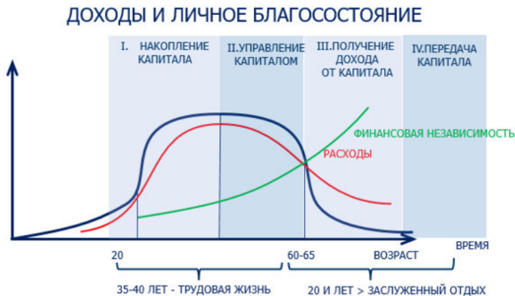
Рисунок 5. Этапы управления личным благосостоянием и финансовая независимость

35—40 лет активной трудовой жизни и зарабатывания (в среднем с 20 лет до 60) должны обеспечить вам последующие 20—30 и более лет, в тот период, когда вы перестанете работать в силу возраста. Это большой срок, поэтому денег потребуется немало. И если начинать создавать капитал лет в 30—35, то на реализацию этой цели останется меньше времени – всего 25 лет, а задача усложнится. За 25 лет накопить нужную сумму сложнее, чем за 35—40, придется больше откладывать, нагрузка на бюджет может быть непо-