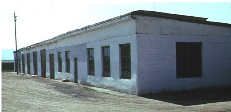
Гараж на территории ДОСААФ бокс №3

дом со смотровой ямой были скрыты – замурованы, найденные при его строительстве, останки неизвестной женщины... На представленных фотографиях видно, как выглядели тогда сам гараж и та самая смотровая яма.