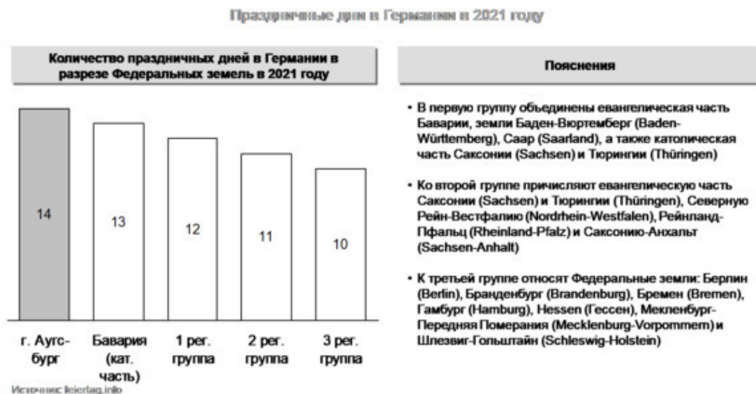
Схема 1. Праздничные дни в Германии в 2021

Как тут не вспомнить доводы экономистов о том, что выходные дни для любого государства достаточно дорогое удовольствие. К тому же практики переноса праздничных дней, чтобы обеспечить более продолжительный отдых, просто нет – предполагаю, что для адаптации к этому обстоятельству потребуется определенное время. Конечно, не все так грустно, как может показаться на первый взгляд, ведь профсоюзы в Германии представляют собой достаточно грозную силу, способную, в том числе, влиять на количество рабочих часов в неделю, а также лоббировать и другие преференции для своих членов, что они с переменным успехом и делают.