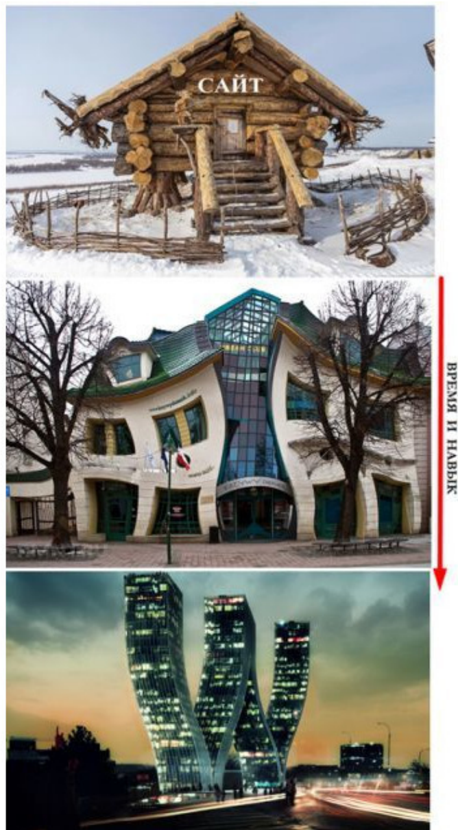
– Абалак (Тобольск) «Резиденция Бабы-Яги». – «Кривой дом» шведского дизайнера Пер Далберг в польском городе Сопот. – Проект небоскрёба Walter Towers в виде буквы W.

Если вы новичок, не питайте особых иллюзий относительно ваших возможностей. Процесс создания хорошо функционирующего сайта не такой уж сложный, как кажется на первый взгляд многим новичкам, но и не очень простой. Конечно он потребует большого упорства и определённых навыков, которые вы приобретёте только со временем. Но самое главное – это найти хорошего наставника или хотя бы хорошее руководство по сайтостроению!