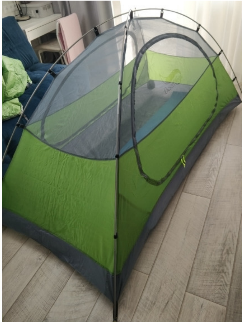
одноместная Desert Fox – теперь мой таежный дом

Но в любом случае, имея длинный список моделей и фирм, вы захотите найти палатку под конкретные свои желания.