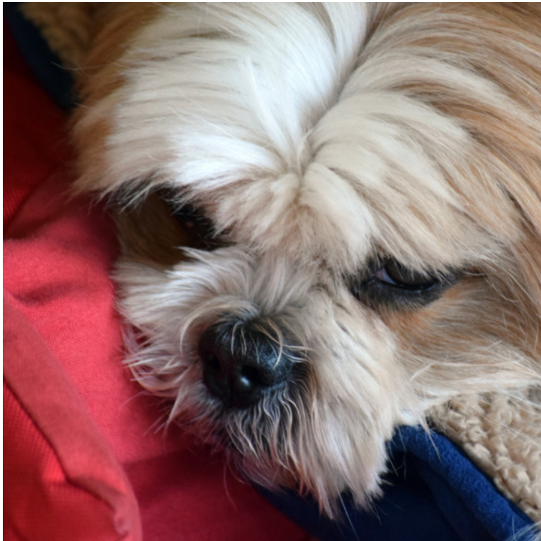
Фото Хачи 2