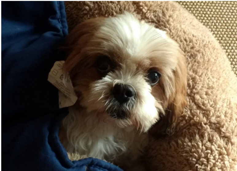
Фото Хачи 1: Чудо, а не собака...