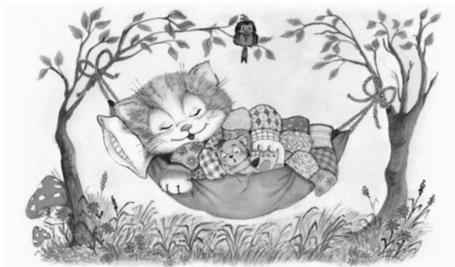
Рисунок Нины Панасенко