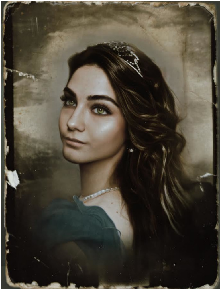
Автопортрет Эльзарэтт-Виктории в винтажном стиле