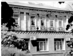
17 Старообрядческая община