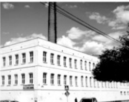
10 Фабрика Елагина