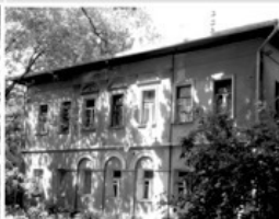
8 Дом Шелаева