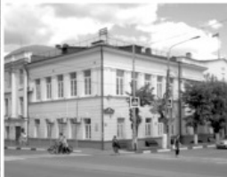
5 Земская управа