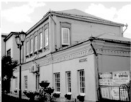
15 Пушкинский дом