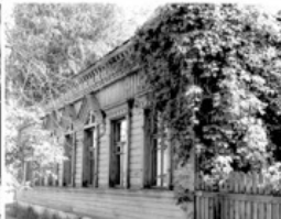
11 Дом Куприянова