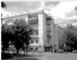
6 Тихвинская улица