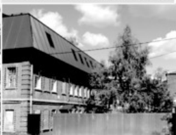
18 Фабричные постройки