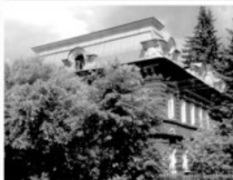
25 Дом Петра Зотова