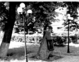
7 Памяти 209 полка