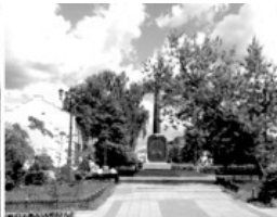
16 Сквер Бугрова