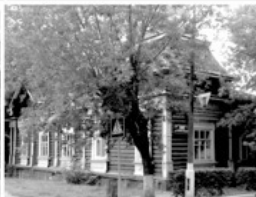
22 Дом кн.Вадбольского