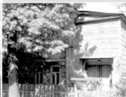
19 Дом где жил Пильняк