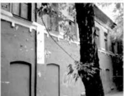
24 Казарма казачьей сотни