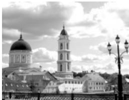
14 Богоявленский собор