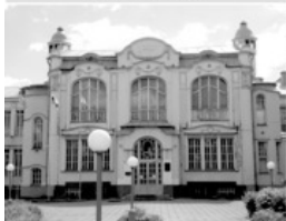
4 Женская гимназия