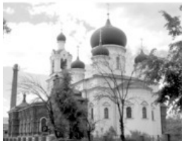
9 Тихвинский храм