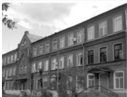
23 Ф-ка Тихона Зотова