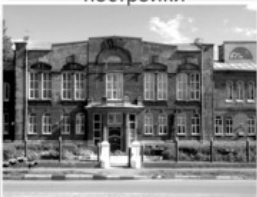
21 Реальное училище