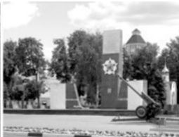
3 Мемориал Славы