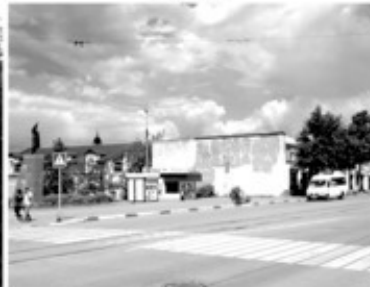
27 Торговые ряды