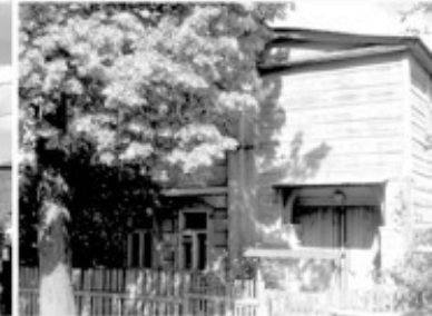
19 Дом где жил Пильняк