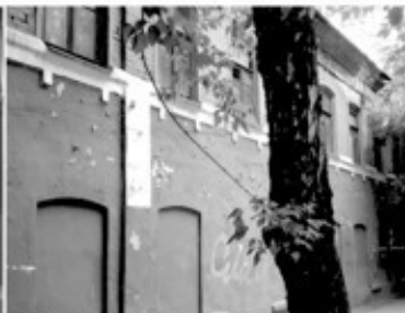
24 Казарма казачьей сотни