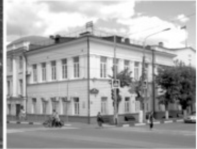
5 Земская управа