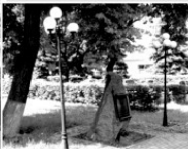
7 Памяти 209 полка