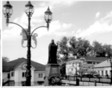
10 Патриарх Пимен