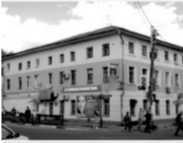
9 Дом Елагина