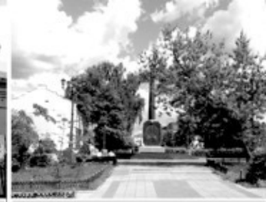
16 Сквер Бугрова