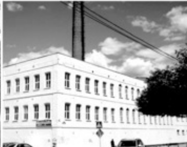
10 Фабрика Елагина