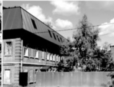
18 Фабричные постройки