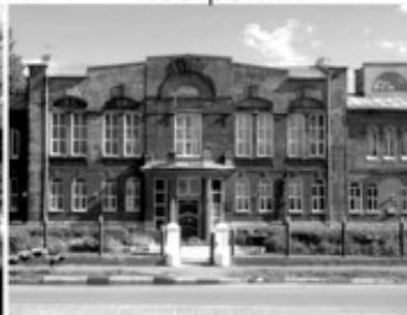
21 Реальное училище