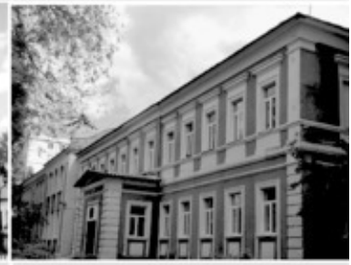
29 Уездное училище