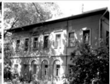
8 Дом Шелаяева