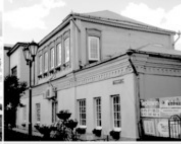
15 Пушкинский дом