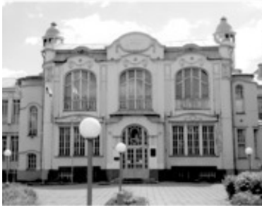
4 Женская гимназия