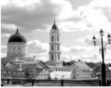
14 Богоявленский собор