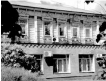
17 Старообрядческая община