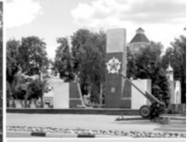
3 Мемориал Славы