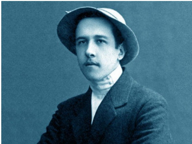
А. В. Чаянов

Близость к студентам, их интересам и запросам были потребностью души Александра Васильевича Чаянова. Особо теплые чувства профессор испытывал к первокурсникам. Весь первый учебный год подготовки молодых студентов Тимирязевки, приехавших из самых глухих районов страны, он водил их по театрам, картинным галереям, концертам, приобщал к русской и мировой культуре. Из своей зарплаты помогал нуждающимся.