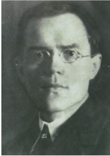
Н. Д. Кондратьев

За относительно недолгую (46 лет) жизнь Н. Д. Кондратьев создал богатое научное наследие. Основными направлениями его научных исследований считаются: закономерности статики, циклической динамики и социогенетики; исследование «больших» экономических циклов или длинных волн конъюнктуры; теория предвидения; вопросы планирования экономики; исследования экономической конъюнктуры; история учений о законах развития общества; общая теория систем («совокупностей»).