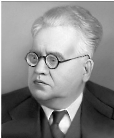
В. С. Немчинов

с 1928 г. по 1948 г., а в 1940—1948 гг. был директором этого старейшего аграрного вуза страны. В 1933 г. он написал выдержавший два издания учебник «Учет и статистика сельскохозяйственных предприятий». Это было первое учебное руководство по статистике совхозов и колхозов как нового объекта управления и статистического исследования.