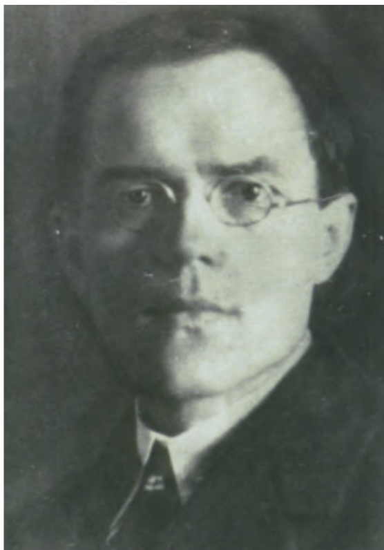
Н. Д. Кондратьев

За относительно недолгую (46 лет) жизнь Н. Д. Кондратьев создал богатое научное наследие. Основными направлениями его научных исследований считаются: закономерности статистики, циклической динамики и социогенетики; исследование «больших» экономических циклов или длинных волн конъюнктуры; теория предвидения; вопросы планирования экономики; исследования экономической конъюнктуры; история учений о законах развития общества; общая теория систем («совокупностей»).