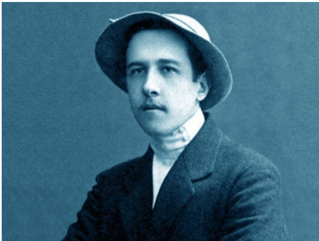
А. В. Чаянов

Близость к студентам, их интересам и запросам были потребностью души Александра Васильевича Чаянова. Особо теплые чувства профессор испытывал к первокурсникам. Весь первый учебный год подготовки молодых студентов Тимирязевки, приехавших из самых глухих районов страны, он водил их по театрам, картинным галереям, концертам, приобщал к русской и мировой культуре. Из своей зарплаты помогал нуждающимся.