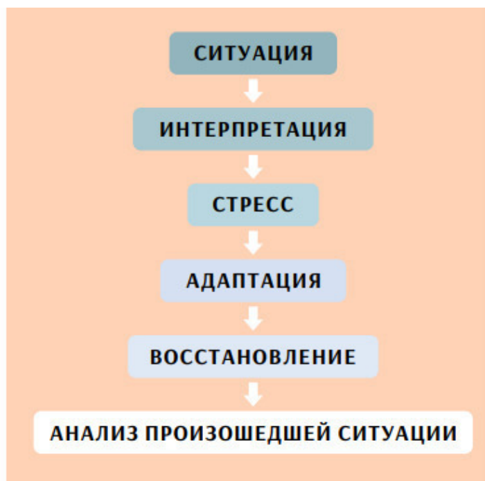
Схема работы стресса

По ней и построена логика этой книги – от первого и до последнего этапа. По этой логике устроена вся человеческая жизнь – хотим мы этого или нет.