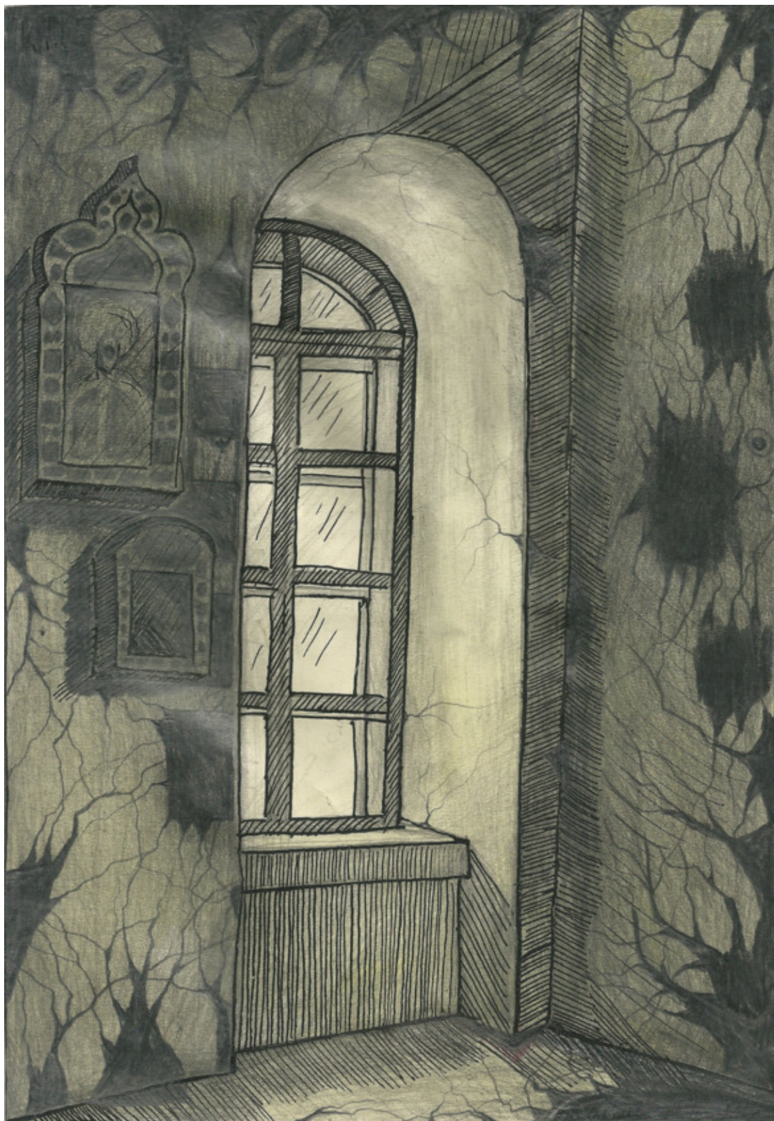
А. Глухов. Деталь интерьера (Богоявленский собор в Ногинске). 1990. Бумага, карандаш. 30X21.