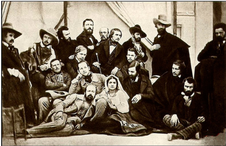
Н.В.Гоголь среди русских художников в Риме. Фото (дагерротип). 1845