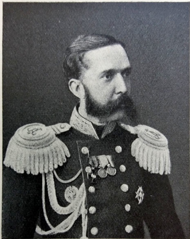
Свиты Его Величества генераль-маіоръ князь МИХАИЛЬ ВАЛЕНТИНОВИЧЪ ШАХОВСКОЙ-ГЛЪБОВЪ-СТРЪШНЕВЪ.