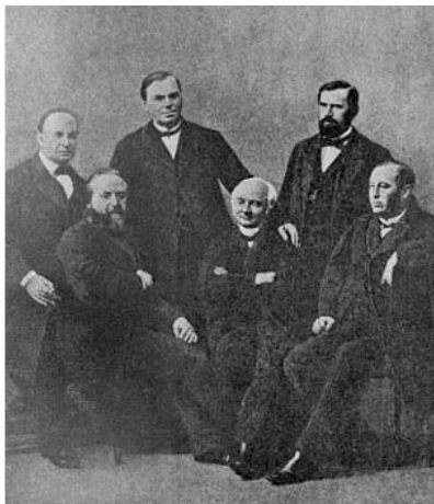
Иллюстрация из альбома «Кренгольмская мануфактура».