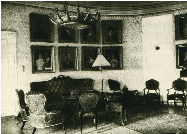
Обстановка дома в Белой Колпи.

(Вообще, западная окраина Московской губернии – одна из самых «стрешневских». В «Памятной книжке Московской губернии на 1899 год» в разделе «Расположенные в пределах Волоколамского уезда владения частных лиц, казенные, монастырские и проч.» указано, что в Яропольской волости Шаховской-Глебовой-Стрешневой Евгении Фёдоровне, княгине, принадлежало в целом 876 десятин земли). Можно ещё сказать, что Белая Колпь расположена всего в каких-нибудь 13 км к северо-востоку от станции Шаховская, а чисто «стрешневское» Раменье – в 15 км к северу от неё же, на дороге, связывающей с другим райцентром – Лотошино,