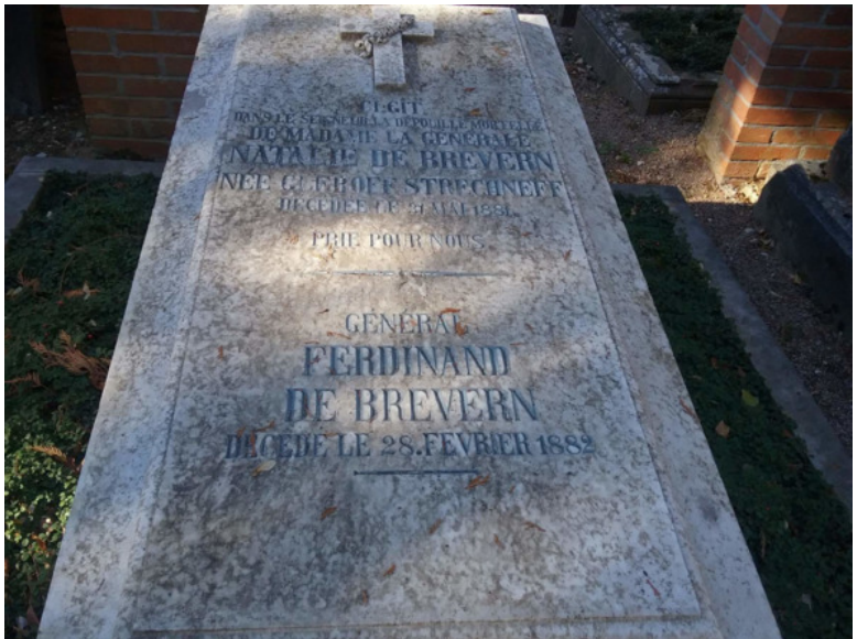
Фото 2019 г.

Надгробие Ф. фон Бреверна и Н.П.Глебовой-Стрешневой на Русском кладбище в Висбадене. Фото 2019 г.