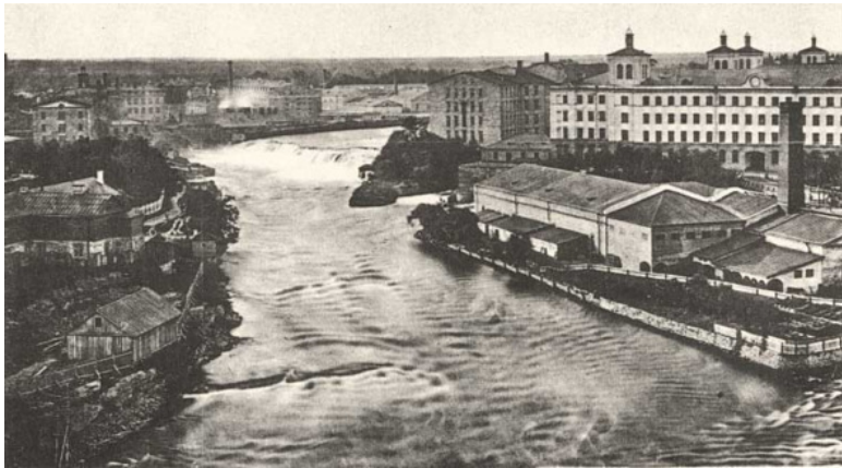
Кренгольмская мануфактура. Фото 1886 г.