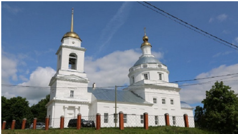
Храм во имя Андрея Первозванного в Белой Колпи

других усадебных построек сохранились до нашего времени.