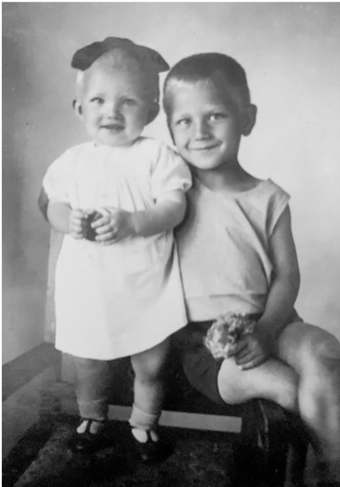
С братом Женей