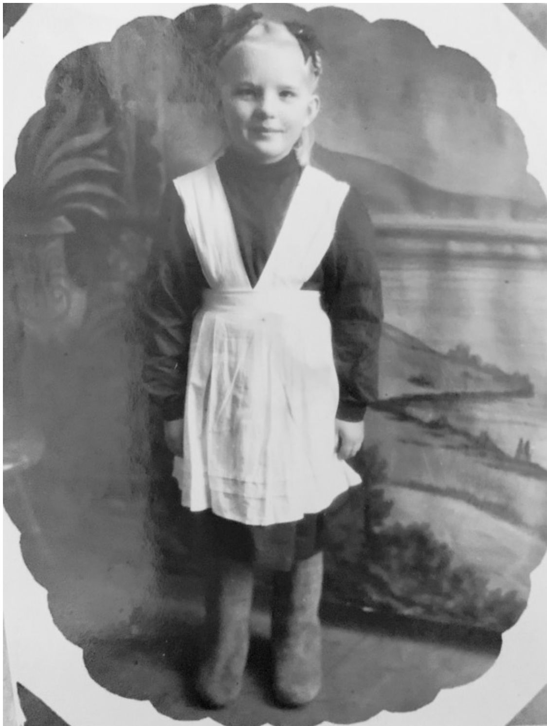
Галя в школьной форме

В Архангельск семья прибыла к осени. Низкое северное небо, сквозь которое едва проглядывало немощное солнце, нагнетало тоску и безнадежность. После цветущего Бердичева, сияющего золотыми куполами, Архангельск выглядел подавленным и мрачным.