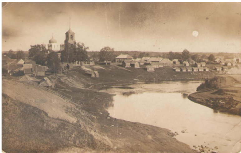
Село Берёзовский Рядок в начале XX века. Вид на церковь.

го земства и МНП был выстроен деревянный дом. В этой школе обучались 50 мальчиков и 11 девочек – Березорядское Образцовое училище. К 1917 году оно стало 4-классным, а ЦПШ- 3-классная.