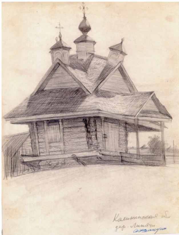
Часовня в д. Липячи (не сохранилась). Художник Завен Аршакуни (карандаш).