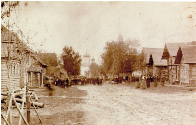
Берёзовский Рядок в престольный праздник.

Березовский Рядок – родина известного бологовского фотографа начала XX вв. Колчина Василия Ивановича. Он в Бологое имел свою усадьбу – усадьба Боровичи.