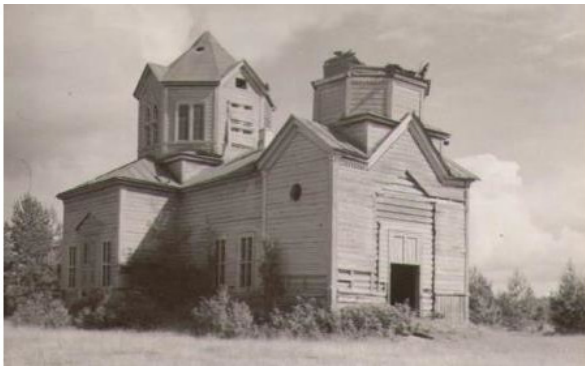
Владимирская церковь (не сохранилась) в с. Любитово. 1970 год.

В виду угрозы захвата края немцами составлялись списки партизанских отрядов. В глухих урочищах делались схроны с оружием, продуктами, медикаментами. Все сельсоветские документы приказано было сжечь. Постепенно на фронте оказались все годные мужчины. Лошадей забрали на нужды армии. Колхозники пахали и выполняли прочие работы на быках, коровах, а то и на себе. Заставляли возвращать облигации займов, сдавать валенки, вязать варежки для Красной Армии. Из колхозов выжималось все, что можно, в фонд обороны. У колхозов росли долги перед государством, которые пришлось выплачивать еще долгие годы после войны. От этого колхозы так и не смогли встать на ноги.