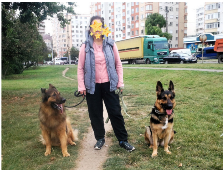
Зевс и Кейси. Двигаемся на поле.

Рывкнули, рыкнули вместе с подругой, Кейси одумалась. Разглядели причину – крупная дворняга кралась вдоль дома буквально перед носом. Вопиющее безобразие, нарушение суверенитета, попрание частной территории, которой Кейси считает общественный двор. Но это – её двор, где живут друзья – Джуля и Рыжий.