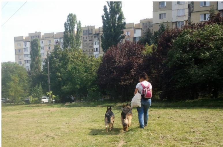
Фото автора, подруга с Кейси и Зевсом