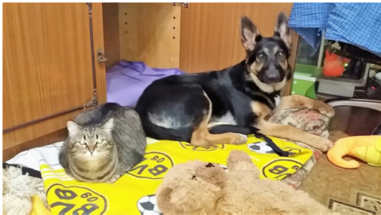
Кейси – 6 месяцев

По другу, которого потеряла и вновь обрела. Никто не возвращается назад. И только кошка совершила невозможное – отстояла своё право на прежнюю жизнь. С новой овчаркой по имени Кейси.