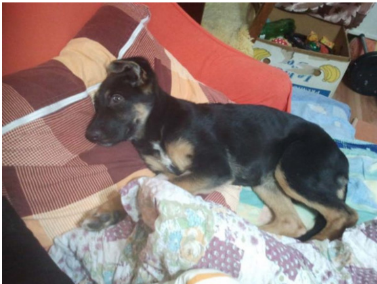
Фото – Кейси на моей подушке, любимом Тигрином месте

На Тигрино место пустили чудовище. Оно располагалось на моей подушке и теперь доставало до спинки дивана. Зубастая пасть дотягивалась почти до всех укромных местечек, ранее недосыгаемых. Нигде Мурке не было покоя.