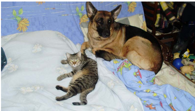
Мурка и Тигра, фото автора

Нашей Мурке одиннадцатый год. Выросла кошка с овчаркой Тигрой, спали вместе со мной на диване. Собачий век несправедливо короток, и в апреле прошлого года проводили её за Радугу. Рухнул привычный мир. Для всех и для кошки – тоже.