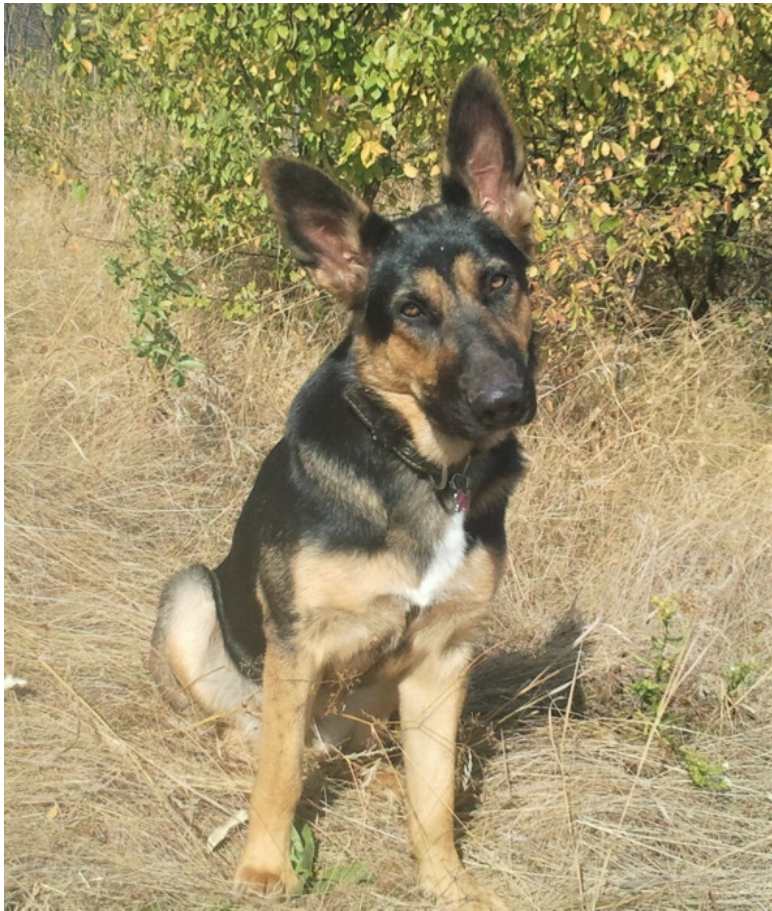
Кейси в день рождения 1 год