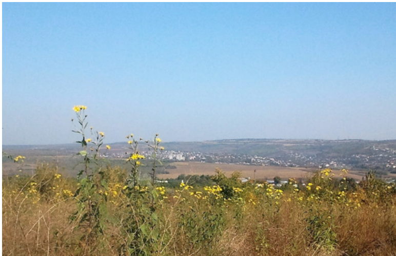
Фото автора, топинамбуры

На поле среди топинамбуров мы с подружкой и раскинули праздничный «стол». Достали термосы с чаем, разложили сладости. Кейси моментально пристроилась рядом, предвкушая угощение. Зевс чинно лежал в сторонке.