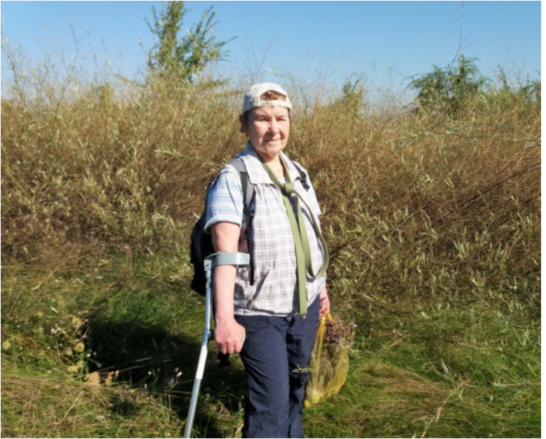
Фото автора, сентябрь 2021

Раньше их и не было, появились в прошлом году, когда во время карантина нигде гулять не разрешали, а народ ринулся на поле воздухом дышать.