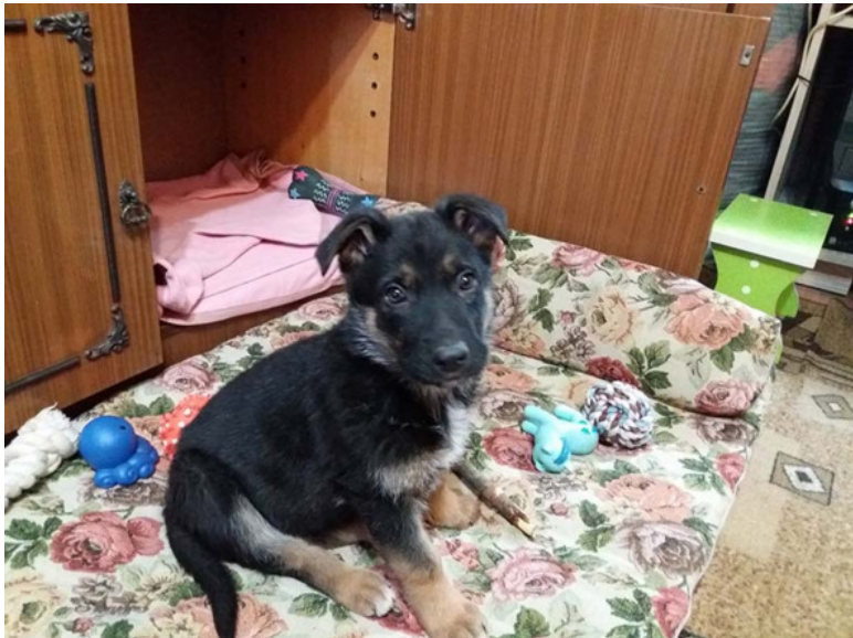
Кейси 2 месяца

Мурка забилась в самый дальний угол – за стол под батарею. Выманить не смогли. Ночью сама проскользнула в туалет и назад. Просидела сутки. Не пила, не ела, в логово не пряталась.