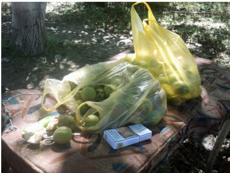
Орехи – грецкие, здесь они ещё в зелёных шкурках

Двинулись дальше, а там опять даров природы видимо-невидимо, алычой давно все морозильники забили, она растёт и растёт.