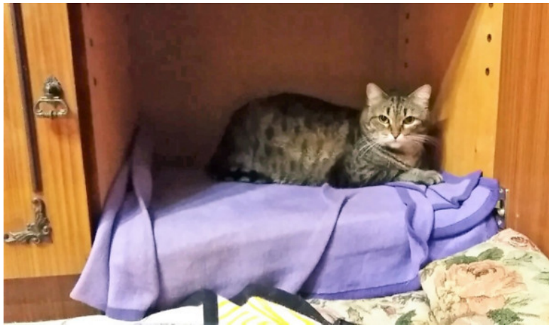
Мурка в домике