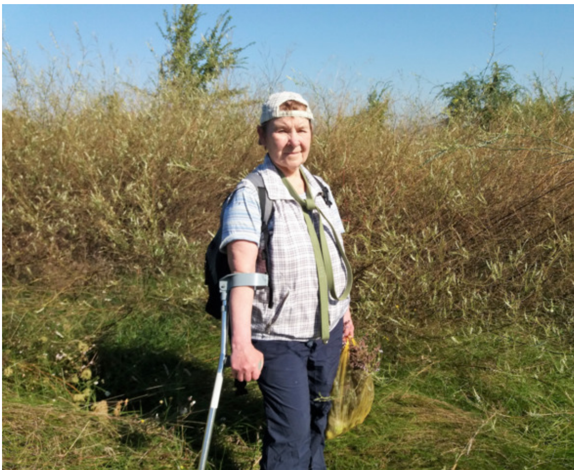
сентябрь 2021

А там! Бурьян частично высох и полёг, и всё равно получался выше моей головы. Привычные дорожки оказались непроходимыми. За счёт этого – никаких людей вокруг. Раньше их и не было, появились в прошлом году, когда во время карантина нигде гулять не разрешали, а народ ринулся на поле воздухом дышать.