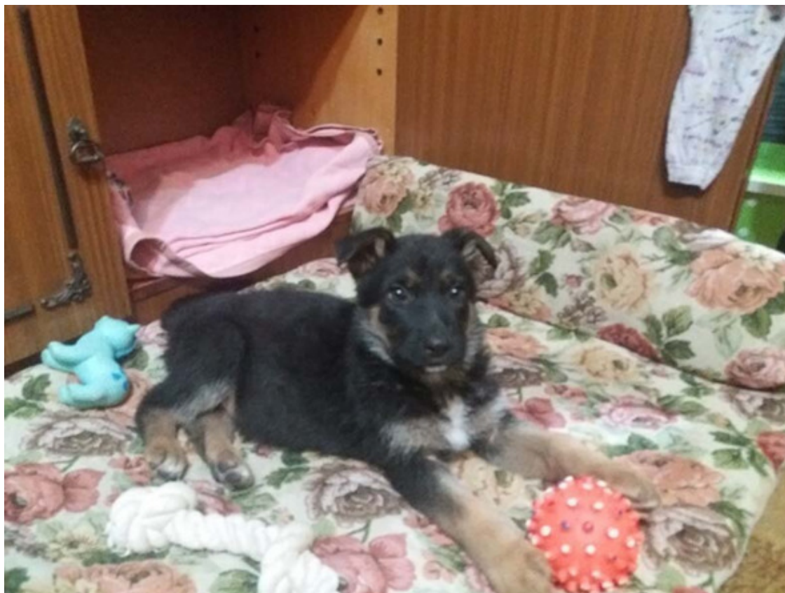
Кейси 2 месяца

Вторая проблема – при Тигре не было маленьких детей. Щенок передвигался по всей квартире беспрепятственно.