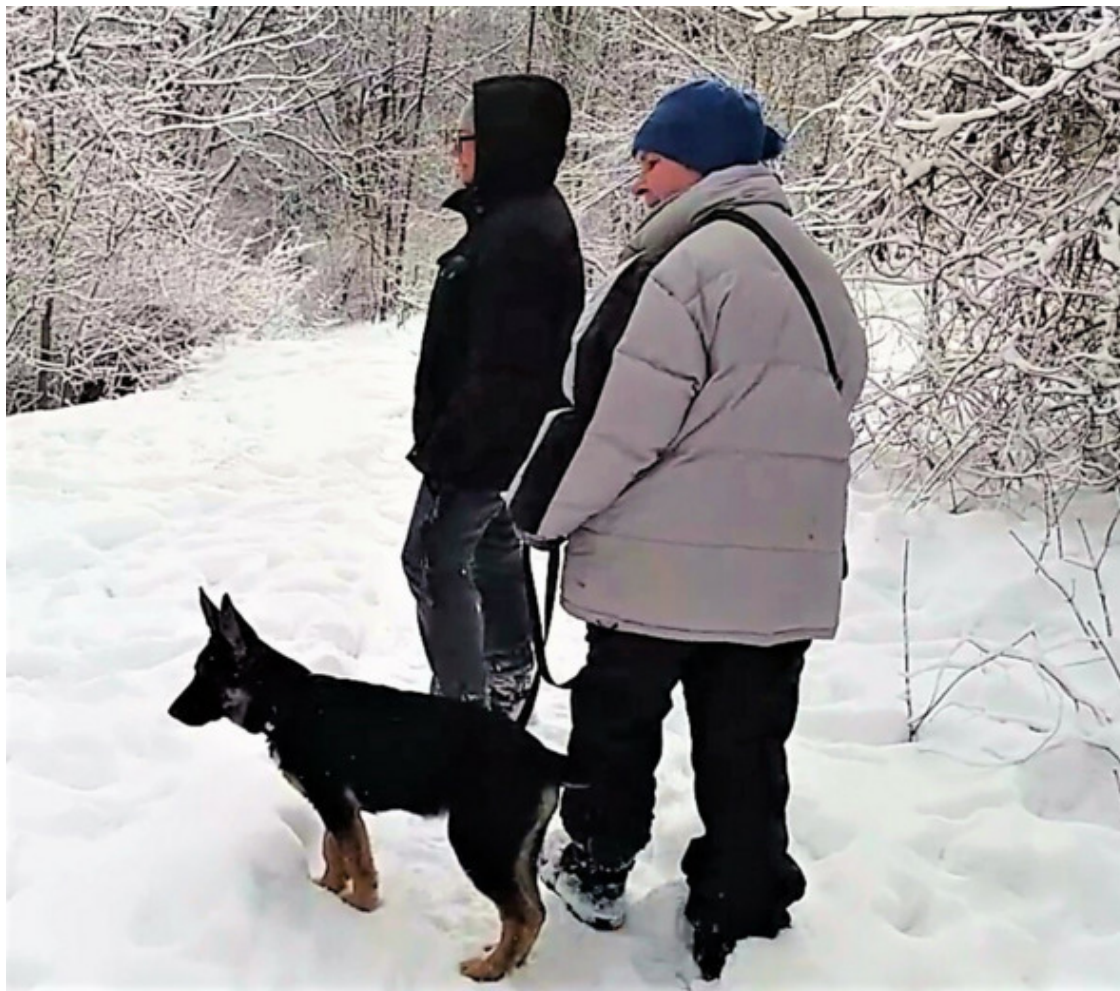
Подруга, я и Кейси – 3,5 месяца. Зевс за кадром остался

Со щенком гуляют пять раз в день, затем – четыре, в полгода – три. Мы с мужем натапывали километры. Раньше ходили по очереди, теперь тренировались вместе.