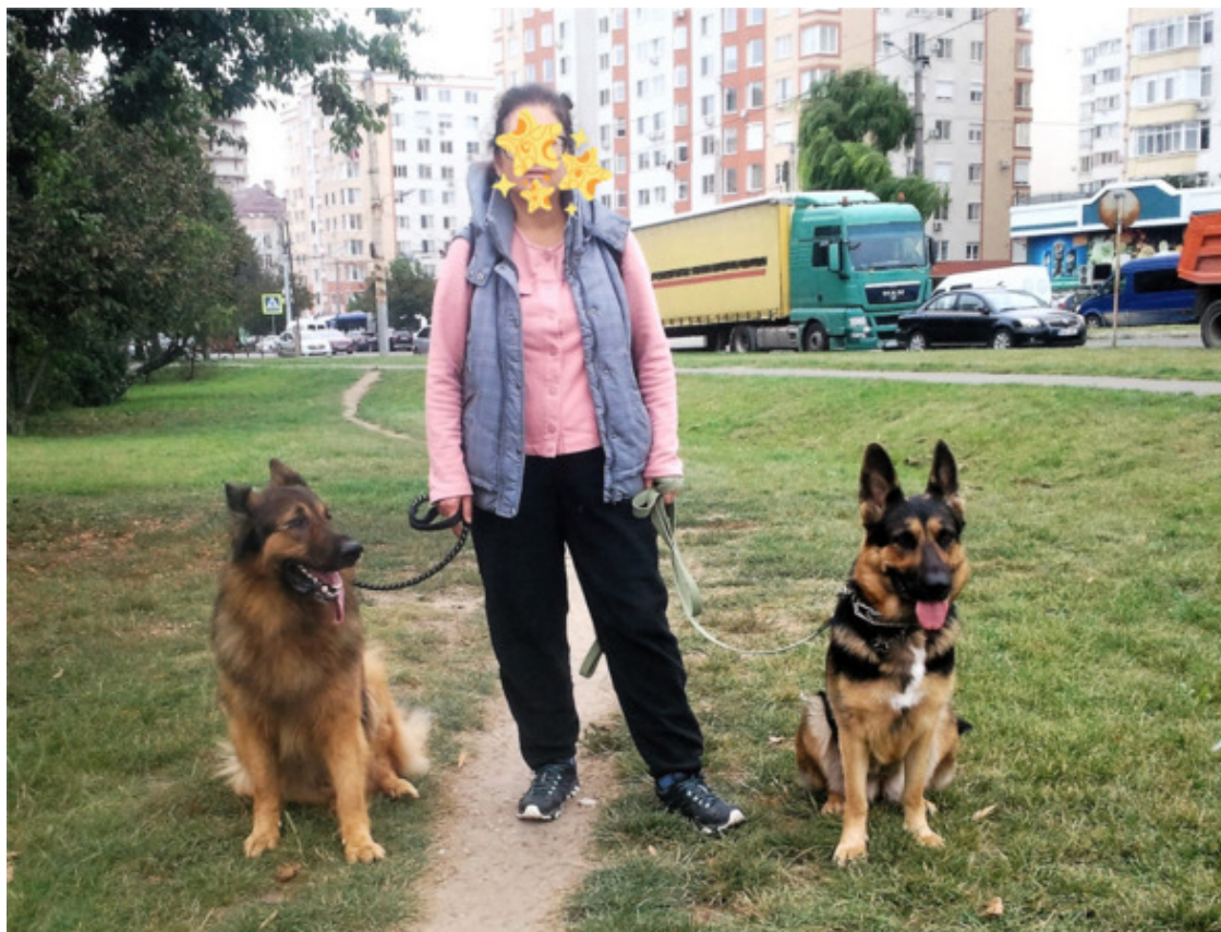
Зевс и Кейси. Двигаемся на поле.

Рявкнули, рыкнули вместе с подругой, Кейси одумалась. Разглядели причину – крупная дворняга кралась вдоль дома буквально перед носом. Вопиющее безобразие, нарушение суверенитета, попрание частной территории, которой Кейси считает общественный двор. Но это – её двор, где живут друзья – Джуля и Рыжий.