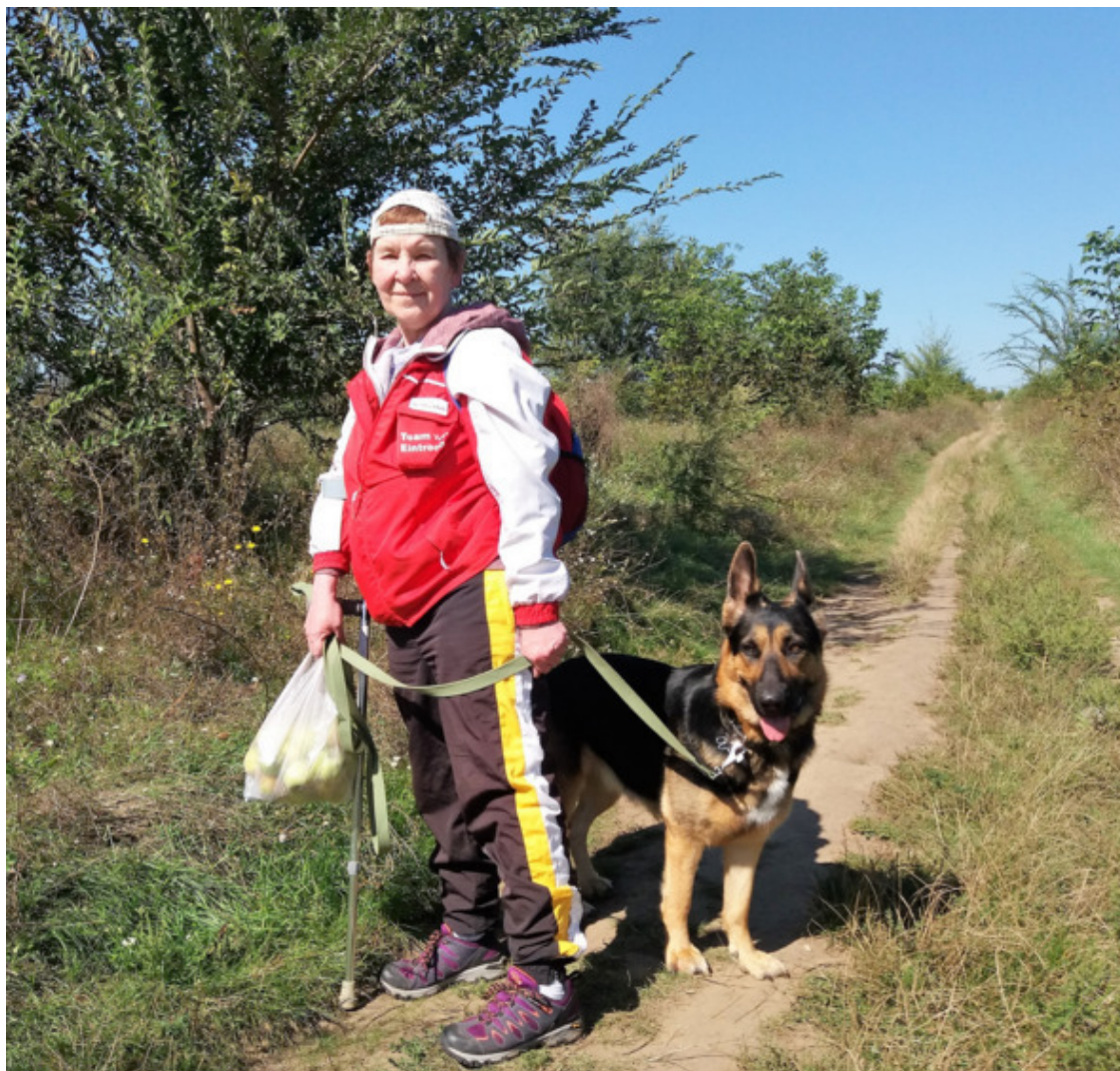
Я и Кейси. На поводке, потому что выходим к шоссе

Муж с подругой ругались – куда волоку? Себя бы в целости и сохранности донесла. Разумные доводы никак не действовали, главное всё в дом утащить, в норку спрятать. Дух собирательства, генетическая память. Со стороны посмотреть... лучше промолчу.