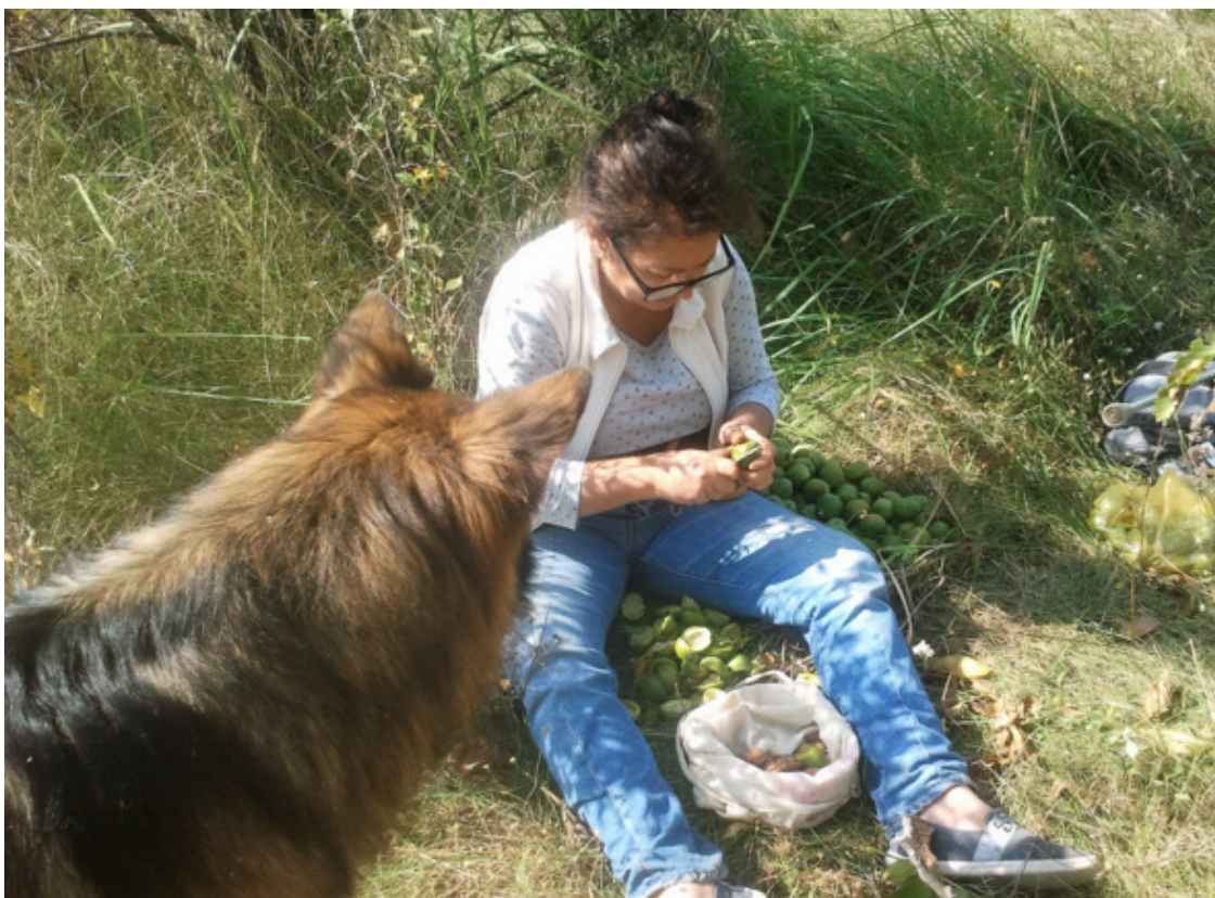
Подруга и Зевс