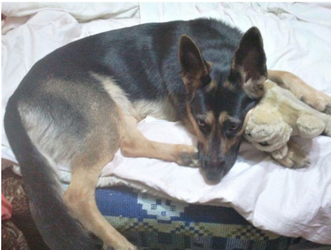
Кейси год и три месяца

...Пришла кошка. Улеглась мне на плечо, запела песню над ухом. Собака завозилась на своём матрасике, прислушалась. Зевнула, потянулась и тоже явилась ко мне на диван. Развалилась поперёк, тяжёлую морду пристроила мне на колени. Закрывает глаза и засопела.