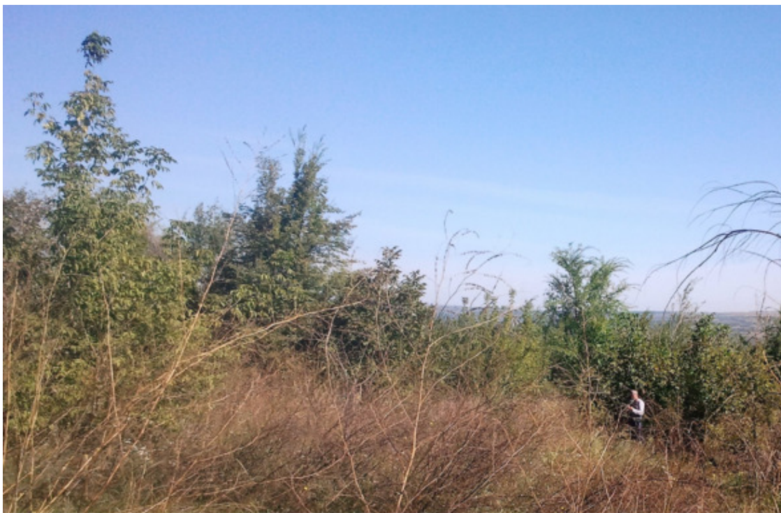
Муж возле орехового дерева

Совершенно не ожидали подобного великолепия, по два полных рюкзака домой приносим. Плюс ещё алыча в руках, яблоки.