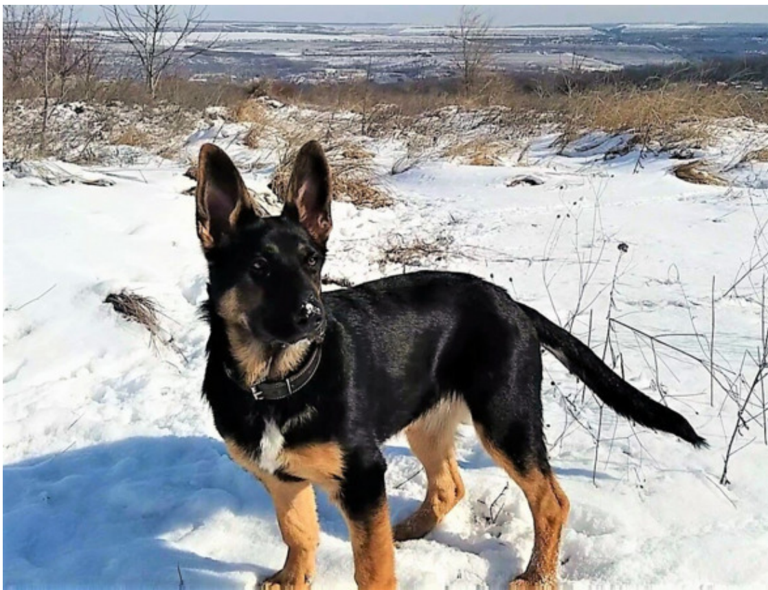
Кейси 5 месяцев

И слушаться Кейси не собиралась. С Тигрой я гуляла одна, занималась на каждой прогулке.