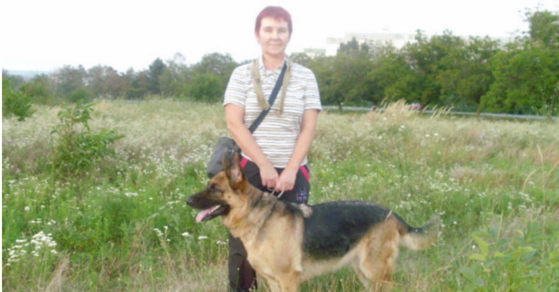
Я с Тигрой на поле

Последний Тигрин год работала и редко гуляла с собакой. Занимался муж, да и она уже не скакала. Мне «стукнуло» 63.