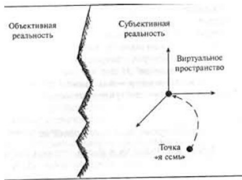
Рис.3. Информационные техники действенных мыслей.

Таким образом мы делаем важнейший шаг – шаг к управлению событиями: