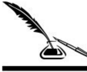
Рисунок на переплете: JJs / Alamy / Legion Media.