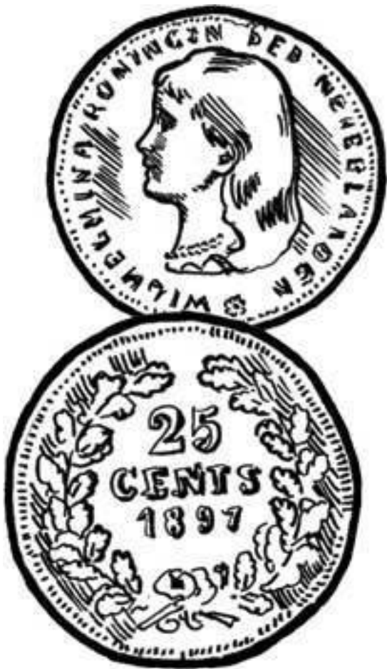
25 центов 1897 г. с портретом королевы Вильгельмины