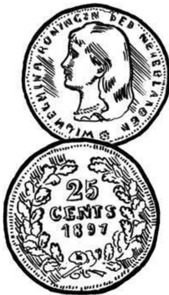
25 центов 1897 г. с портретом королевы Вильгельмины

– Привет! Наконец-то у меня появится подруга. Как же мне скучно тут одной среди всех этих брошек, заколок и расчесок! Они такие молчуны, ни о чем не хотят говорить.