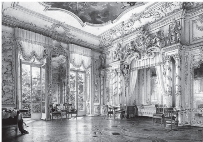
Покои императрицы Елизаветы.