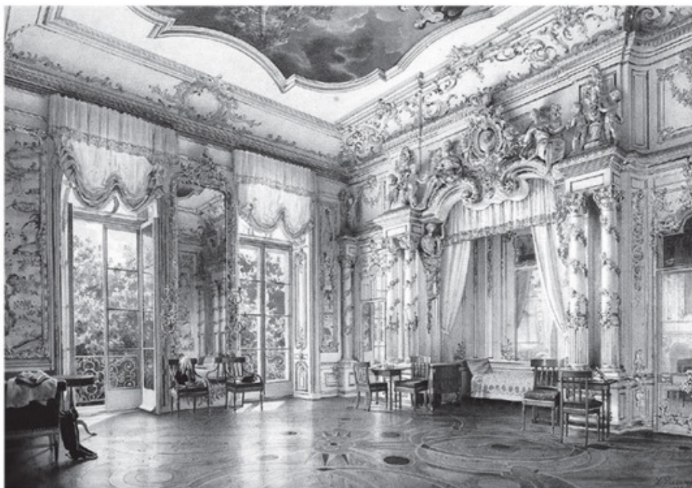
Покои императрицы Елизаветы.