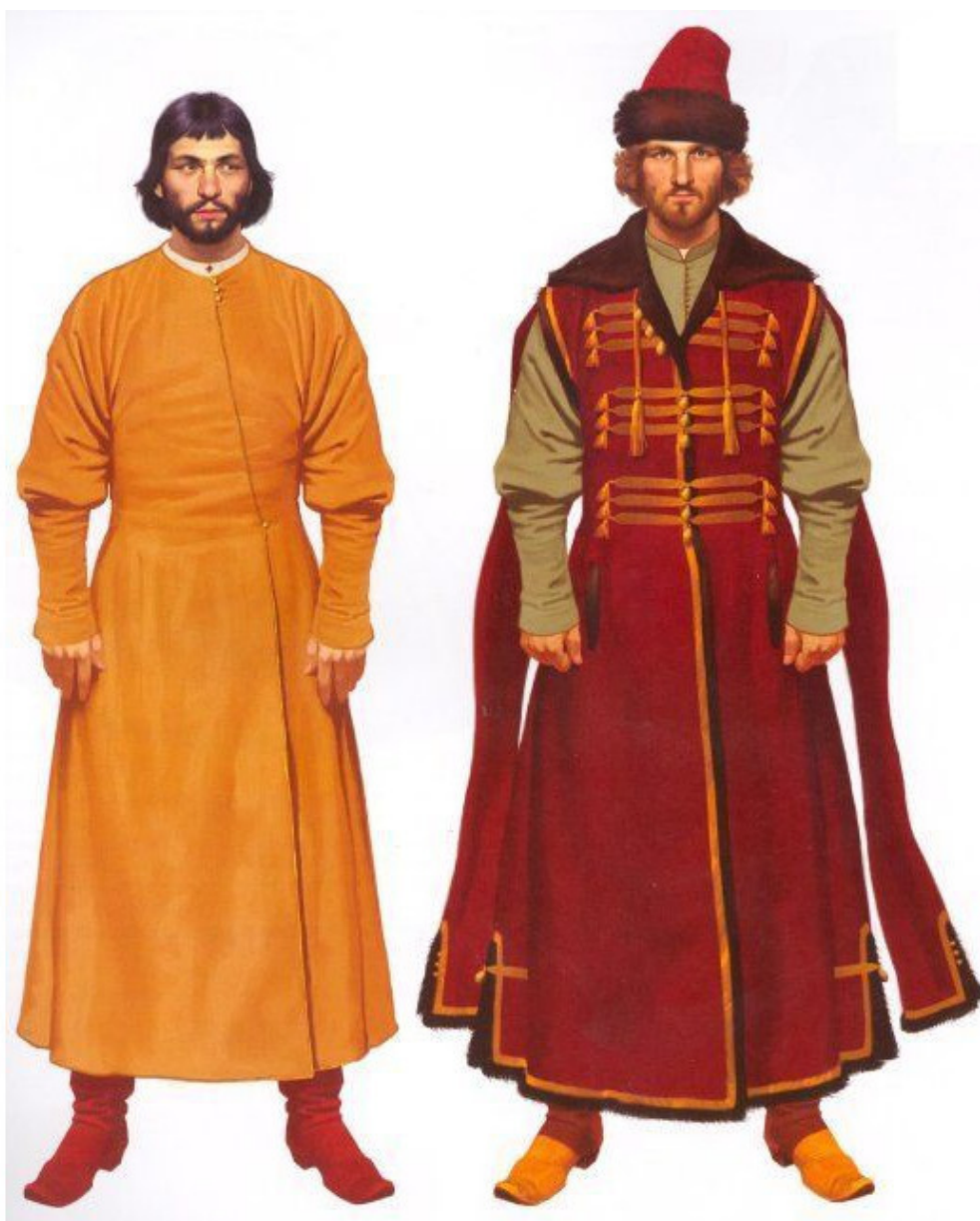
княжеское облачение 17 века