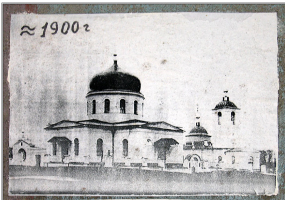
Спасская и Казанская церкви села Гагино