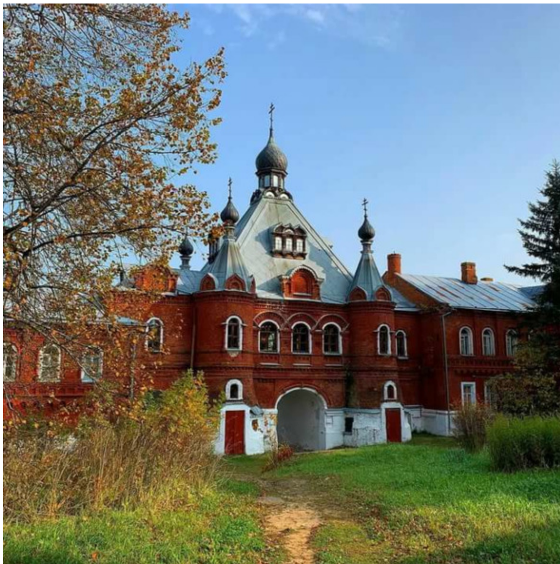
Свято -Смоленская Зосимова пустынь