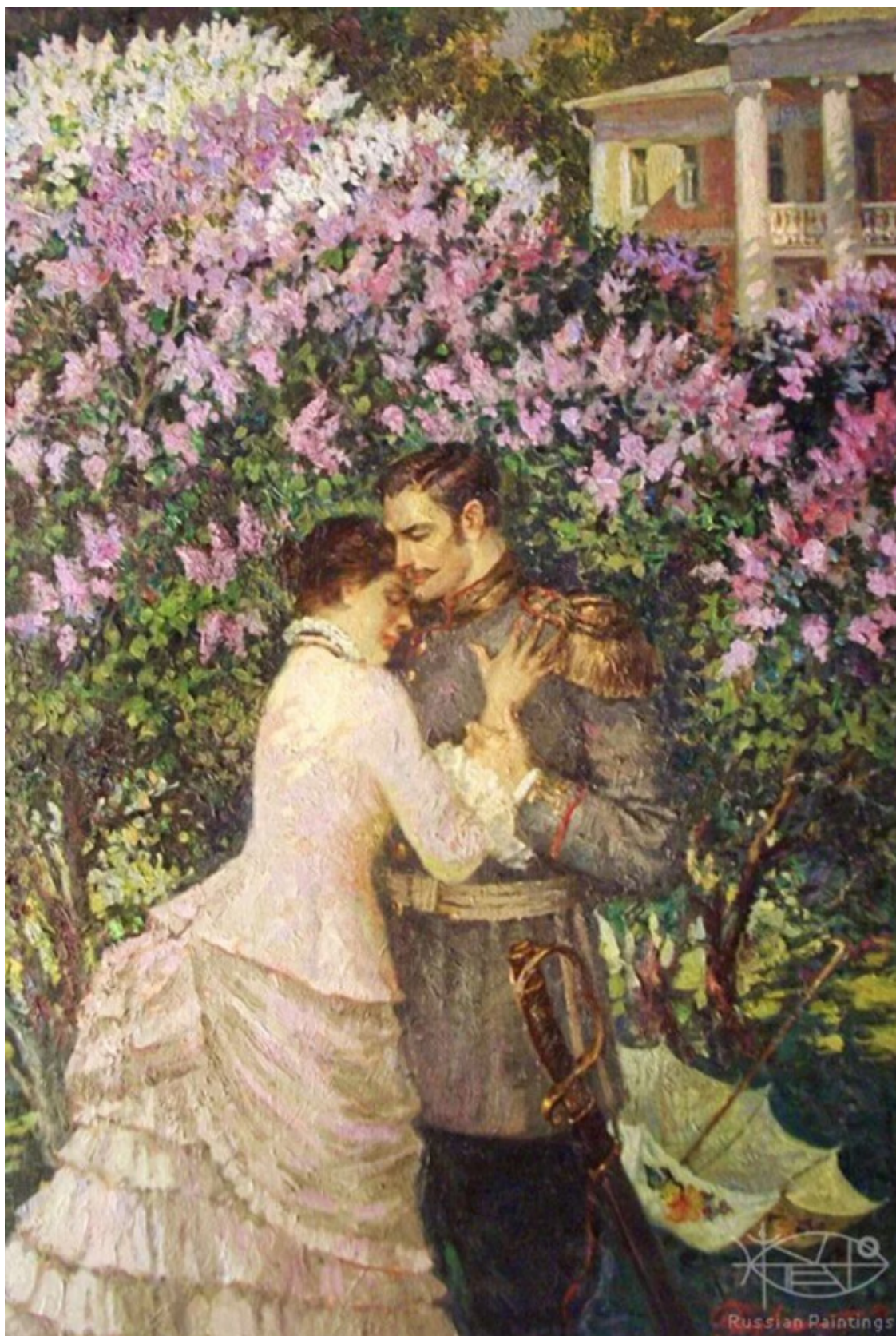
Владимир Первунинский «В саду»

Калачовы* граничили с Яковлевыми в Юрьевском уезде. Частые времяпрепровождения способствовали тому, чтобы между молодыми людьми вспыхнуло взаимное чувство.