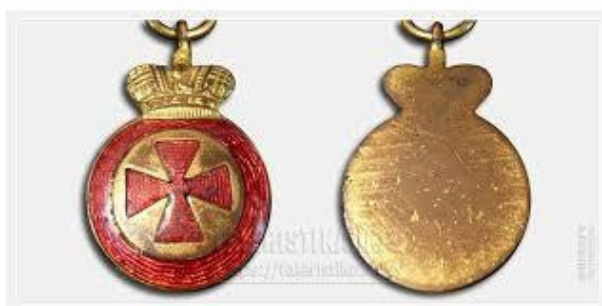
орден св. Анны 4й степени